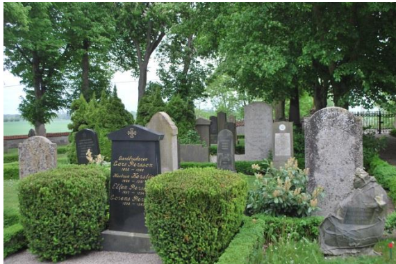
Kyrkogården öster om kyrkan.

Del två västerut är också omgiven av en putsad mur avtäckt med tegel i norr och söder. Trädkransen av oxel är nyplanterad och låg. Här är alla gravar omgivna av buxbom och täckta med singel. Gravarna ligger i strikta rader. Stenarna är låga och horisontella. Mycket vintergröna buskar är planterade på gravarna. Den tredje delen i väster, som är den största, är enbart grässådd med diverse träd och omges av en friväxande häck av hassel med inslag av lövträd, bland annat pil. Här finns minneslundan som har en böjd häck i väster. Från minneslundan finns utsikt över fälten.