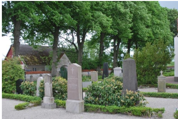
Norr om kyrkan med överbyggd grind i muren.