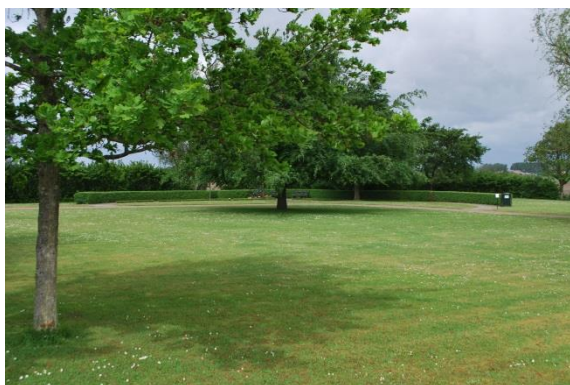
Minneslundan längst i väster.