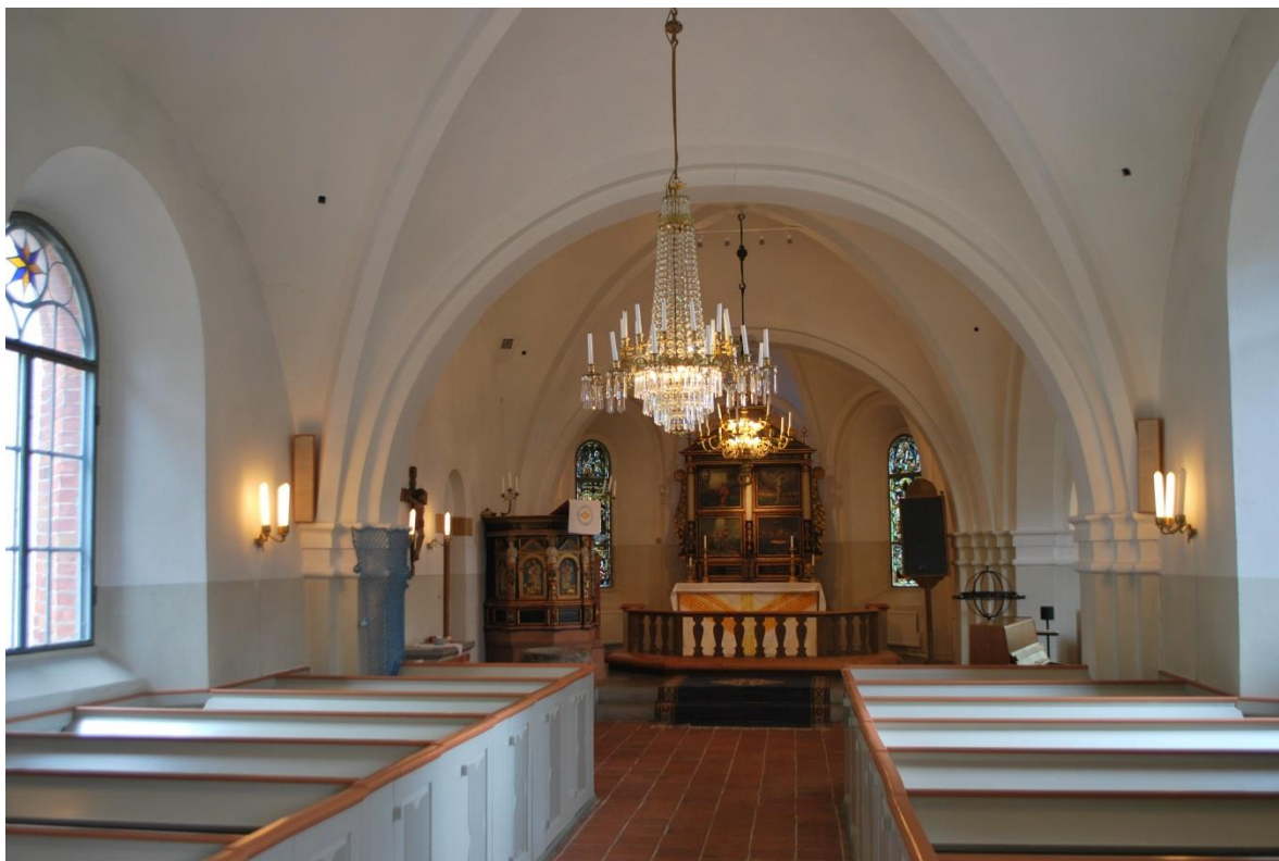
Långhuset mot koret i öster.