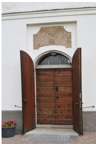
Huvudentré mot väster.

Fönstren av gråmålat gjutjärn från 1861 sitter inmurade i rundbågiga öppningar med rött tegel i flera språng. Även solbänkarna är av rött tegel. Fönstren är indelade i rektangulära partier med halvrunda avslutningar och en cirkel överst. De har klarglas förutom översta cirkeln med färgat glas. Innanfönster med stålbågar sattes in 1954. Långhuset har fyra fönster, tornet två och korsarmarna vardera två fönster. Tegelomfattningarna har tidigare varit rödmålade vilket syns i ovankant där de varit mer skyddade från väder och vind. Korets två smalare fönster har blyinfattade glasmålningar från 1955. Tornet har en ljudöppning i varje väderstreck täckta med brädluckor.