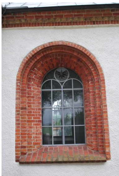
Fönster och tegelfris längs taket.