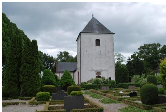
Fasad mot väster.