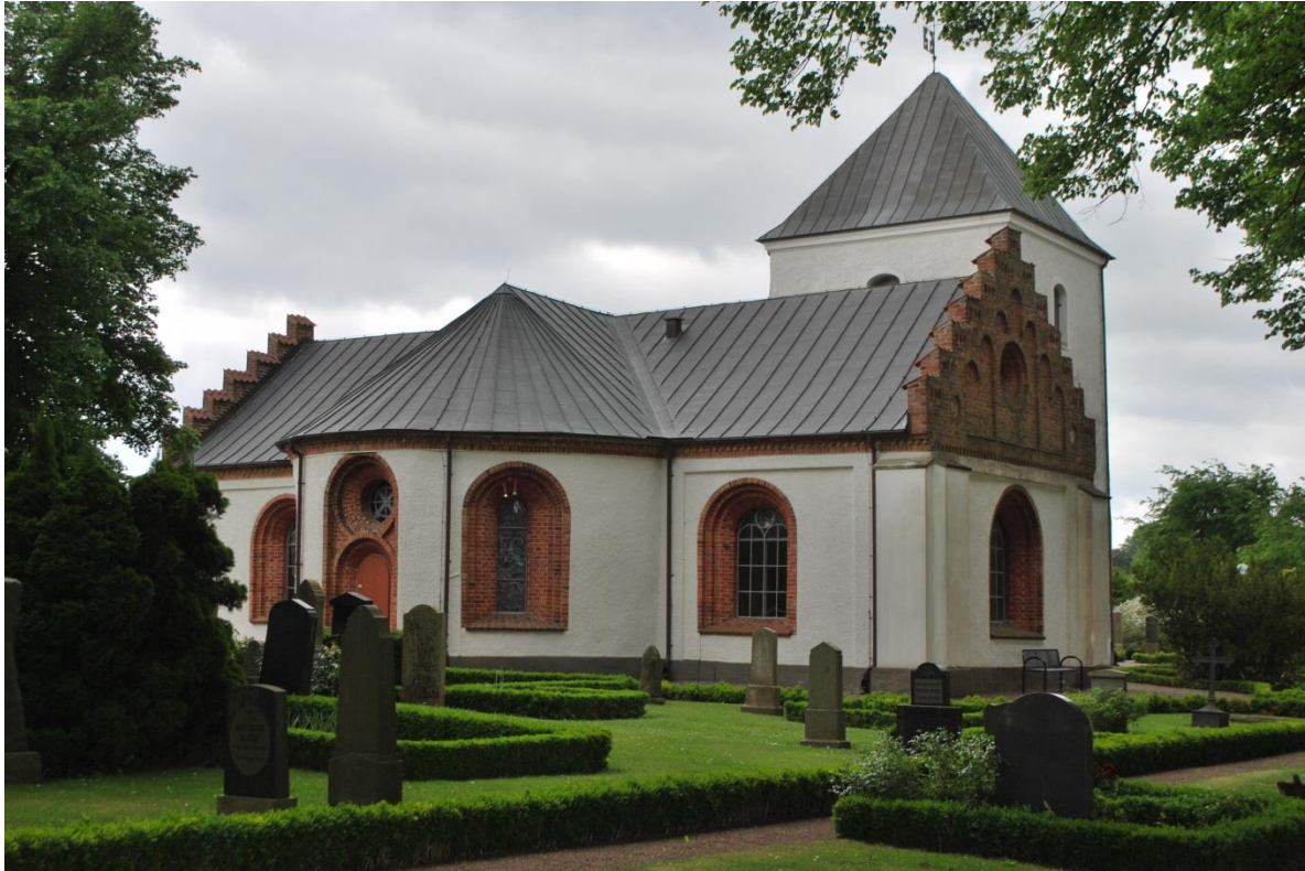
Fasad mot nordöst.