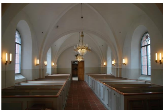
Långhuset mot vapenhuset.