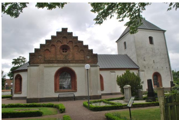
Fasad mot norr.

Tornet är försett med flera svartmålade ankarslut. Korsarmarnas gavelrösten i oputsat tegel är försedda med trappstegsgavlar och rundbågiga blindingar, rundbländen och ett runt fönster.