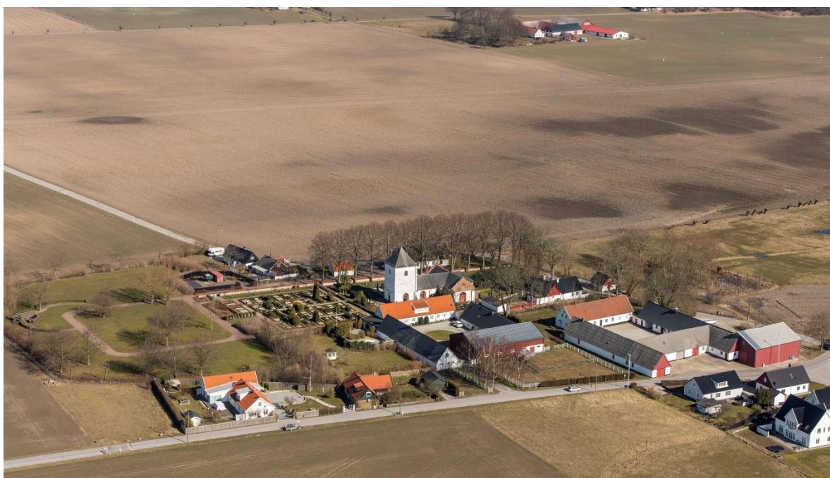
Från sydväst.

Glostorps by ligger sydöst om Malmö, på slätten omgiven av jordbruksmark. Området har varit bebott sen förhistorisk tid vilket fornlämningar visar. Glostorp skrevs Glosthorp på 1300-talet. Ändelsen -torp i betydelsen nybygge brukar hänföras till vikingatiden.