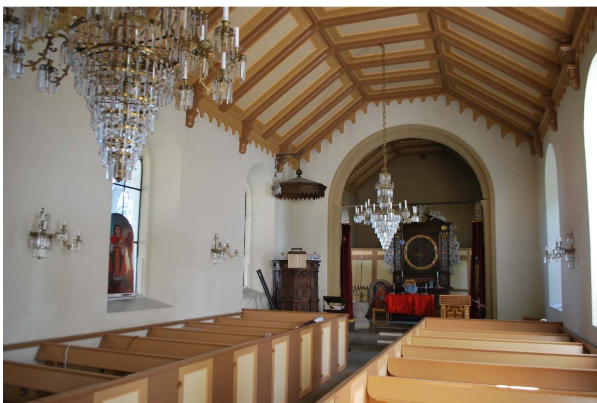
Långhuset mot koret i öster.

Den mycket smala sakristian är inrymd bakom altaruppsatsen. Väggar och tak är lika som koret medan golvet är belagt med linoleum.