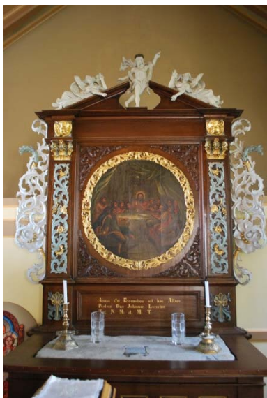
Altaruppsatsen och altarskivan.

Snidade beslagsvingar med blom och bladmönster omger uppsatsen på sidorna. Den runda målningen i dova färger med motiv av nattvardens instiftande omges av en snidad förgylld bladverksram. Överstycket är en bruten trekantsgavel med figurer av änglar och Kristus av trä eller gips.