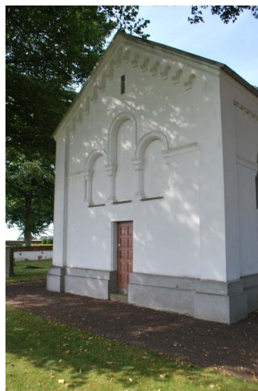
Koret mot öster.

Kyrkans äldre murar var byggda av gråsten, medan kyrkans delar från 1886 är i tegel enligt underhållsplanen. Utsmyckningar och detaljer, till exempel kolonner är utförda i prefabricerad betong. Fasaden är slätputsad. Sockeln är slätputsad och gråmålad. Fasadens hörn markeras av lisener och mellan långhus och kor av pilastrar. Fönsteromfattningarna är gjutna kvartskolonner. Mellan fönstren finns en gördelgesims. Längs takfoten under takgesimsen löper en rundbågsfris runt hela