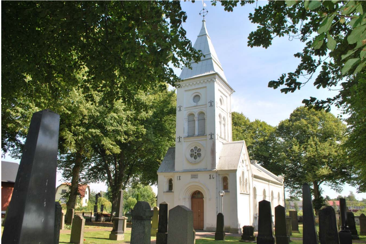
Fasad mot sydväst.