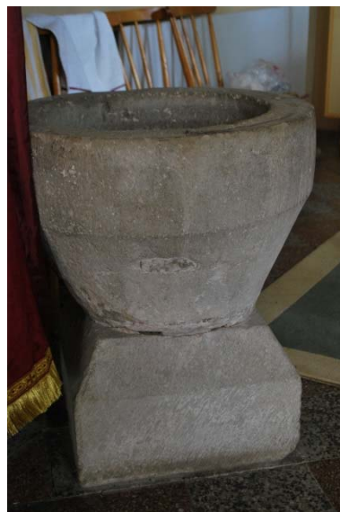
Dopfunten av sandsten.

Dopfunten av sandsten är troligen tillverkad omkring 1200-talet. Den cylindriska cuppan avsmalnar mot foten som är fyrkantig och avfasad mot cuppan. Dopfunten är odekorerad. Fram till 1924 var dopfunten rödmålad.