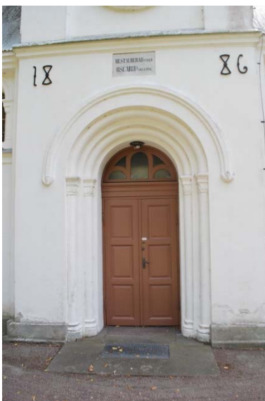
Huvudentré mot väster.