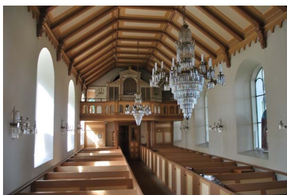
Långhuset mot orgelläktaren i väster.