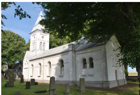
Fasad mot sydöst.

Kyrkan består av ett långhus med ett tresidigt något lägre och smalare kor i öster samt ett torn i väster. Gjutjärnsfönstren sitter i rundbågiga öppningar. Fasaden artikuleras av lisener, gesimser, friser och kvartskolonner. Taket är belagt med korrugerad plåt. Fasaden är vitputsad och symmetriskt lika mot söder och norr.