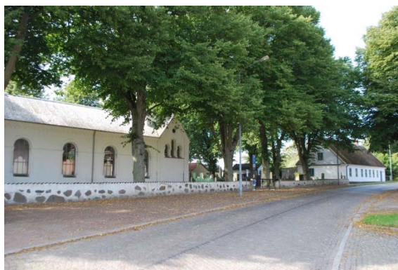
Fasad mot norr. Fd skolan och församlingshemmet.