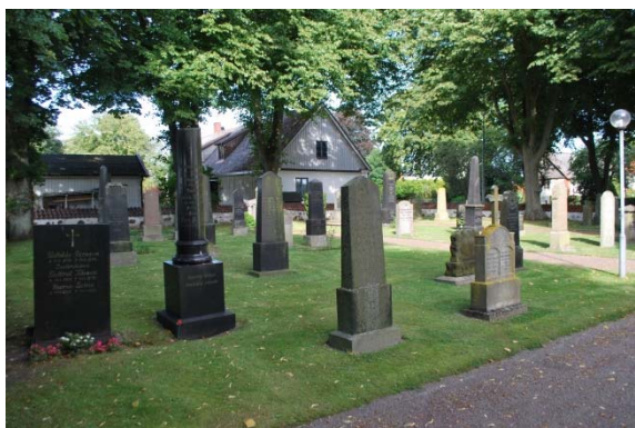
Gamla kyrkogården mot väster.

På den utvidgade delen från 1935 är stenarna låga och horisontella. De singeltäckta gravplatserna omgärdas av låga buxbomshäckar och stenarna står mot rygghäckar av avenbok. Gångarna är grusade. Stora delar av den utvidgade delen är ännu outnyttjad.