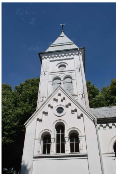
Tornet mot söder.