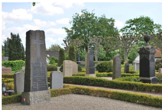
Kyrkogården söder om kyrkan.