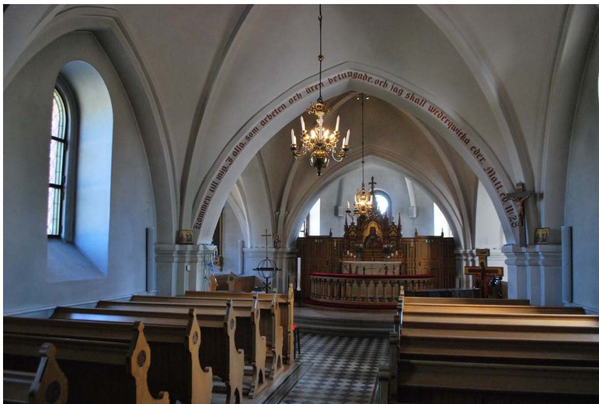
Långhuset mot koret i öster.

Orgelfasaden med målade pipor utgör läktarbarriärens mitt, vid sidorna finns en tät barriär i gotisk stil från 2013. Läktaren vilar på runda pelare av ek. Läktarens undersida är klädd med ekpanel.