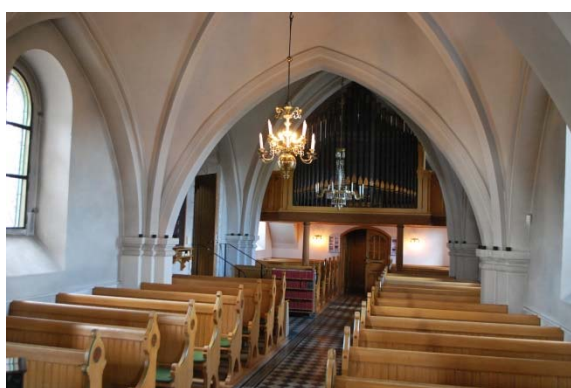
Långhuset mot orgelläktaren i väster.