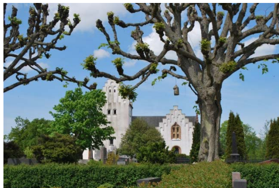
Fasad mot söder.