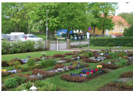
Ny del av kyrkogården.

Huvudgrinden i väster är av gjutjärn mellan fyrkantiga murade stolpar med toppigt krön. Grindar finns även mot norr och öster. Den östra grinden som nu leder ner till en trädgård kan tyckas märklig men förut ledde den till en stig som gick till en nu utplånad offerkälla. En trädkrans av lönn, italiensk al och naverlind planterades nyligen efter murens reovering. Utökade delar av kyrkogården i söder omges dels av smidesstaket på en låg mur och dels av nätstängsel. Innanför växer en spireahäck.