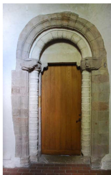
Sydportalen i nuvarande sakristia.