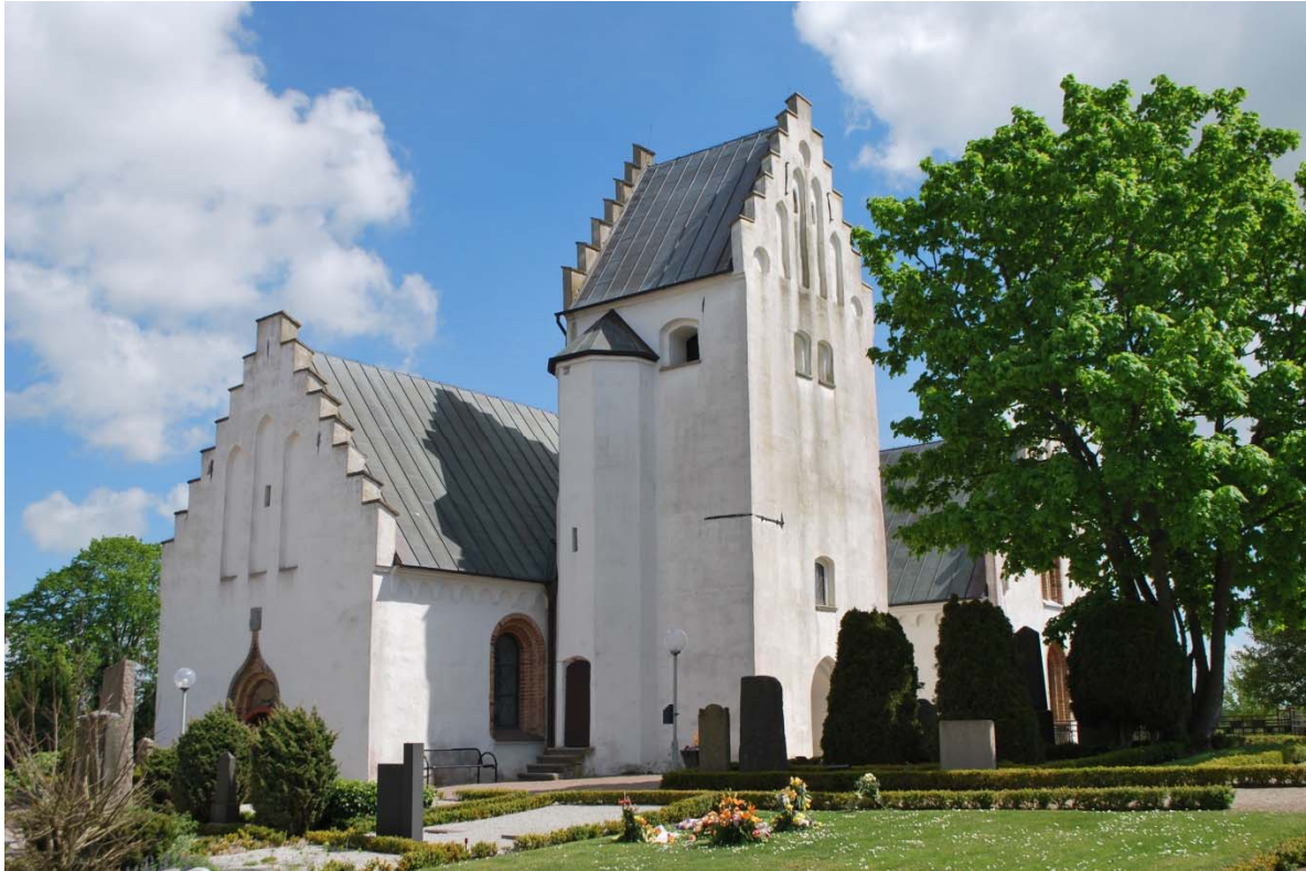
Fasad mot sydväst.