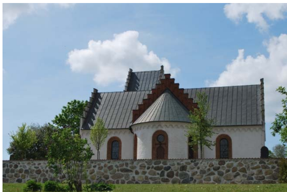
Fasad mot öster.

förstärkta med utvändiga horisontella järnband. Fönsterbänkarna är av räfflat gjutjärn. Korsarmarnas övre fönsteromfattningar avslutas likt huvudingången i en gotisk spets.