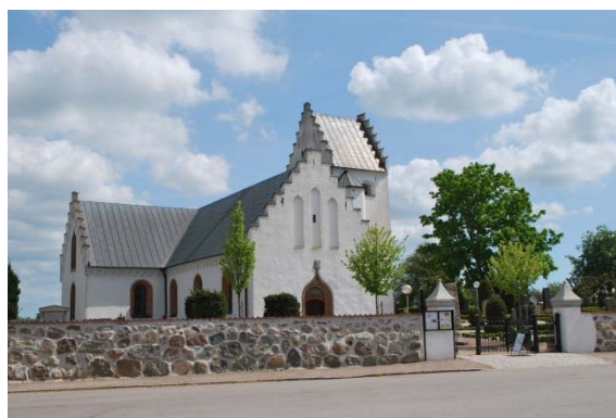
Fasad mot nordväst.