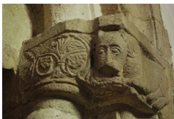
Detalj på sydportalen i nuvarande sakristia.

I det låga, lilla vindfånget i väster under orgelläktaren finns dörr till läktaren, till teknikutrymme och en dubbeldörr in till kyrkorummet.