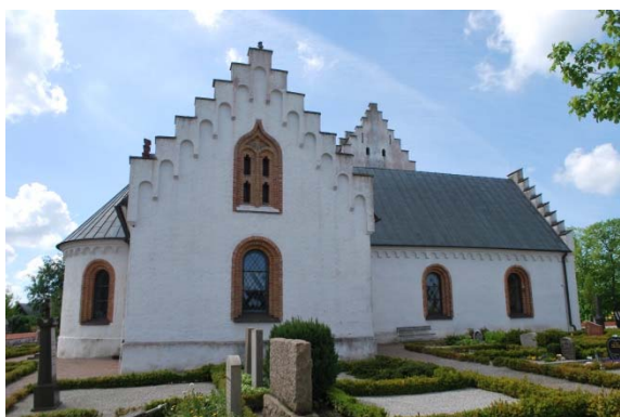
Fasad mot norr.