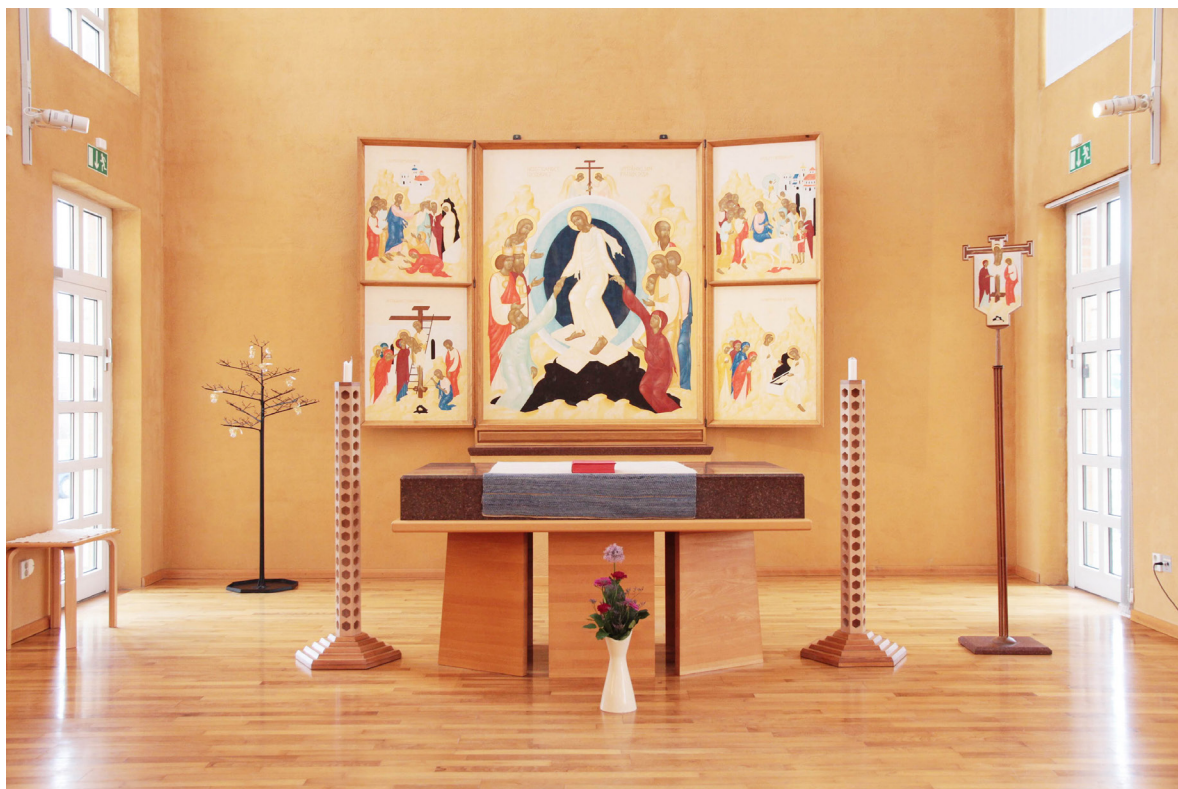
Koret med ljusbärare, altare och altaruppsats.

Vävnaden i foajén tillverkades av textilkonstnären Gerda Wissler. Vävnaden är upphängd i ett fyrdelat kors och placerad i mitten av kyrktorget. Inspiration hämtades från omgivningarna kring Östra Torn. Vävnaden är tillverkad i linvarp med inslag av handspunnen ull.