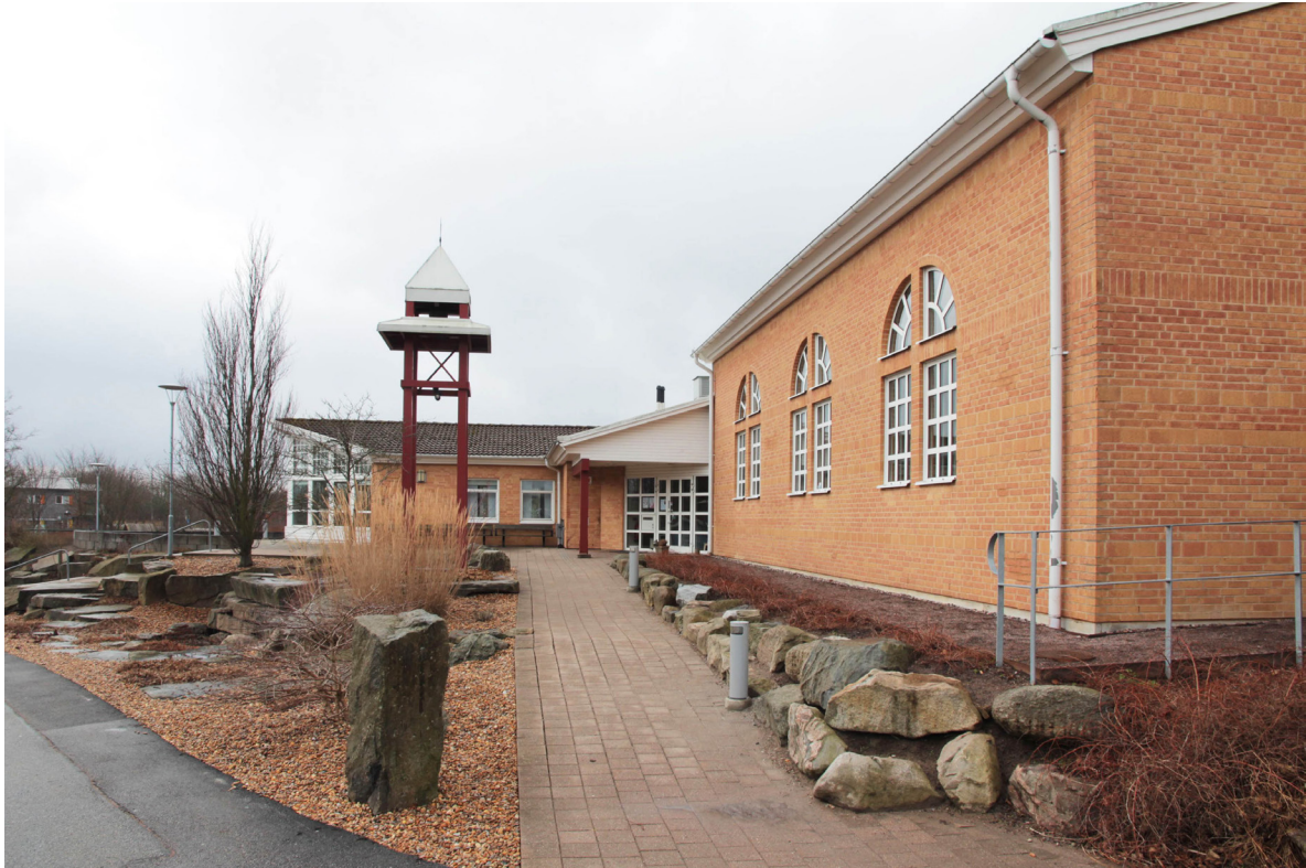
Kyrkans huvudingång återfinns på den södra sidan och delas med förskolan.

Den 22 november 1992 invigdes den färdiga kyrkan av biskop K. G. Hammar. 1993 öppnade den Montessorinspirerade förskolan med plats för 15 barn.