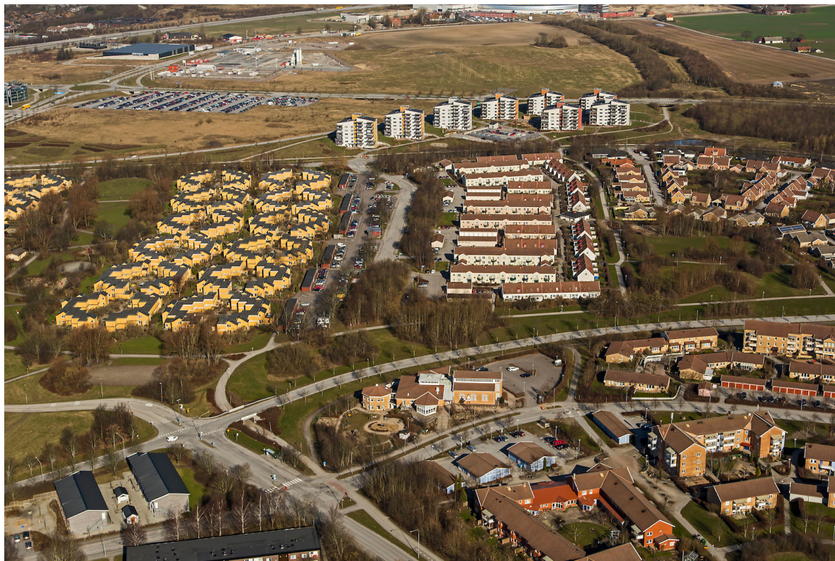
Flygbild över Östra Torn tagen från söder, 2014. Maria Magdalena kyrka syns något nedanför bildens mitt.

Östra Torn var ursprungligen en liten by som förr enbart hette Torn. Namnet hör sannolikt samman med häradsnamnet Torna. I äldre tider låg här en kult- och en tingsplats. Första gången byn nämns är omkring 1120 då det berättas att kung Sven Estridsen (1047–74) skänkt mark ”In villa Thorni” åt biskopskyrkan. Det ägandeförhållandet kom att i hög grad påverka bebyggelseutvecklingen i området då gårdarna och marken arrenderades ut istället för att säljas till enskilda ägare. Troligen låg byn under biskopsstolen under större delen av medeltiden, men drogs in till kronan efter refor-