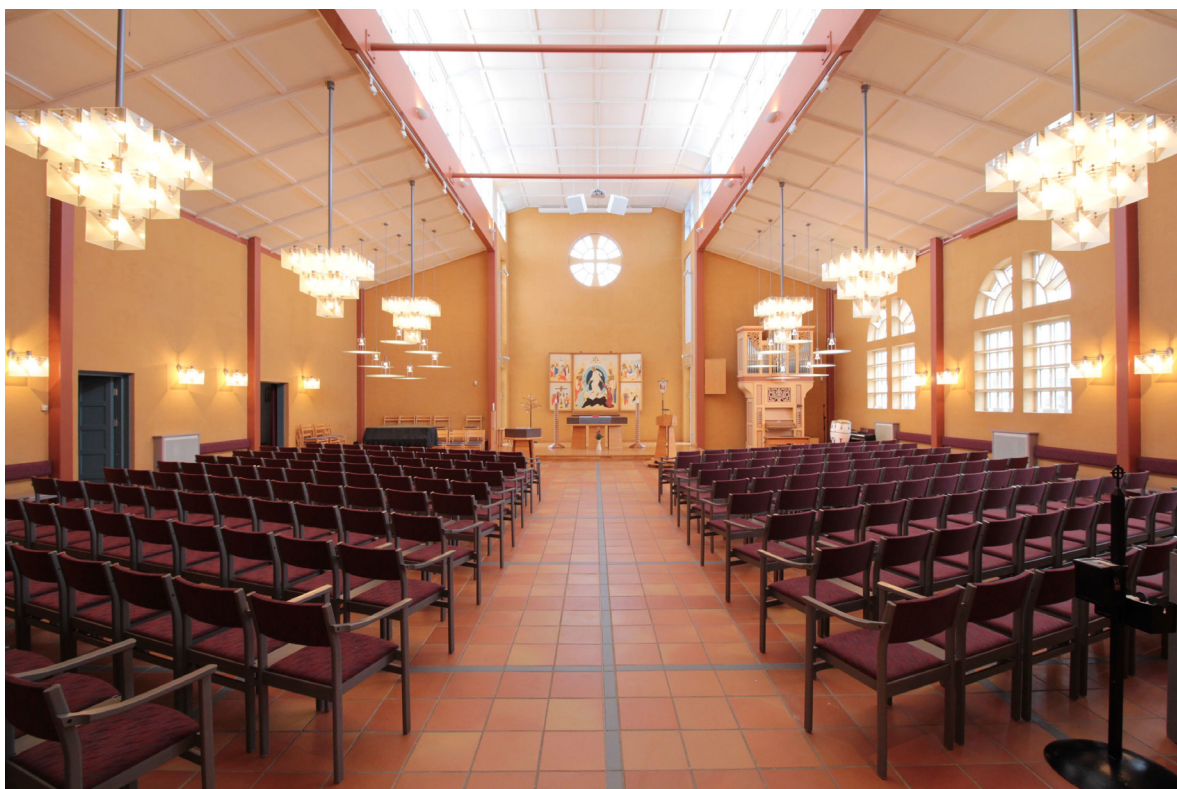
Kyrkorummet sett mot koret i öster.

leder ner till källarvåningen. Tre pardörrar med överljusfönster kan öppnas in mot kyrksalen. Vid behov av fler sittplatser i kyrkorummet öppnas dörrarna och stolar placeras även i kyrktorget.