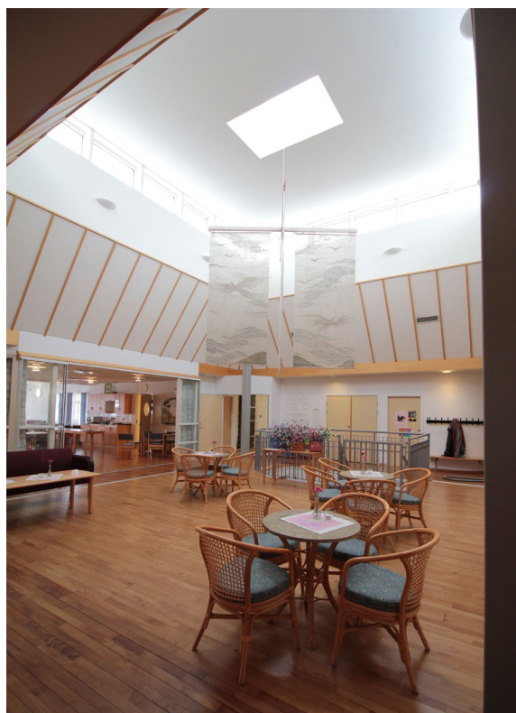
Kyrktorget som förbinder kyrkrummet med kaféet och förskolan.

Kyrkorummet saknar fasta bänkar och har istället stolar placerade i vinkel in mot mitten. Stolarna är placerade så att ett stort och fritt utrymme skapas längst fram i koret. Ytterväggarnas murar åt norr, öster och söder bär en tunn slätputs