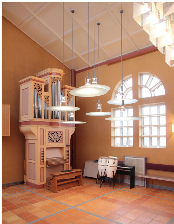
Utrymmet vid orgeln lysas upp av sju plafondlampor.

Dopfunten hör till kyrkorummets ursprungliga inventarier. Cuppan är oktagonaltill formen och är tillverkad av skivor i röd granit. Upptill bildar cuppan en bordsyta med en rund nedsänkning i mitten i vilken ett dopfat av klarglas finns placerat. Hålligheten