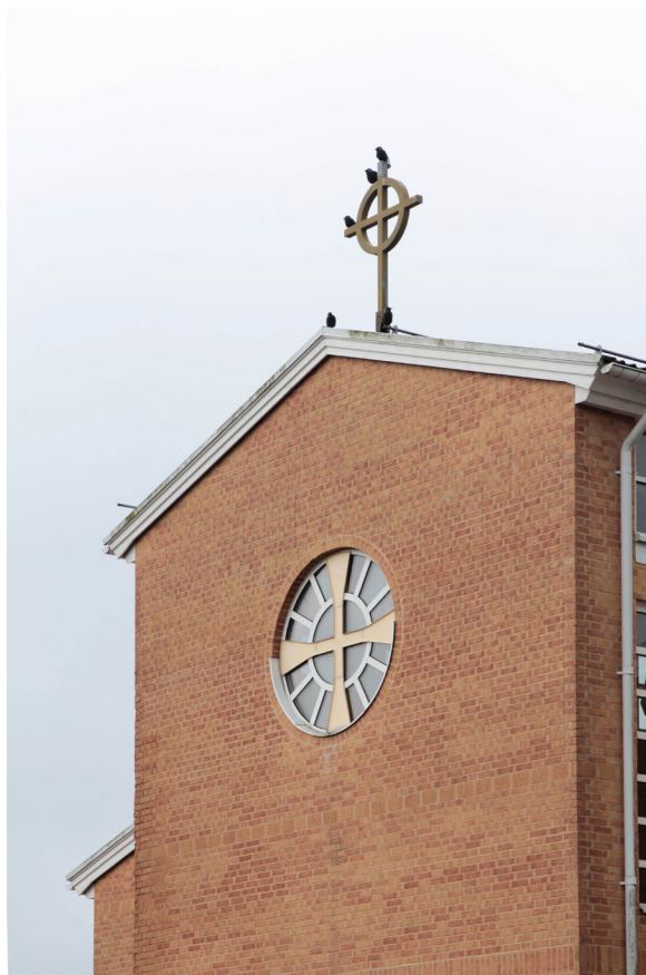
Den östra korväggen pryds upptill av ett ringkors.

Oktagonen länkas till kyrkoanläggningen genom en smalare, glasad byggnadsvolym i två våningar. I mitten av byggnadskomplexet finns en kvadratisk byggnadsvolym med tälttak och ett centralt överljusparti med fönsterband, i vilken kyrktorget är beläget. Åt söder skjuter kafébyggnaden ut, som avslutas med ett spetsigt fönsterparti. Huvudingången är placerad mellan kafébyggnaden och kyrkan. Framför entrén finns ett anlagt landskap av större stenblock och gul sjösten, ett trappparti samt en längre stensatt ramp längs kyrkans södra fasad. I landskapet står klockstapeln som skänktes av boende på äldreboendet Thulehem i Lund. Den rödslammade konstruktionen täcks av ett vitt tälttak av plåt som kröns av Lunds enda kyrktupp.