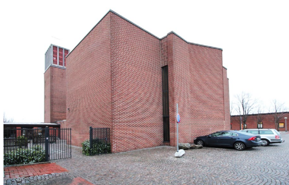
Kyrkans sedd från öster.