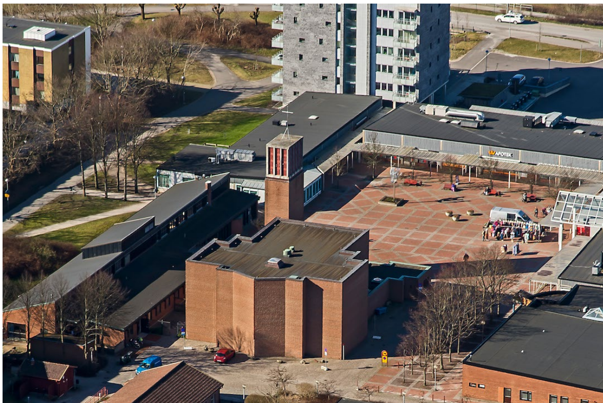
Flygbild tagen 2014 över Fäladstorget, sett från öster.

Sankt Hans kyrka planerades och byggdes som en del av centrumanläggningen för stadsdelen Norra Fäladen som byggdes upp under senare delen av 1960-talet och första