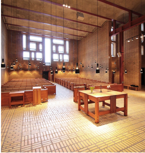
Kyrkorummet sett från öster.

opputsade och bärs upp av stora rödmålade stålpelare, vilka är synliga i kyrksalens främre del. I mitten av bremervalvet ovanför altaret finns ett takfönster. Två glasförsedda slitsar mellan korväggen och långhusets östvägg förser koret med dagsljus.