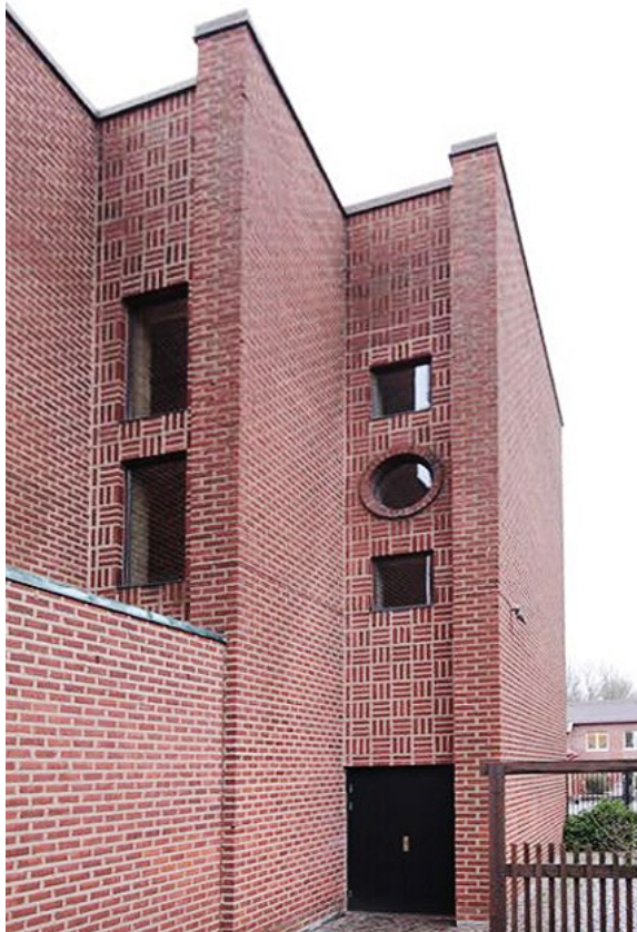
De fönsterförsedda partierna i korsarmarnas östväggar är murade i ett kvadratisk mönster.