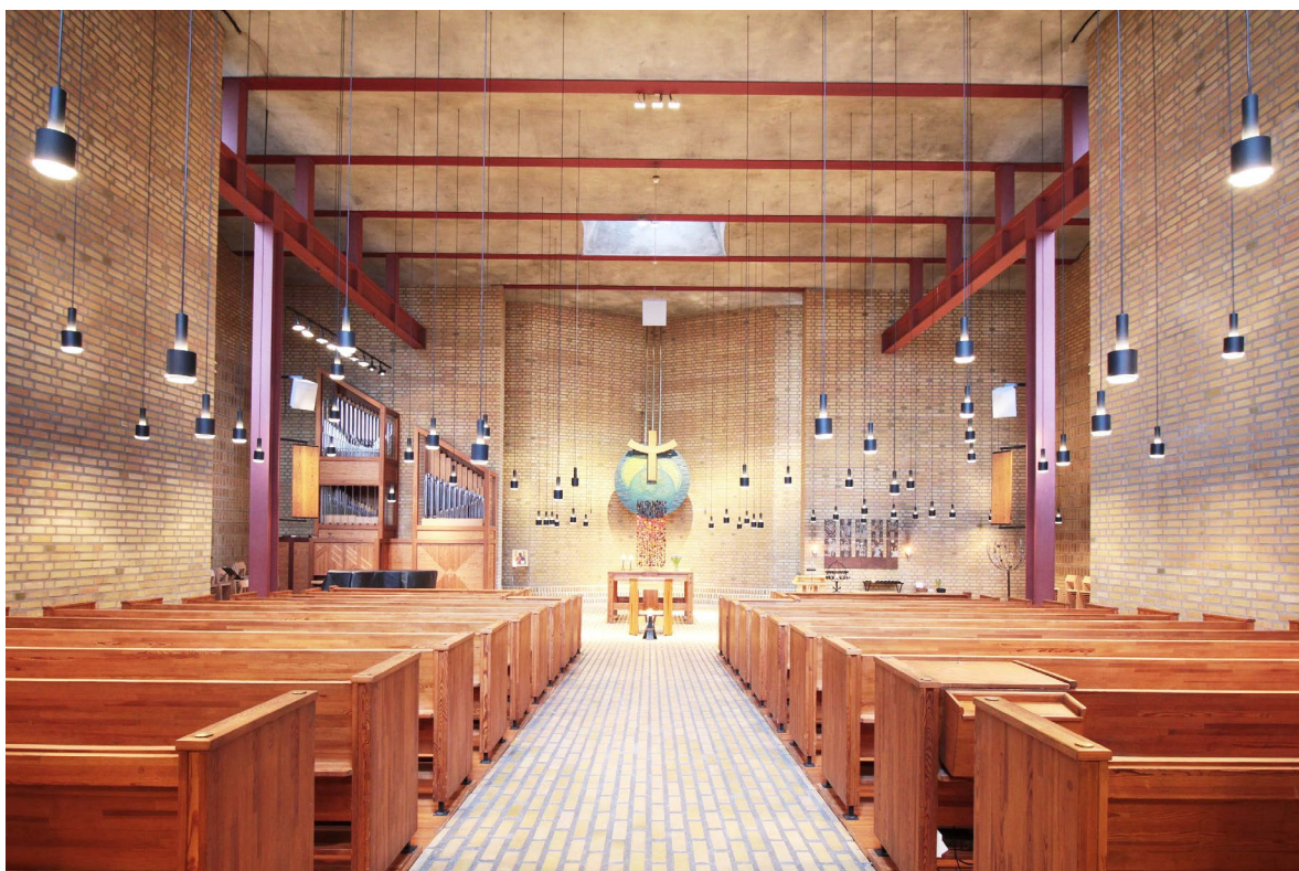
Kyrkorummet sett åt öster. Mittgången har en lätt lutning ner mot altaret.

Från vapenhuskorridoren finns även ingången till kyrksalen i öster samt till doprum, sakristia, toaletter, förråd och kapprum och pentry. Samtliga innerdörrar är av rödbetsat limträ. Golvet är belagt med rött tegel i löpförband. Detsamma gäller samtliga väggar utom den östra som är murad i munkförband. Väggarna har påtagligt breda fogar om cirka 3 centimeter, i likhet med exteriörens murar. Taket är av vitmålad betong med synliga spår från gjutformarna.