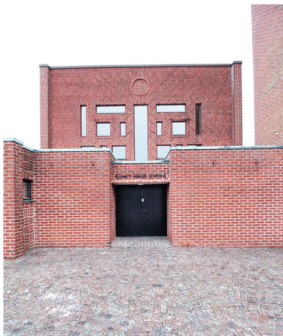
Ingången till kyrkan från Fäladstorget.

Sankt Hans blev 1992 en egen församling och ett församlingssigill ritades av Bengt Aronsson, medlem av kyrkorådet. Man påbörjade även en renovering av kyrkan, vilken emellertid avbröts. Först ett par år senare, 1994–95, genomfördes en mer genomgripande renovering samt en sammanbyggnad av kyrkan och kyrklängan under ledning av Blomqvist Arkitekter AB/Lundquist & Rendahl Arkitekter AB. En förbindelsegång uppfördes mellan församlingshemmet och vapenhusets södra vägg. Man tog även upp nya utrymningsvägar i korsarmarna och flera heltäckningsmattor i bland annat doprummet och barnrummet ersattes med linoleum. Vidare renoverades toaletter och pentry. Den tidigare skrudkammaren i sakristian byggdes om till nuvarande textilskåp. I kyrkorummet installerades ny belysning vid altaret, predikstolen och orgeln. I samband med renoveringen förverkligades även ett gammalt förslag från förre ärkebiskopen Olof Sundby genom att ett tornur placerades på tornets västra fasad. Uret tillverkades av Skånska klockgjuteriet i Hannas, Hammenhög.