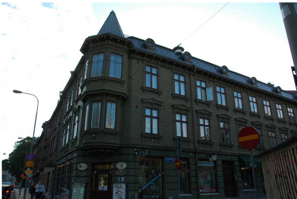
Byggnaden vid Södra Allégatan/Husargatan uppfördes 1888. Fasaden är rikt dekorerad och fönstren i burspråket är etsade. (Haga 29:1).

Länsstyrelsen remitterade förslag till skyddsbestämmelser till bostadsrättsföreningens styrelse den 15 mars 2017. Brf Ada tillstyrkte förslaget den 4 juli 2017.