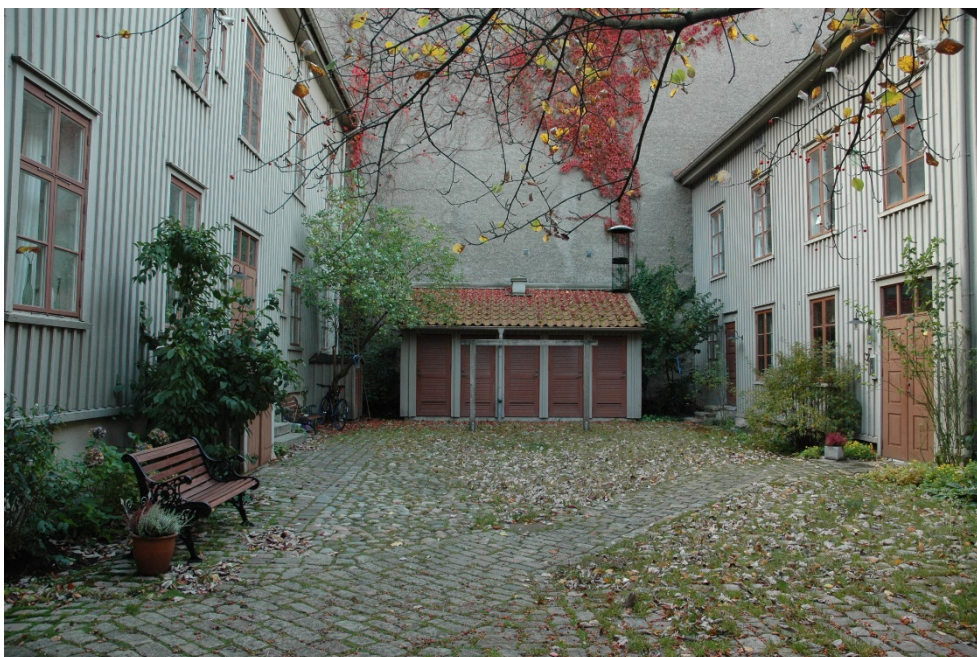
Gatuhus (till vänster) och byggnaden på gården (till höger) i kv Haga 29:9.

Byggnaderna i kv 29:5 uppfördes 1857-60. Bostadshuset i två våningar (byggt 1857) är ett exempel de äldre trähusen i Haga. På den tillhörande gården uppfördes ett parallellt placerat bostadshus år 1860. Byggnaderna har ett gemensamt formspråk och färgställning.