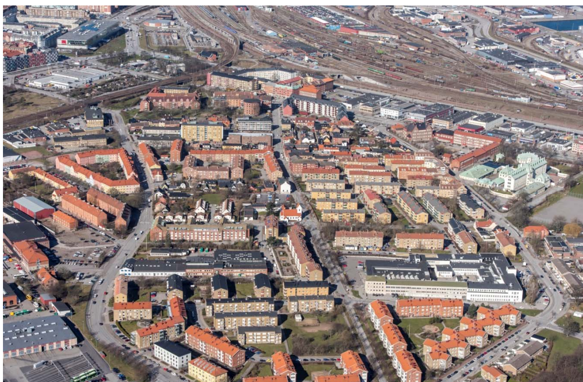
[1]: Kirseberg från öster

Kirsebergs kyrka ligger i delområdet Kirsebergsstaden i nordöstra delen av Malmö [1].