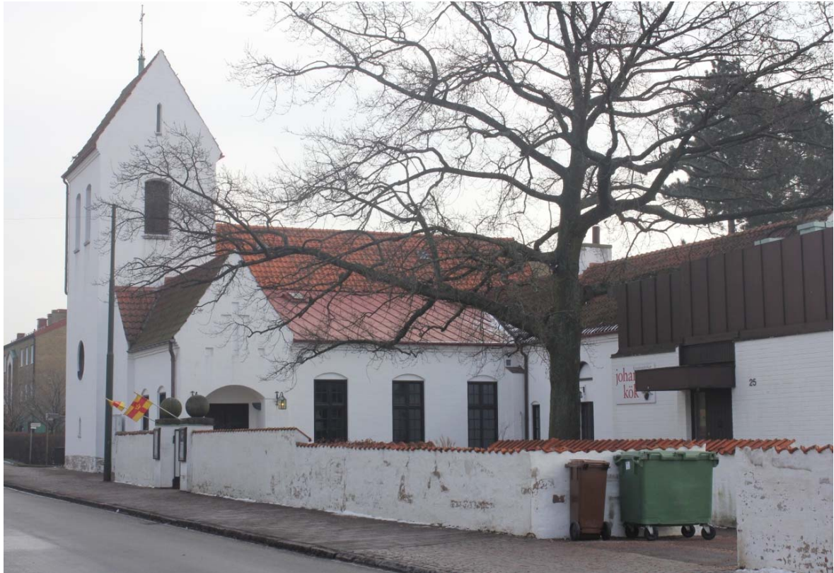
[2]: Kyrkan från nordväst, t.h. syns församlingshuset från 1973

Murarna genombryts av brunmålade fönster. Fönstren till kyrkorummet är från 1927, de till församlingssalen från 1995. De flesta är rektangulära med dubbla, kopplade och spröjsade bågar med öppningsbara lufter. Fönsterblecken är av målad plåt. De gamla fönstren har i hög grad kvar sina valsade glas med blyinfattade rutor i innerbågarna. Fönsteröppningarna är ömsom raktäckta, ibland med skrånade nischer, ömsom kölbågiga med putsade blinderingar ovan fönstren. I församlingsdelen finns mot norr tre rundbågiga nischer, där varsitt raktäckt fönster/ fönsterdörr och ett halvcirkulärt överljus skrivits in mellan blinderingarna. I tornets norra- och korets södra fasad finns varsitt rundfönster. I korets fönsteröppningar sitter glasmålningar bakom skyddsrunder av polykarbonat. Gluggfönstren i toalettutbyggnaden har glasen fogade till murverket.