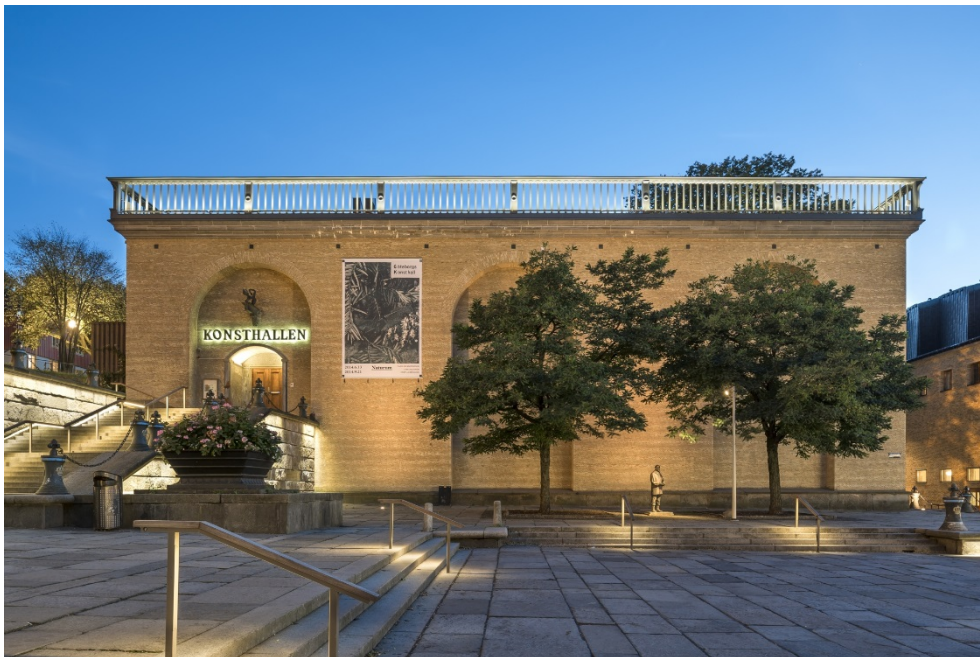
Konsthallen mot Götaplatsen.