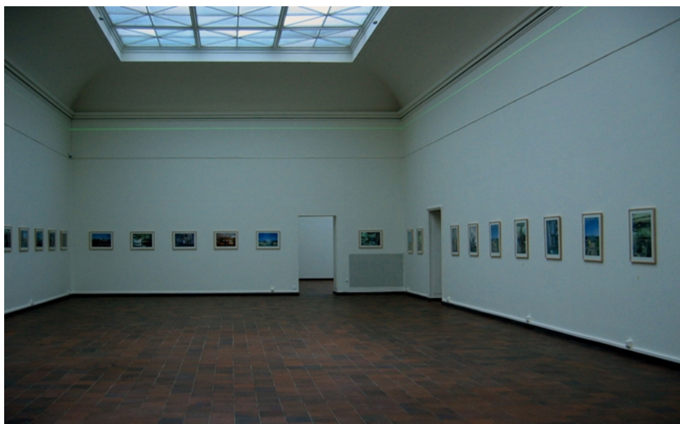
Lanternintak i utställningshallen.