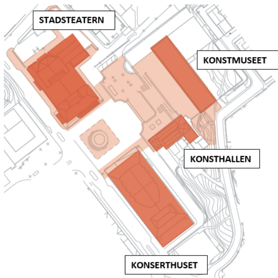
Karta över Götaplatsen.