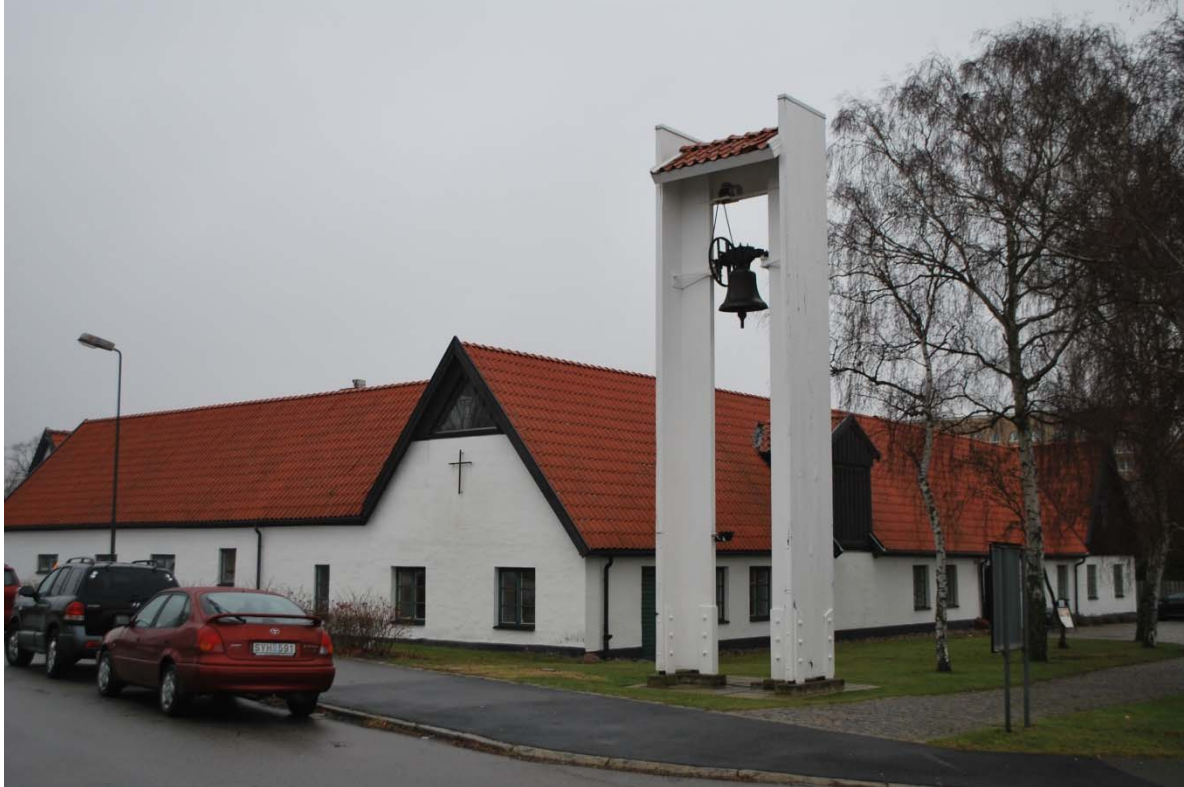
Fasad mot sydväst.