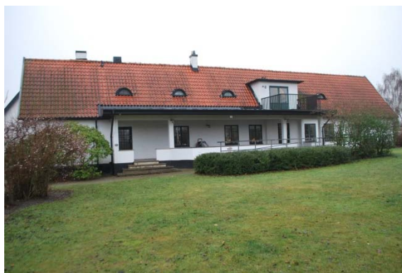
Fasad mot norr mot trädgården.