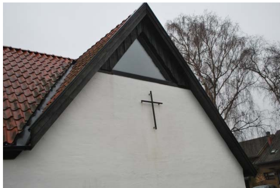
Kyrkans gavelspets mot väster.