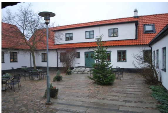
Innergården, fasad mot söder.

Innanför träporten finns ett glasat entréparti av svart aluminium mellan längornas putsade fasader, i taket sågad locklistpanel, på marken gatsten. Efter entrépartiet är det en stor rund ljuskupol i paneltaket som markerar att här är ingång till expedition till höger och entréhall till kyrkan till vänster genom glasade aluminiumpartier. Den öppna gården ligger rakt fram.