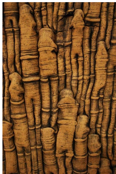
Detalj av altartavlan.

Klockan hänger i en fristående klockstapel utanför kyrkan. Klockan har inskriptioner och är gjuten 1969 av M&E Ohlssons klockgjuteri i Ystad. Klockan fanns vid den tidigare vandringskyrkan, klockstapeln byggdes 1985.