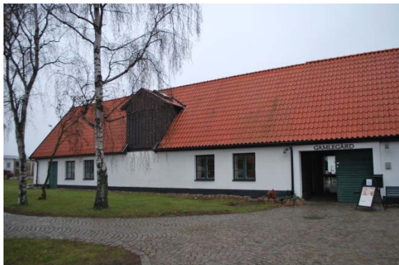
Entréfasad mot söder. Kyrkolängan.