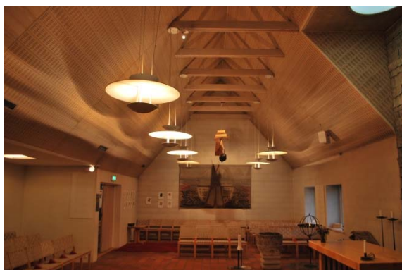
Kyrkorummet mot öster.

Expeditionen har golv med oglaserade tegelplattor i entré och delvis i expeditionen. Innerdörrarna i församlingslokalerna är blandade äldre spegeldörrar, vita släta och vitlaserade fanerade dörrar.