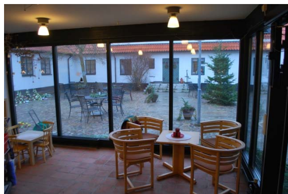
Entrérummet med utsikt mot innergården.