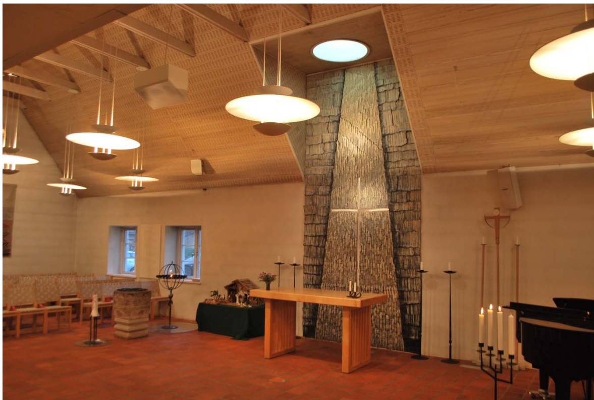
Kyrkorummet mot altaret.

Kyrkorummet har en långsmal planform med en utbyggnad på ena långsidan mitt emot altaret. Det är hög takhöjd med öppet upp i nock och med synligt hanband. Flera nedpendlade lampor, Fata Morgana , av Hans-Agne Jakobsson hänger i taket. Brandpanelen på innertaket är klätt med vitlaserad furufaner, delvis med slitsar för akustiken. I utbyggnaden är taket lågt, platt och klätt med akustikplattor med infälld belysning. Över orgeln hänger genomskinliga skivor för akustiken. Golvet, i en nivå, är belagt med kvadratiska handslagna röda tegelplattor från Danmark. Väggarna är putsade och vitmålade. Golvet möter väggarna utan sockellister. Rummet har inga radiatorer utan värms med varmluft från galler i golvet längs väggarna. Altaret är placerat mitt på ena långsidan och stolarna grupperade på övriga tre sidor. På ena kortsidan står orgeln. Stolarna för kören framför orgeln står på senare ditsatta gradänger av trä.