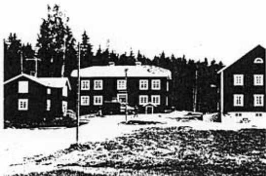
Rehnstedts 1985

Den gamla mangårdsbyggnaden på Rehnstedts är av särskilt stort kulturhistoriskt värde eftersom den på ett utmärkt sätt representerar det tidiga 1800-talets byggnadstradition i Bollnäs. De flesta stora mangårdsbyggnader i socknen från denna tid har haft ett liknande utseende, men Rehnstedts intar en särställning bland dessa genom sitt närmast orörda skick.