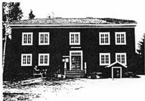
Gamla mangårdsbyggnaden på Rehnstedts 1985

Gården Rehnstedts i Bollnäs tillkom under senare delen av 1700-talet genom avstyckning från den större gården Renshammar. Avstyckningen var en av flera som skedde i samband med ett ägarbyte på Renshammar år 1771. Vilket år den skede är inte känt, däremot att fastigheten existerade 1782.