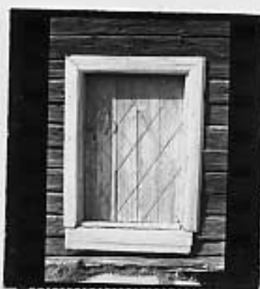
Bostadsfastighet Torp III DÖRR Sommarstuga Industrianläggning Serviceanläggning Samlingslokal Övr.: .....

FR Faluröd, röd slamfärg (specialförkortn.). Övriga färger anges med en kombination av två förkortningar, en för färgtypen och en för kulören. Byggnaden har avses detta efter sned-