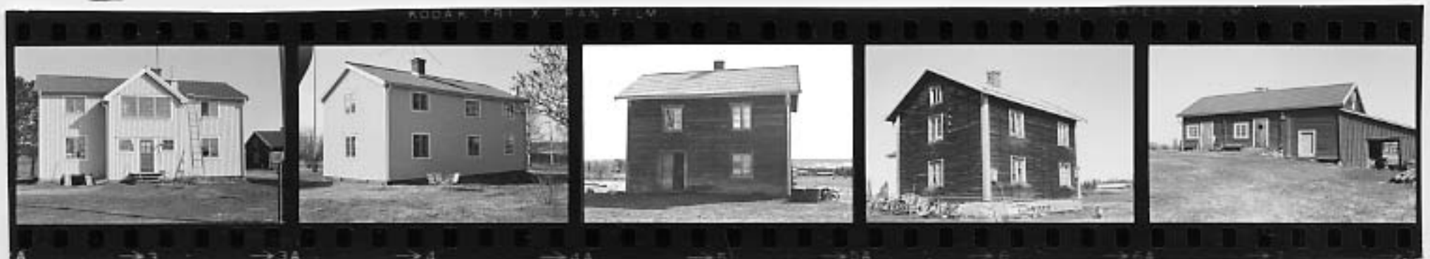
I I II II III