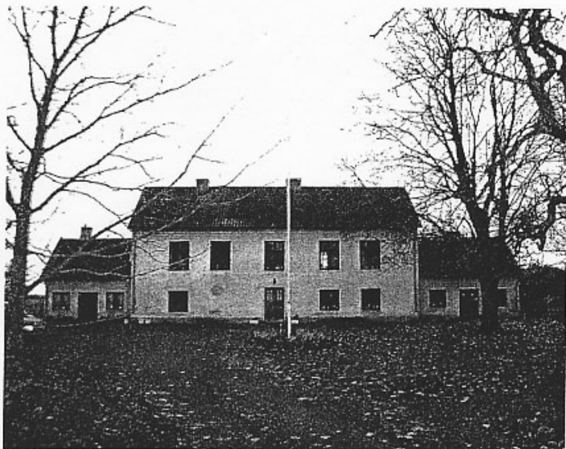
Manbyggnaden med flyglar.

Länsstyrelsen har i samråd med ägarna tagit initiativ till byggnadsminnesförklaring (BM) av fastigheten Duss 1:3 i Bro socken, Gotland.