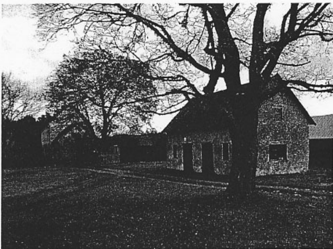
Smedjan/snickarboden före utvändigt restaurering 2005. Manbyggnaden i bakgrunden.

Restaureringsinsatser har utförts för att säkra ett skadat murparti i övervåningen samt övervåningens fönster på östra fasaden. Nu är takomläggning med lagning av takstolar etc aktuella. Arbetena utförs med hjälp av kulturstöd. Framtida åtgärder bör även vidtas bland annat för att trygga smedjan/snickarbodens goda fortbestånd.