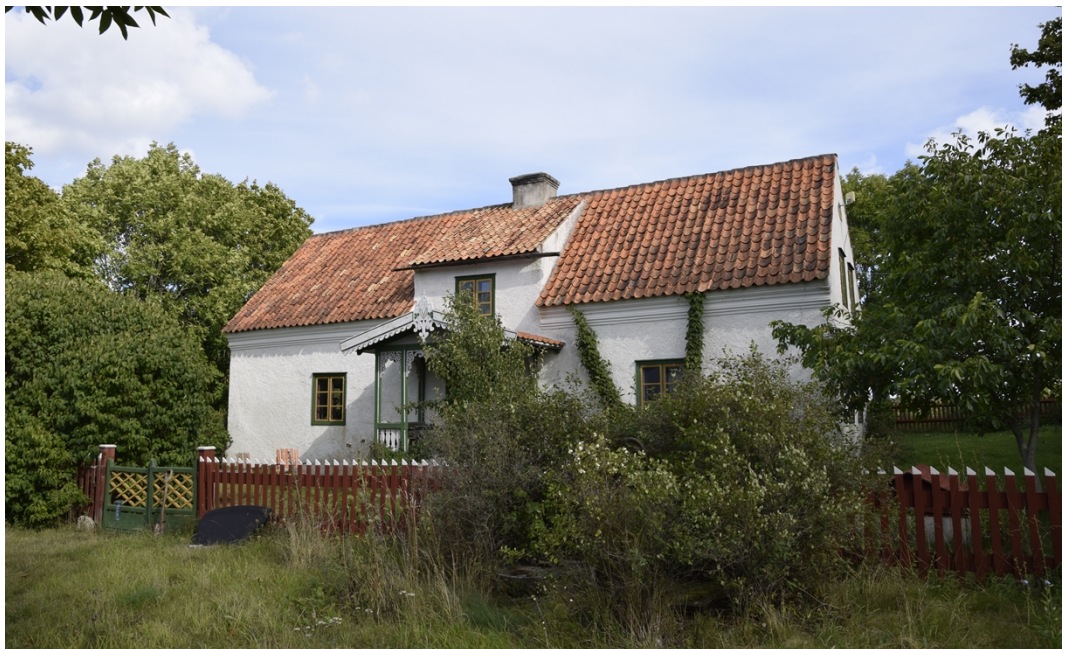
Hall Gannarve 2:3, norra manbyggnaden i augusti 2017.