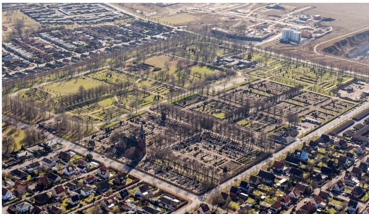
Från nordväst.

Limhamns kyrka ligger i sydvästra delen av Malmö mellan Hyllie by och gamla Limhamn.