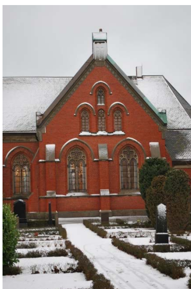
Korsarmens fasad mot söder.