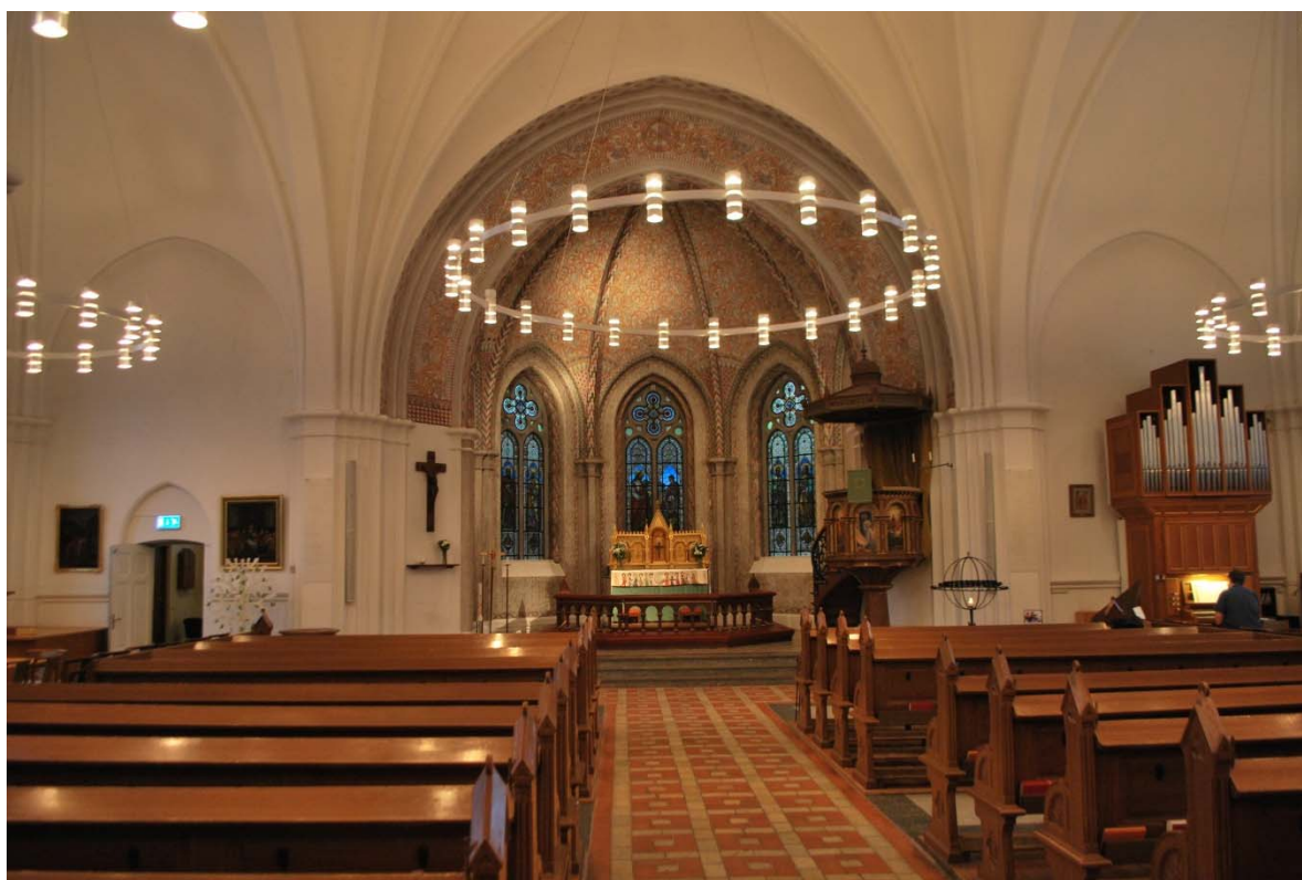
Långhuset mot koret i öster.

Från vapenhuset nås ett litet vindfång med dörrar till förråd och wc som byggdes 2009 under orgelläktaren. Dörrarna är kopierade lika de ursprungliga fyllningsdörrarna i kyrkan.