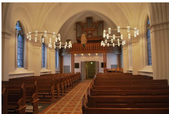
Långhuset mot orgelläktaren i väster.

Väntrummet, som nås från norra korsarmen, inreddes 1963 och har kalkstensgolv, vävade målade väggar och träribbor i taket.