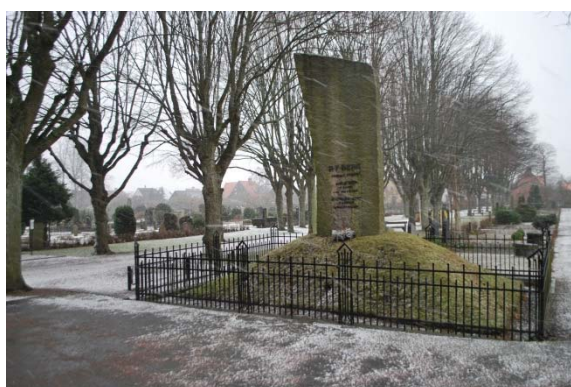
RF Bergs gravsten intill kyrkans västingång.

Strax utanför kyrkans huvudingång är ”Limhamnskungen” ingenjör RF Berg begravd. Han hade stor betydelse för Limhamns utveckling i slutet av 1800-talet. Den mycket imposanta stenen står på en gräskulle och är omgiven av smidesstaket.