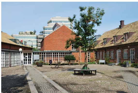
Entrégården från söder.

Sadeltaket är belagt med enkupiga gula tegelpannor. Takpannorna ligger ut i fasadliv utan takutsprång och plåtar. Takavvattningen är delvis av koppar, delvis brun plåt. Under hängrännan sitter plåt, tillkommen vid senaste renoveringen.