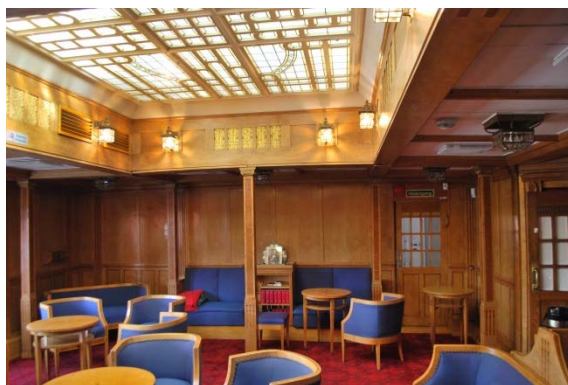
Kungsalongen från färjan "Konung Gustav V".

Västra längan innehåller två stora och en mindre samlingsal på bottenvåningen. På andra våningen är kontorsrum och "Kungsalongen".