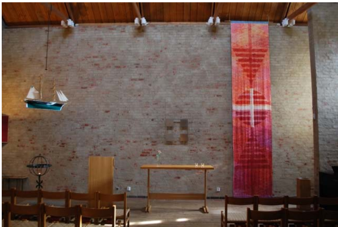
Kapellet mot altaret.

av dubbla sågade brädor möter snedsträvorna och de lodräta brädorna i en dekorativ knutpunkt. Sammanfogningen är gjord med bultförband och järnbricka. Underpanelen i taket är av sågad stående granpanel.