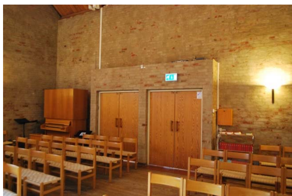
Kapellet mot entrén.