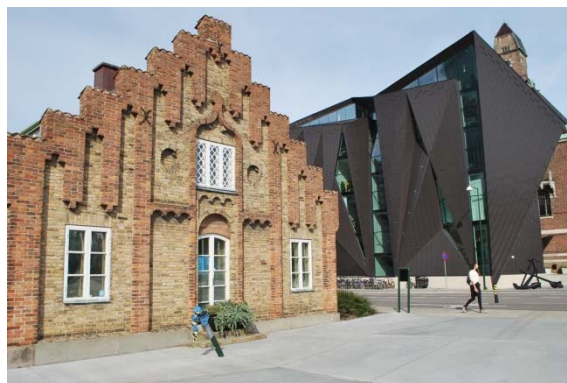
Bruniusgavel och World Maritime center.