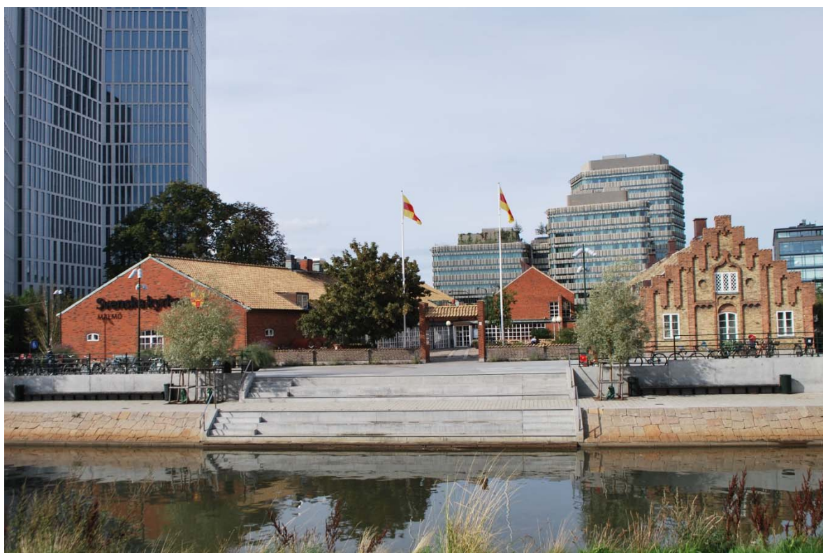
Fasad mot söder.