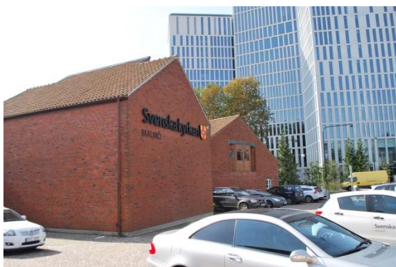
Fasad mot nordöst.