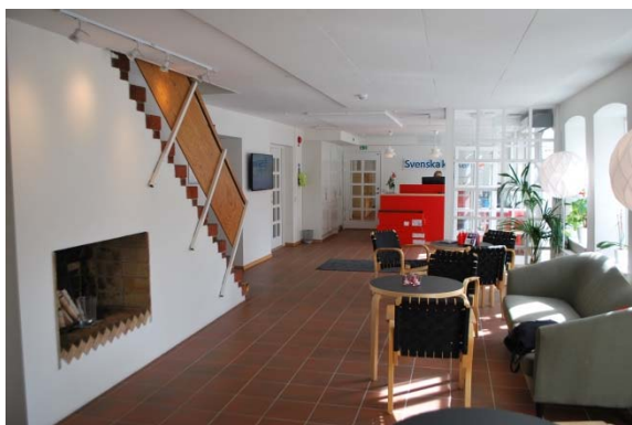
Receptionen i östra längan.

Östra längan har en stor entréhall med öppen spis, sittgrupp och receptionsdisk. Golvet är av röd klinker, väggarna är vitmålade med en eksockel. Ett vitmålat spröjsat glasat vindfång leder in i entrén. En murad tegeltrappa leder till ovanvåningen från entréhallen. Längan innehåller samlingsrum och kontorsrum. Ett litet mötesrum på bottenvåningen är "Kajutan" som har inredning från skepparhytten på fartyget "Drottning Viktoria". Väggarna är klädda med brun panel. På ovanvåningen har några rum öppet upp i nock med synliga takbalkar och ekgolv. Kontorsrummen har till korridoren glasväggar med spröjsade vita träpartier.