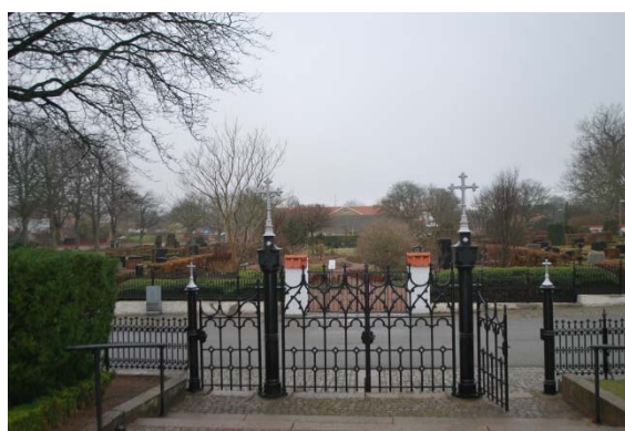
Gjutjärnsgrind i väster.