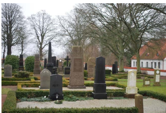
Gamla kyrkogården med prästgården till höger.

med tegelpannor. Mot väster avgränsar ett dekorativt gjutjärnsstaket med en hög gjutjärnsgrind. I sydvästra hörnet saknas mur och istället finns en bokhäck och nätstängsel. Grindar finns i alla väderstreck, i öster en tredelad hög trägrind. En utglesad trädkrans omger i söder. Kyrkan omges av grus. En gång från koret till trägrinden i öster är kantad av låga, hårt hamlade träd som närmast är som skulpturer. Gravarna är mestadels omgivna av buxbom och belagda med singel, en del står i gräs. Ovanligt många äldre höga gravstenar står kvar på sina platser. I nordöstra hörnet är samlat äldre gravstenar längs muren. Flera gravstenar är äldre än den nuvarande kyrkan. Den vanligaste titeln är lantbrukare. Få kvinnor har titlar men här finns stenar till två systrar med titeln pigor som dog unga 1867. Stenarna har reliefer av bladrankor. Två andra kvinnliga titlar är väverska och direktör.