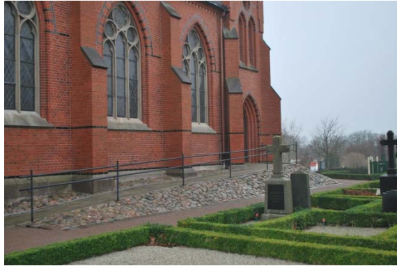
Fasad mot norr.

Kyrkans fönster sitter i spetsbågiga nischer med omfattning av profiltegel. Fönstrens masverk är av betongelement. Sidoskeppen har vardera fem stora trekopplade masverksfönster. Varje fönster består av tre höga smala fönster och därovan ett sexpassfönster och två mindre trepassfönster. Solbänkarna är klädda med kalksten. Glaset är blyspröjsat i rombiskt mönster med katedralglas med färgat glas i ytterkanterna. De blyinfattade fönstren är inmurade i smygen och förstärkta med horisontella järn. I tornets västvägg sitter ett stort rosettfönster med färgat glas. Tornet har dubbla ljudöppningar med masverk i betong i alla väderstreck. Öppningarna har brädluckor.