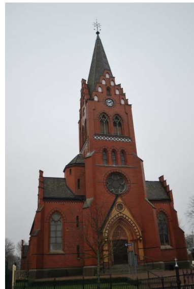
Fasad mot väster.