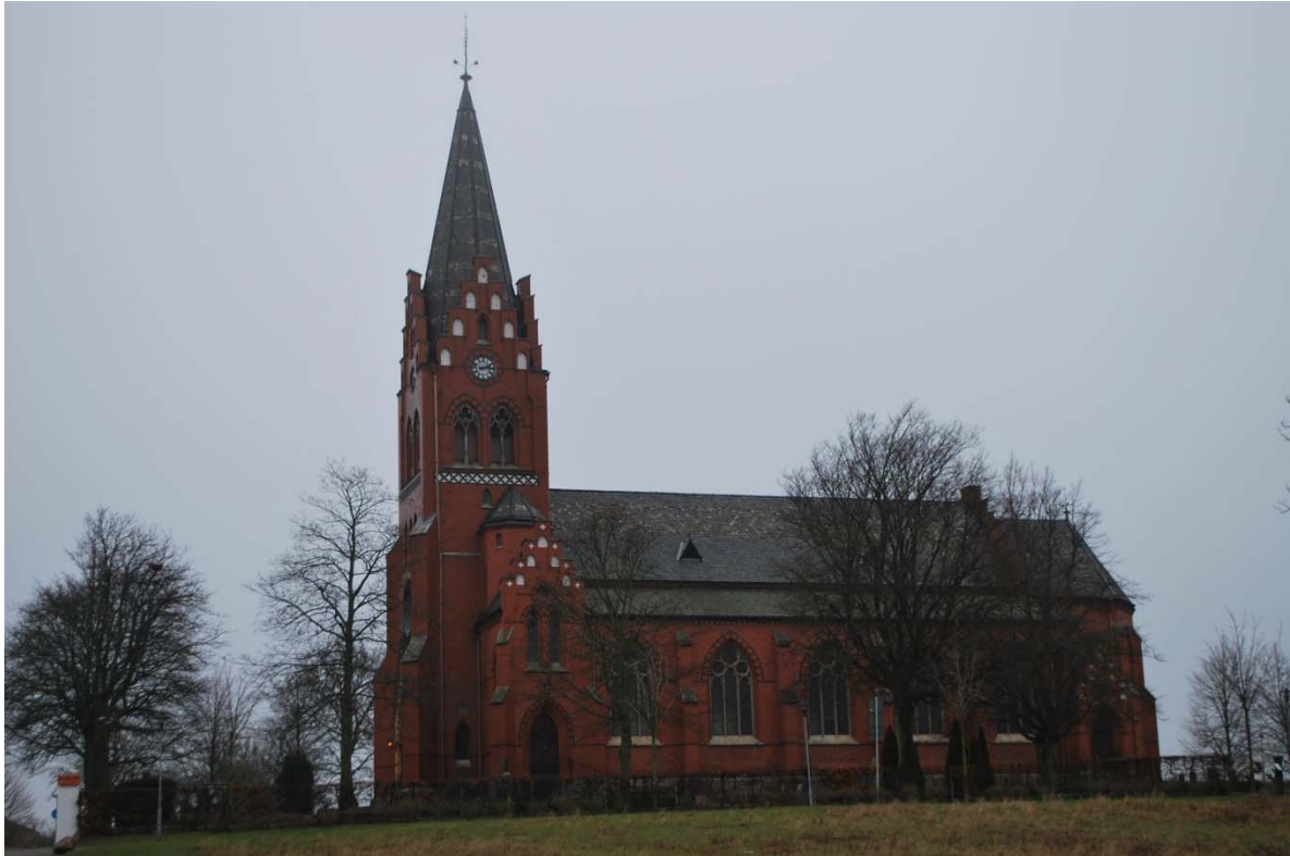
Fasad mot söder.