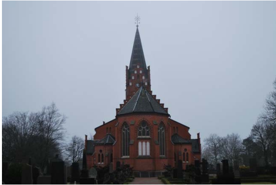
Fasad mot öster.

inslag av horisontella smala band med ett skift brunglaserat tegel. Fönster och andra öppningar markeras av en båge i brunglaserat tegel. Kyrkans sockel är av granit med snedfasad avslutning. Fasaden indelas vertikalt med strävpelare som är avtäckta med kalksten. Tornet avslutas under spiran med trappstegsgavlar i alla vädersträck. Trappstegsgavlar har även alla kyrkans sidoingångar.