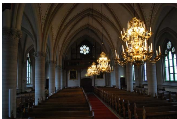
Långhuset mot orgelläktaren.