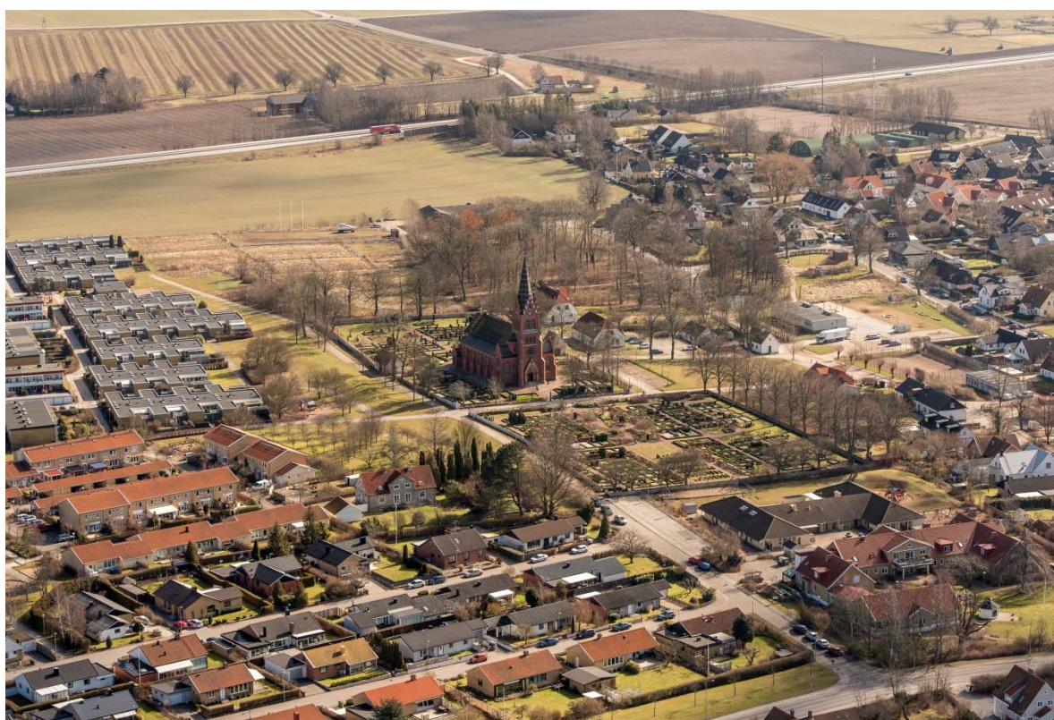
Flygbild från sydväst.

Tygelsjö ligger på slätten söder om Malmö.