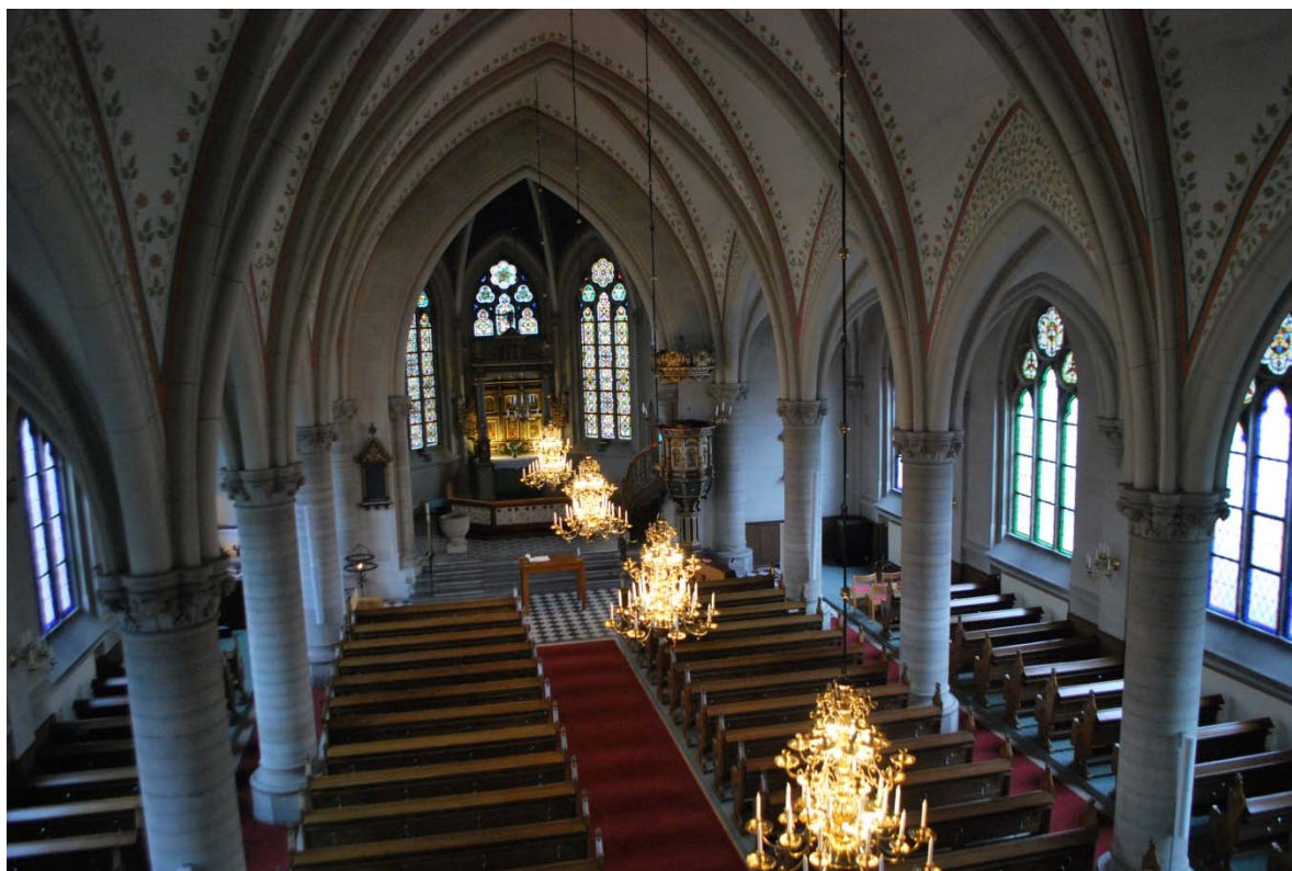
Från orgelläktaren mot koret.

knoppkapitäl. Ribborna är målade i sandstensfärg med målad indelning likt väggarna. Kapporna i mittskeppet är vitmålade och dekorerade med blad- och blomrankor samt enkla bårder i rött och blått längs ribborna. Dekorationsmålningen förnyades 1968 i mittskeppet, medan sidoskeppens dekor målades över. Fönstrens masverk är av betongelement, fönsterfallet är brant sluttande och sedan 1968 vävspända och målade. I nordöstra delen av långhuset står ljusbärare, kororgel och förvarings-skåp, i sydöst finns predikstolen och piano.