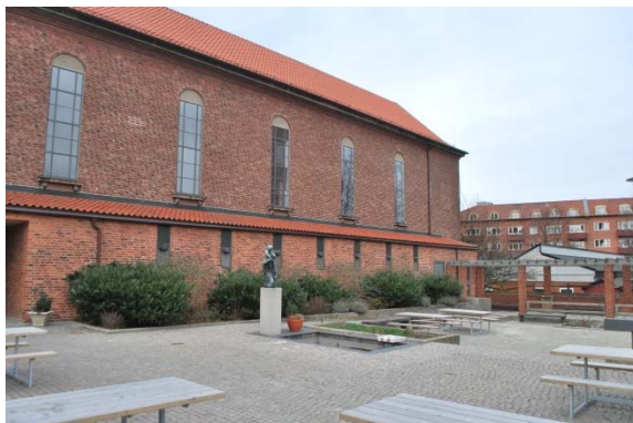
Terrassen. Fasad mot sydöst.

rektangulär, hög form med ett sadeltak. Längs hela sydöstfasaden mot Nobelvägen ligger ett lågt, smalt sidoskepp som byggdes 1963 med entré från terrassen. På andra sidan kyrkan finns det låga stora församlingshemmet.