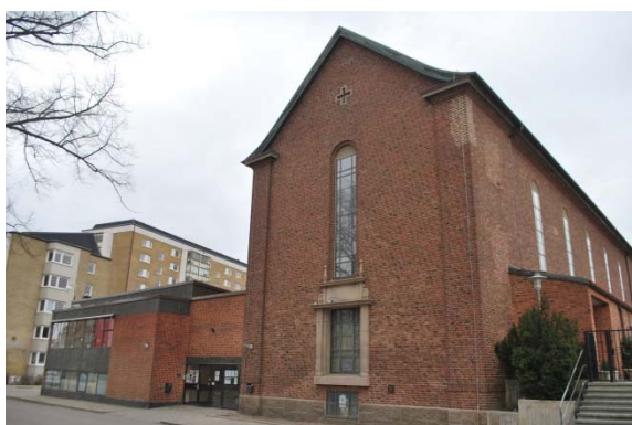
Fasad mot sydväst.