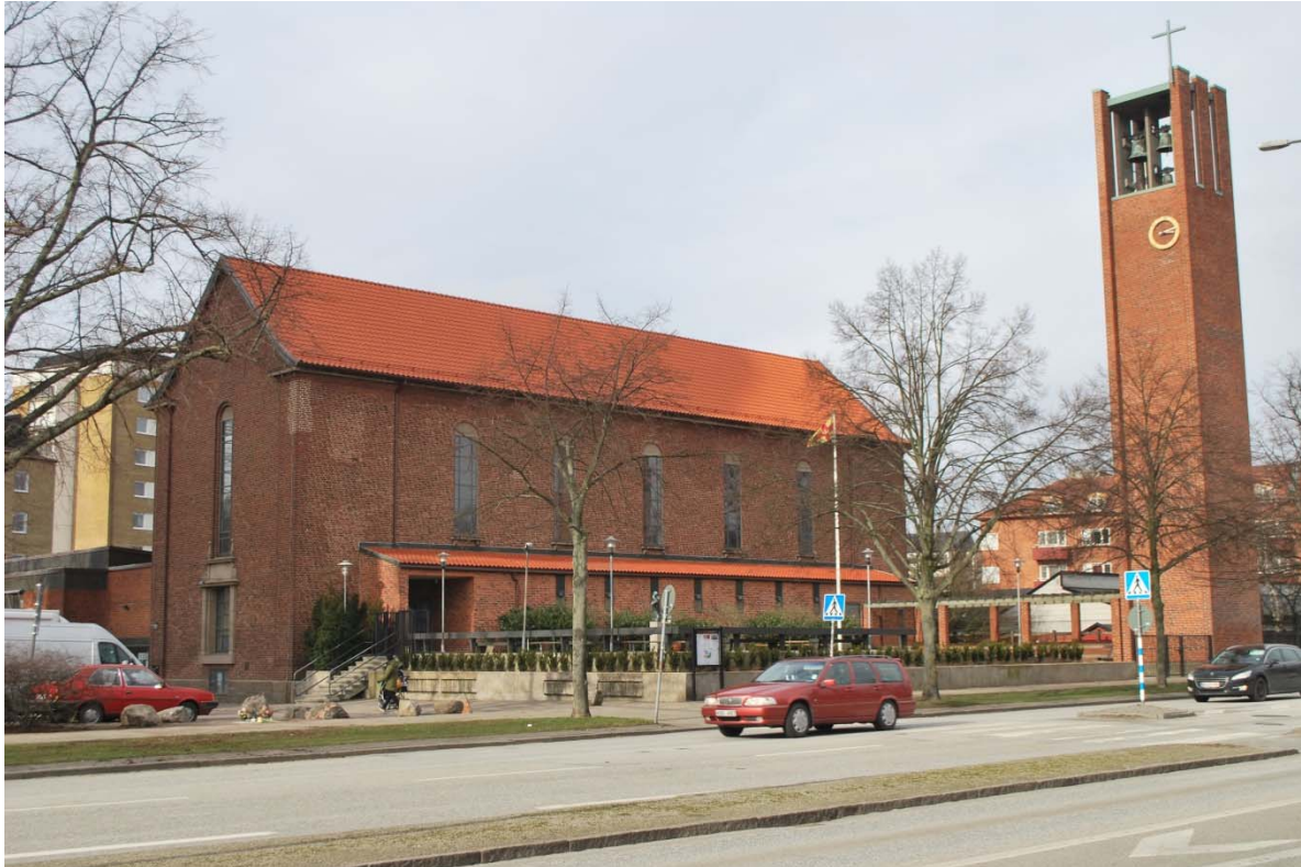
Fasad mot sydöst