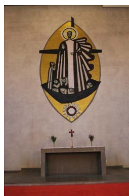
Mosaik av Bo Beskow