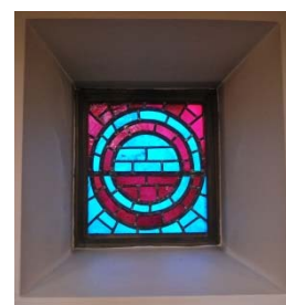
Glasfönster av Bo Beskow