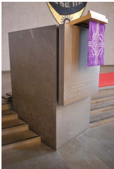
Predikstol av kalksten.

Predikstolen är uppbyggd av tre sidor av kraftiga kalkstensskivor. Den främre kalkstensskivan är monterad med distans med metallstag från de två sidoskivorna. Framskivan ger intryck av att sväva i luften. Överst finns en pulpetskiva av ek. Predikstolen är integrerad i korttrappan. En likadan predikstol finns i S:t Andreas kyrka i Malmö.