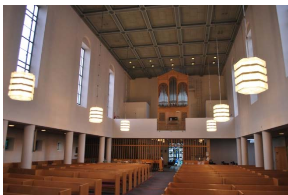
Långhuset mot orgelläktaren.