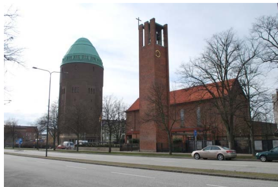
Vattentorn och klocktorn.