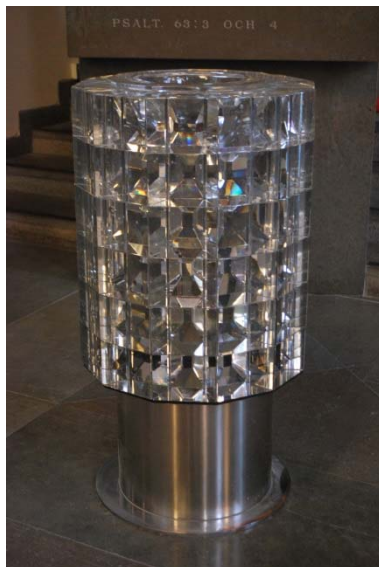
Dopfont av glasprismor.