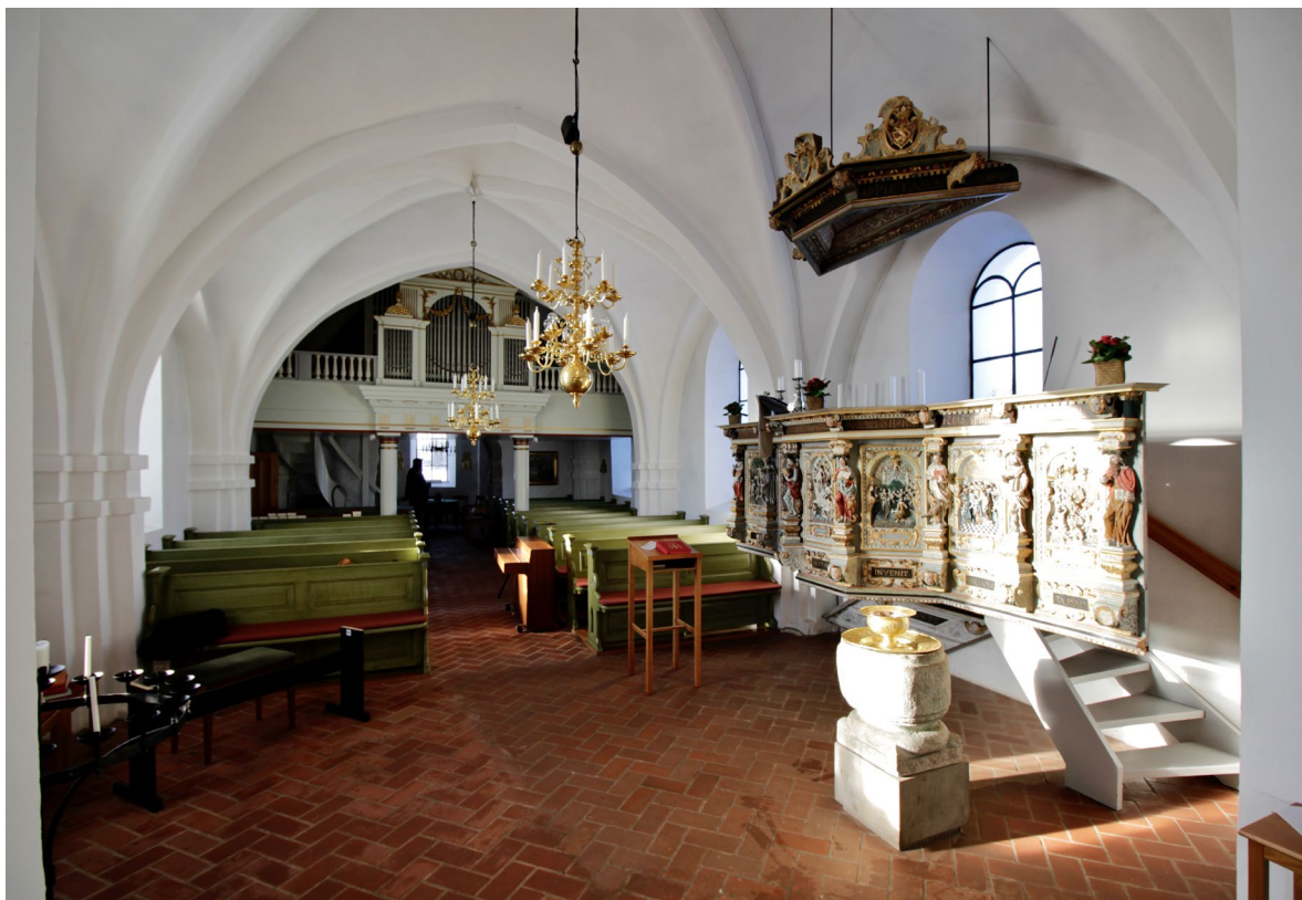
Långhuset sett mot tornrummet i väster.

triglyfer. Ovan detta står den samtida tempelgavelutformade orgelfasaden vilken flankeras av balustrader. Läktaren och orgelfasaden är bemålade i en bruten vit kulör med detaljer i rött, mörkgrått och förgyllning.