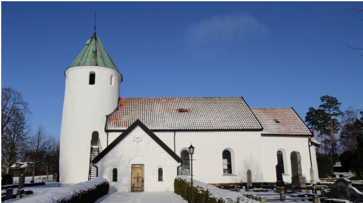
Sedan uppförandet av vapenhuset vid slutet av medeltiden har Hammarlunda kyrka bibehållit samma byggnadsvolym.

Kyrkan byter vid ett flertal tillfällen under 1800-tal och tidigt 1900-tal taktäckningsmaterial. Blytaken försvinner i sin helhet på 1880-talet, enligt flera källor till förmån för tegel. Vapenhuset har vid denna tidpunkt spåntak. 1896 får tornet järnplåt, vilket det möjligen också kan ha haft tidigare, och övriga takfall täcks med asfaltspapp som 1920 ersätts av enkupigt lertegel med pappen bevarad under. Uppgiften om att taken bekläddes med tegel redan på 1880-talet för att väldigt snart därefter få papptak fram-