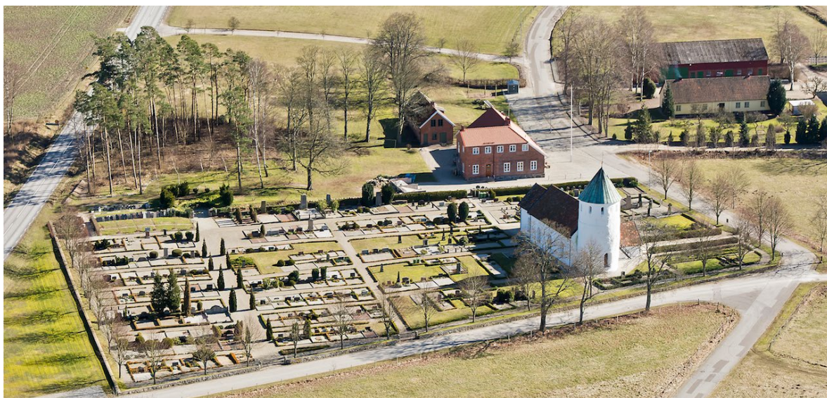
Hammarlunda kyrkogård har i flera omgångar utvidgats åt norr och öster.

Huvudingången ligger i söder genom en smidd järngrind. Fler ingångar återfinns i öster och väster. Från en av ingångarna i öster löper en bredare gång kantad av höga tujor i axel med det tidigare bårhuset. De rektangulära gravkvarteren är placerade i