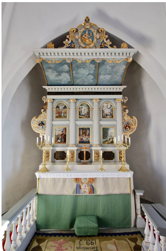
Altare och altarpupsats.