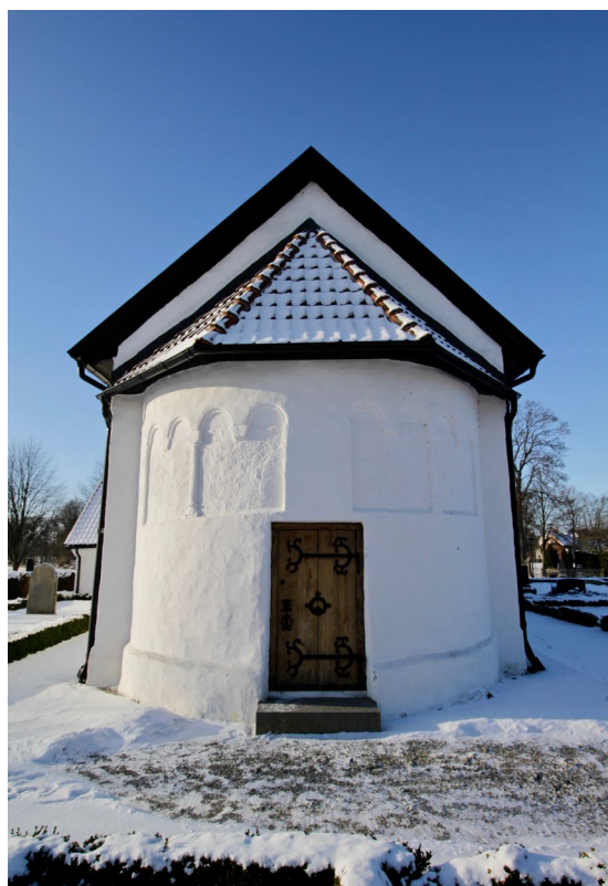
Absidens utsmyckning med spiralvridna halvkolonetter, inspirerad av Lunds domkyrka.