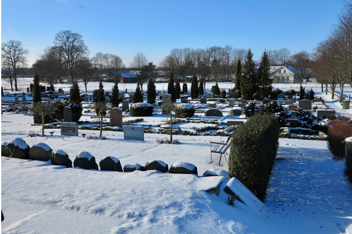
Kyrkogårdens 1900-talsdel med parställda tujor i centralaxeln som tidigare ledde till gravkapellet.

nord-sydlig riktning med undantag av de äldsta delarna söder om kyrkan, där även öst-västlig riktning förekommer. Stora delar av kyrkogården är gräsbevuxen, medan gravplatserna är belagda med vit och i vissa fall röd singel som omgärdas av låga buxbomshäckar eller polerade stenramar.