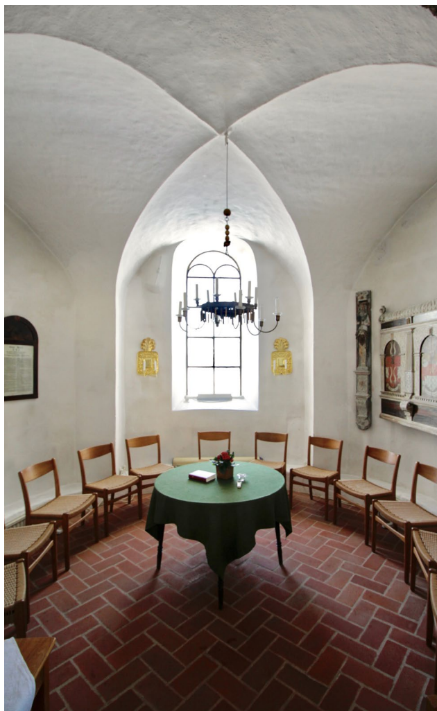
Det ålderdomliga uttrycket tyder på att tornet kan ha valvslagits redan vid uppförandet på 1200-talet. Tornet kan initialt ha fungerat som gravkor för kyrkans patronus. Idag används tornrummet som sidokapell.

Sedan valvslagningen och uppförandet av vapenhuset under senare delen av medeltiden har kyrkan genomgått väldigt få ändringar. Efter att biskop Flensburg 1875 besökt kyrkan och framhåller att den bör flyttas då den är "skrymmande och osäker att