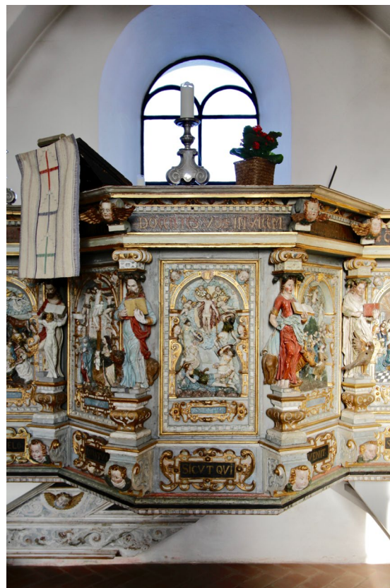
Detalj av läktarpredikstolen i renässansstil, ett verk av bildhuggaren Jacob Kremberg.

och således är beställarna av uppsatsen. Konstnären bakom altarpupsatsen är okänd, men ett namn som nämnts är bildhuggaren Daniel Tommisen i Malmö.