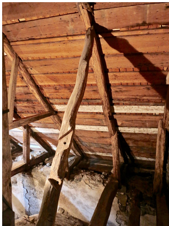
Dateringar från 1970-talet tyder på att virket i långhusets och korets takstolar delvis kan vara återanvänt från de tidigare träkyrkorna, uppförda på 1000-talet.

Altaruppsatsen i renässansstil från 1589 är av så kallad additionstyp, med vilket menas att den har flera våningar ställda över varandra. Predellan eller fundamentet har tre svartmålade texttavlor med förgylld text. Även de sex altartavlorna var ursprungligen bemålade på detta vis, med nattvardens instiftelseord på danska, tyska och latin. Dessa försågs på 1700-talet istället med målningar av Pehr Hollbeck föreställande scener ur Jesu liv; Jesu födelse, nattvarden, Jesus i Getsemane, korsfästelsen, uppståndelsen samt himmelfärden. Altartavlorna inramas av fyra kannelerade pilastrar vilka bär upp en profilerad gesims samt en baldakin vars tre fält är blåmålade med molnformationer. Uppsatsen kröns av en medaljong framställande en kvinna med kalk, troligen symboliserande Fides (Tron). I de relativt små sidovingarna finns medaljonger med Henrik Brahes och Lene Thotts vapen, som vid denna tid innehade Löberöds herresäte