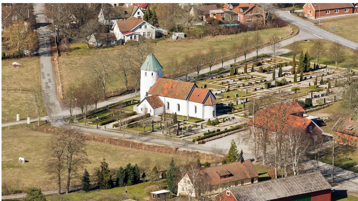
Flygbild över Hammarlunda 2014, tagen från sydost.

Få arkeologiska undersökningar har genomförts i byn, men utgrävningar i kyrkans västtorn vid mitten av 1960-talet tyder på att platsen var betydelsefull under vikingatid och tidig medeltid. Den medeltida byn antas ha haft en snarlik utbredning som det Hammarlunda som syns på den geometriska avmätningsskattan från 1767, där tio av