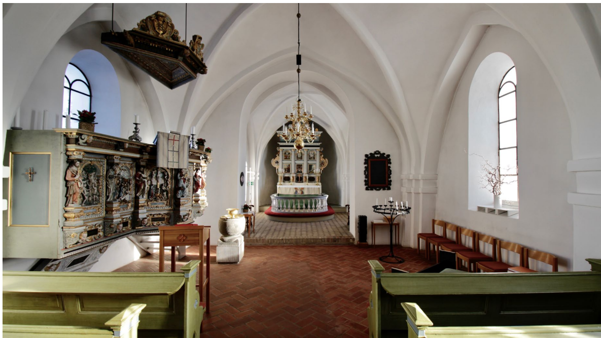
Långhuset sett mot koret i öster.

Långhuset är indelat i tre travéer, där kryssvalv vilar på tresprångiga hörn- och sidopilastrar. Golvet är belagt med rött rektangulärt tegel i fiskbensmönster medan de öppna bänkkvarteren står på ett betsat brädgolv med yttre kantbrädor i klarlackad ek. Väggar och valv är vitputsade. På den norra yttermuren i den östligaste travéen återfinns läktarpredikstolen med baldakin. I väster upptar orgelläktaren hela långhusets bredd. Läktaren har ett utpräglat nyklassicistiskt formspråk och vilar förutom i murverken på två toskanska kolonner som bär upp ett utskjutande entablement med