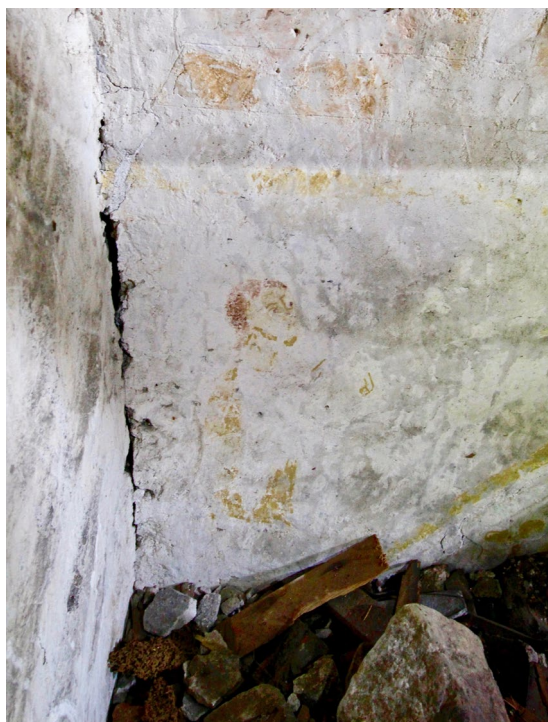
2012 upptäcktes en kalkmålning som tros föreställa S:t Kristoffer.