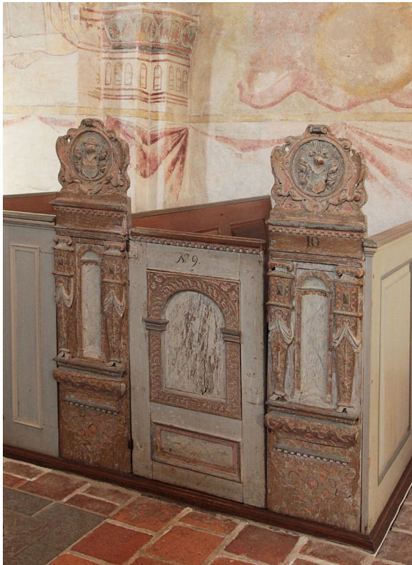
Herrskapsbänkarna i koret snidades på 1600-talet av Jacob Kremberg.

Predikstolen är placerad i långhusets sydöstra hörn och tillverkades i renässansstil av bildhuggaren Jakob Kremberg 1615. Korgen vilar på en snidad kolonn och har fem bildfält föreställande Jesu födelse, korsfästelsen, uppståndelsen, himmelfärden och pingstundret. Bildfälten är det enda som återstår från den ursprungliga korgen sedan predikstolen byggdes om i samband med att den flyttades från Västra Sallerups kyrka till Eslövs kyrka i slutet av 1800-talet. Även baldakinen tillverkades av Jakob Kremberg och är rikt snidad i renässansstil. Fyra av sidorna är dekorerade med adelsvapnen för släkterna Bille, Brok, Gjöe och Krabbe.