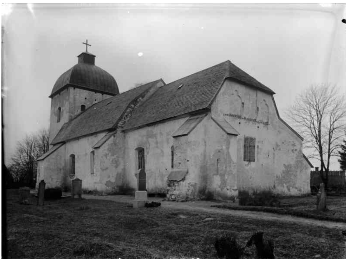
Västra Sallerups kyrka, troligen fotograferad omkring sekelskiftet 1900. Långhus och kor har spånklädda mansardtak.

På 1860-talet rymde inte den gamla medeltidskyrkan längre sin församling som därför