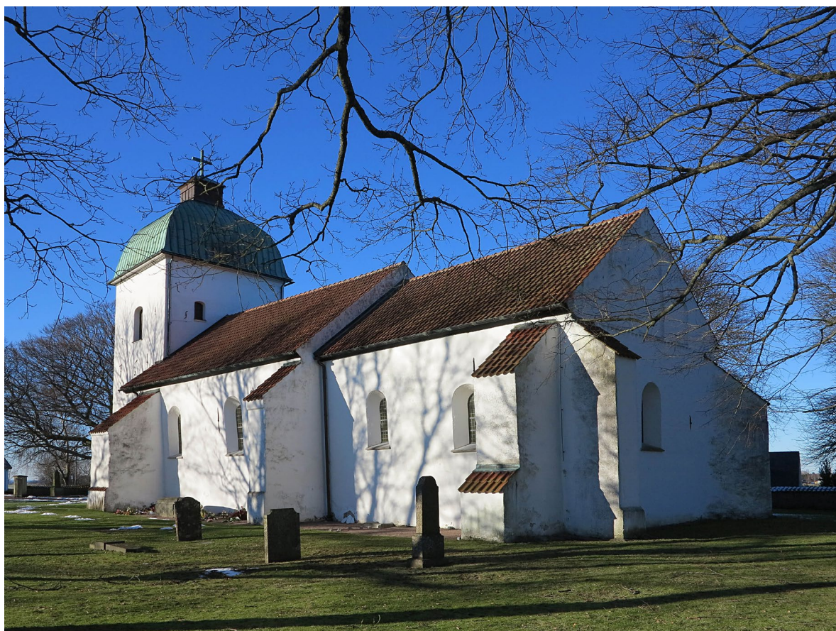
Västra Sallerups kyrka fotograferad från sydost. De kraftiga strävpelarna stöttar långhusets och korets murar.

Tornfasaderna pryds av flertalet dekorativt utformade ankarslutar, vars tekniska funktion är att hålla samman konstruktionen. Ankarslutarna är norr, väster och söder bildas texten ANNO 1751, och på västfasaden står de romerska siffrorna MDC (1400). Båda årtalen markerar omfattande ombyggnader av tornet. På den södra fasaden finns ett solur från 1700-talet i kalksten och i den norra fasaden en nisch som markerar en tidigare dörröppning. Klockvåningen har stickbågiga ljudöppningar i samtliga väderstreck.