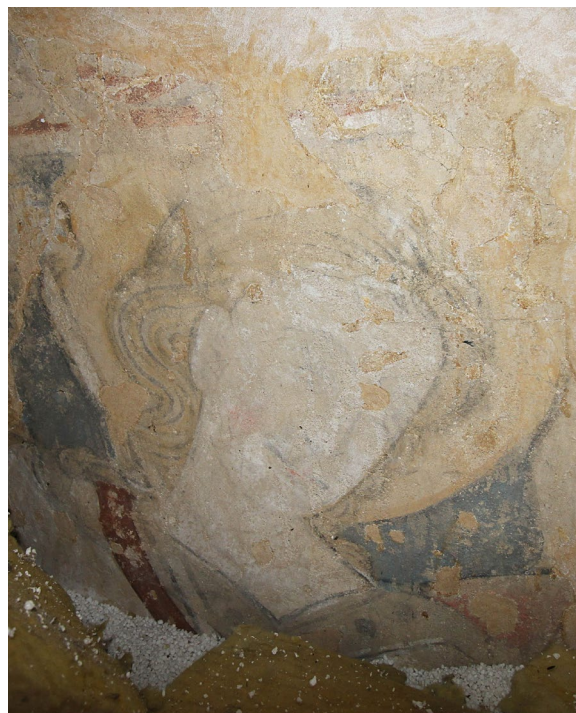
Romansk målning ovan valv föreställande S:t Mikael.

Under den västra delen av koret finns ett gravkor som brukats av patronus på Ellinge åtminstone sedan 1600-talet. Gravkoret täcks av en stor kalkstensskiva.