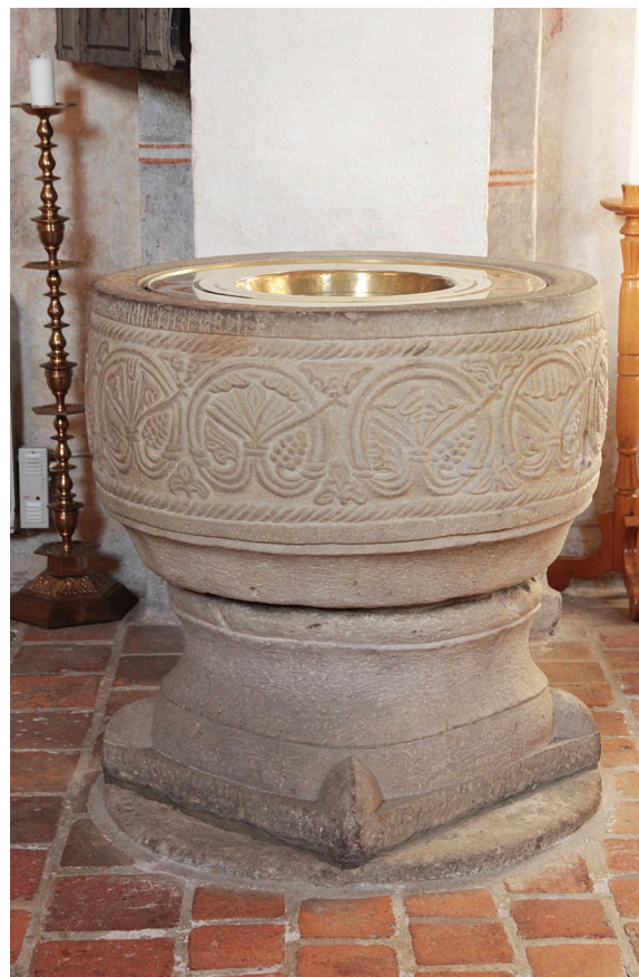
Dopfunten höggs av Mårten stenmästare på 1100-talet.

Dopfunten är placerad vid den mittersta gördelbågens norra sida och tillverkades på 1100-talet i sandsten av den skånske stenhuggaren Mårten stenmästare. Cuppan är dekorerad med palmettmotiv, livsträd och repstav. Överst finns runor med orden ”Martin mik giarde”: ”Mårten gjorde mig”. Foten är kvadratisk med accentuerade hörn och vilar på en cirkulär stenplatta. Dopfunten stod mellan 1891 och 1953 i Eslövs kyrka.