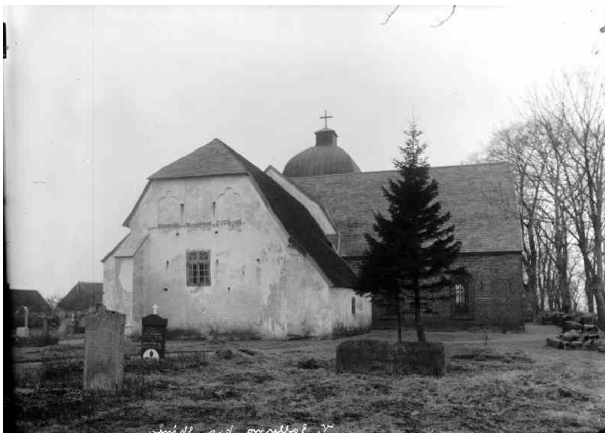
På den norra sidan syns korsarmen från 1793.

började planera för en ny kyrka placerad i det snabbt växande stationsområdet Eslöv. 1891 invigdes Västra Sallerups nya kyrka, senare kallad Eslövs kyrka, en nygotisk helgedom i rött tegel. Västra Sallerups gamla kyrka ansågs då "både obehövlig och i saknad av all arkitektur" och lämnades att förfalla.