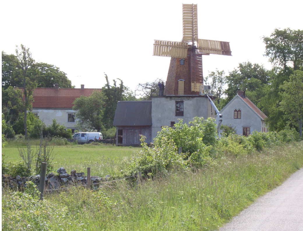
Foto under restaurering, juni 2009.

Länsstyrelsen i Gotlands län har tagit initiativ till byggnadsminnesförklaring (BM) av väderkvarn med tillbyggd bod på fastigheten Gotland Vamlingbo Bonsarve 1:2.