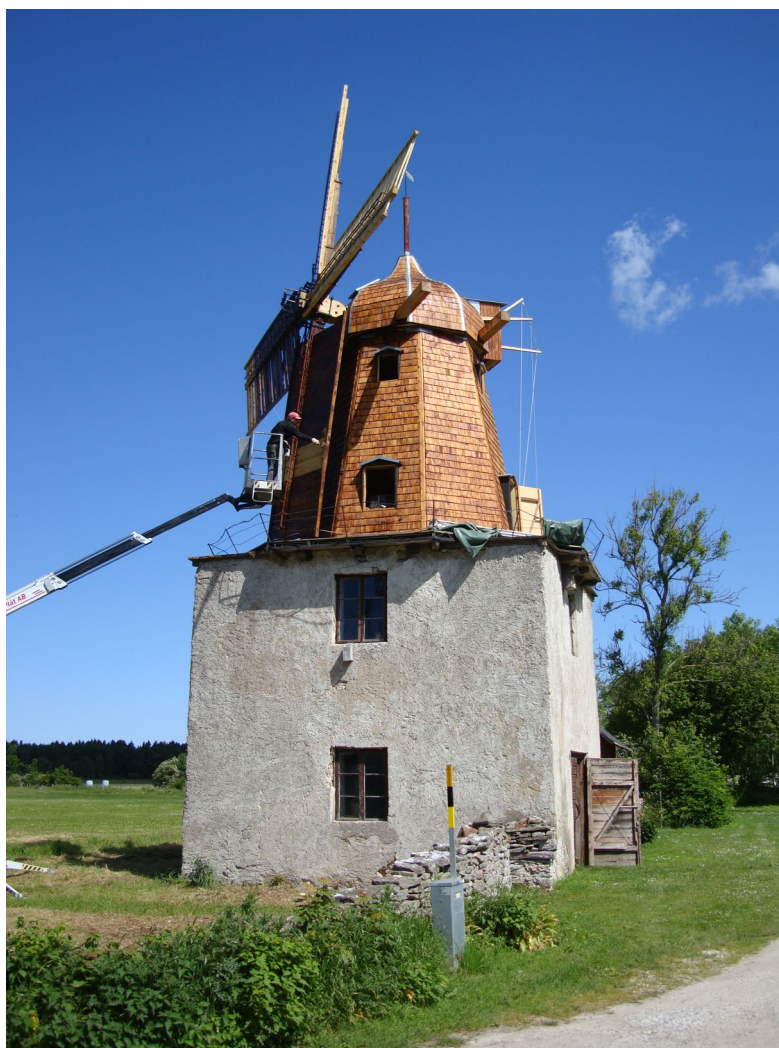
Foto under restaurering, juni 2009.

Mot norr är kvarnen tillbyggd med en träbyggnad. Här finns en hackelsemaskin och en spånsågsbänk och tidigare fanns det också en vedkap. Maskinerna var ursprungligen drivna av väderkvarnen. Innan träbyggnaden uppfördes låg gårdens äldre vinkelbyggda stenladugård här, med kvarnen som avslutning i söder. Spår av den rivna ladugården syns ännu som grundstenar i marken.