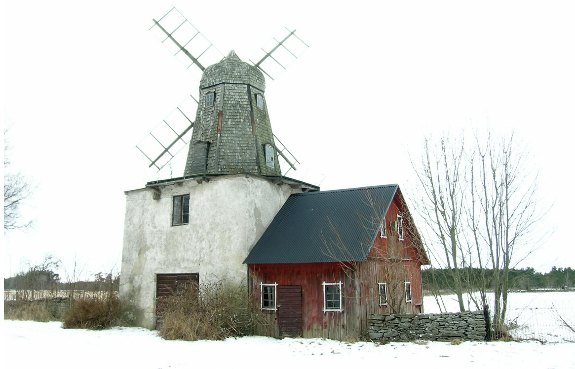
Foto före restaureringen 2008-2009.

Väderkvarnen ingår som en del av gårdsmiljön vid Bonsarve och den är byggd som en gårdskvarn använd i första hand för gårdens eget behov samt för malning åt de närmaste grannarna. Byggnaden ligger i anslutning till vägen med det öppna åkerlandskapet mot väster.