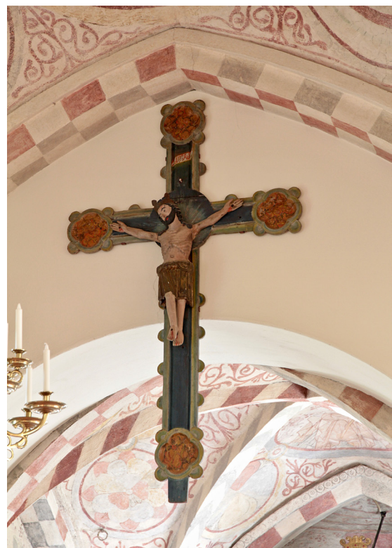
Triumskrucifixet är möjligen ett 1500-talsarbete efter romansk förebild.

På triumfbågen hänger ett bemålade krucifix med en lidande Kristus, dock