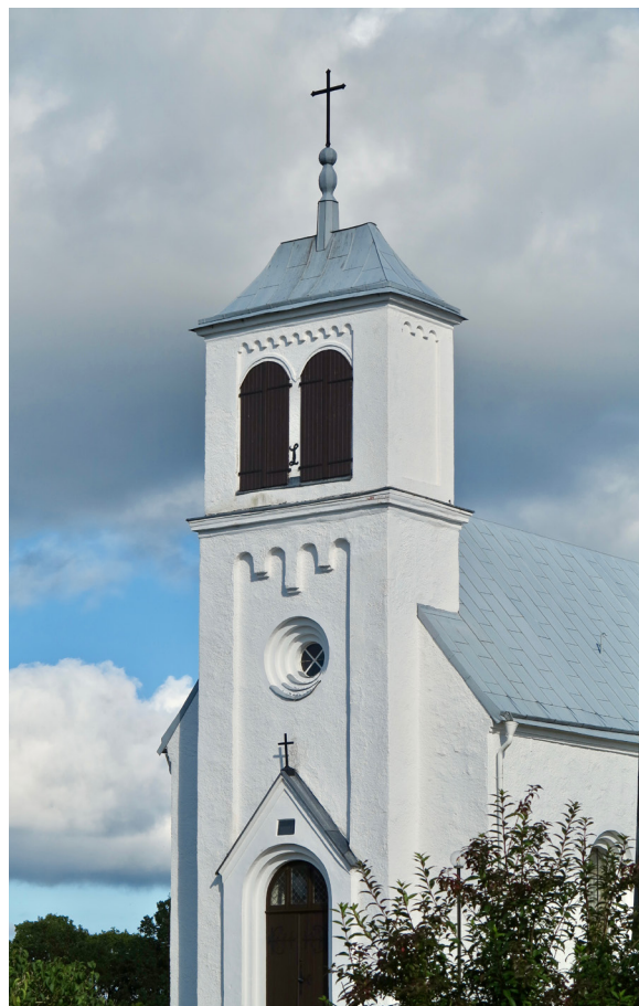
Västtornets smala och relativt låga utformning sätter visuell särprägel på kyrkans exteriör.

Merparten av kyrkans fönster är högresta och rundbågiga, med bågar i smidesjärn och blyinfattade glas. Rutorna är i en rundbågig fris gula men i övrigt ofärgade. Av denna fönstertyp återfinns två i långhusets södra fasad och fyra i dess norra, ett vardera i korsarmarnas fasader åt väster, öster samt i den östra delen av sydfasaden. Korsarmens fönster åt öster särskiljer sig då det är försett med glasmålningar av konstnären Per Lindekrantz. I korsarmens östra gavelröste sitter ett rundfönster med tresprångig omfattning. I korsarmens västra del saknas fönster åt söder. Här är istället kyrkans sydentré placerad i en tvåsprångig omfattning. Dörren har liknande utformning som i västentrén. Korets fönster, ett i norr och ett i söder, är utformade enligt tidigare beskrivna princip men är inte lika högresta. Absiden har en liten fönsteröppning i öster, av romansk typ men sannolikt tillkommen vid 1960-talets restaurering. I putsen syns ännu spåren av en tidigare portal. Ett romanskt fönster som däremot troligen är ursprungligt återfinns i norrfasaden, högt placerad mellan de östra travéernas båda rundbågiga fönster. På samma fasad, mellan de två östra fönstren, finns en rundbågig brunmålad plankdörr utan omfattning som leder till torntrappan. Dörren är placerad på samma höjd som fönstren och nås via en betongtrappa med räcke i järn.