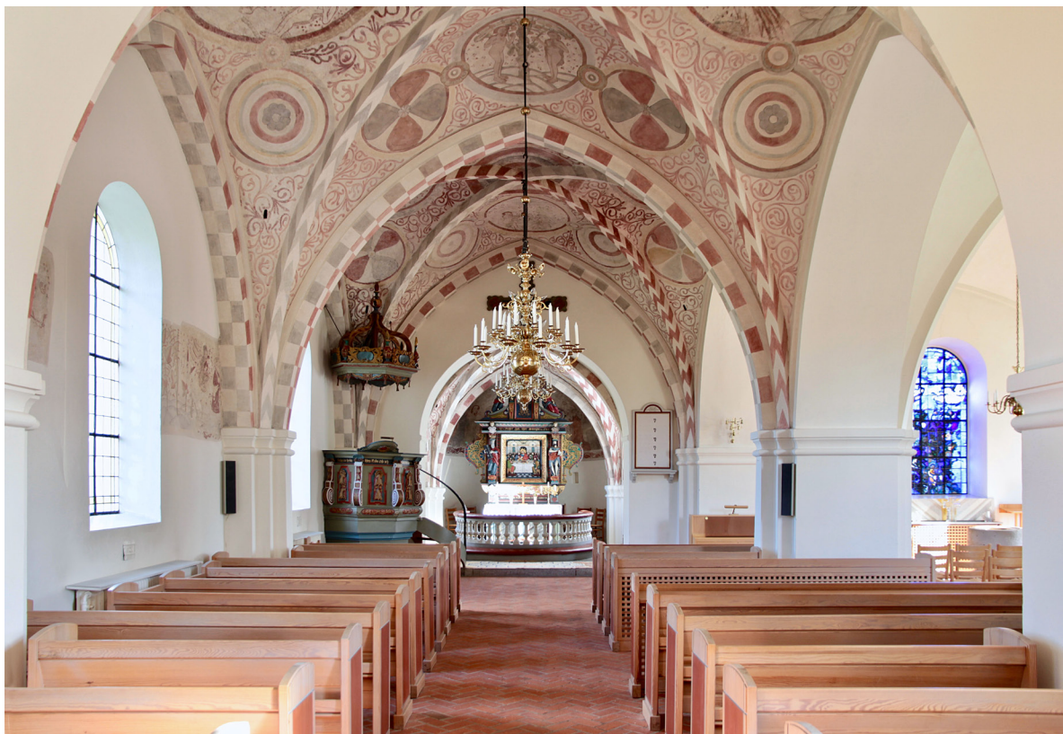
Valvens medeltida kalkmålningar präglar kyrkorummet. Till höger i bild skimtar den södra korsarmen som sedan 1963 fungerar som dopkapell.

Långhuset utgörs av fyra travéer slagna med kryssvalv. Golvet är belagt med fiskbensmönstrat hårdbränt tegel lika golvet i korsarmen. Väggarna är slätputsade och vitkalkade med fragment av medeltida målningar på ömse sidor om norrfönstret i andra travéen från koret räknat. En markering i putsen på norrväggen antyder en tidigare norrport. De två östra valven pryds av senmedeltida kalkmålningar i ljusa jordfärger i rött, gult och grått. Målningarna framställer skapelseberättelsen, syndafallet och utdrivande ur paradiset. Runt illustrationerna är valven rikligt dekorerade med olika mönster och växtornamentik. Långhusets fasta bänkinredning är uppdelad i tre kvarter kring mittgången och gången till korsarmen. Predikstolen med baldakin är placerad i rummets nordöstra hörn.