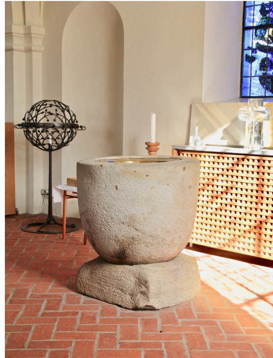
Den medeltida dopfunten tros vara äldre än kyrkan, vilket skulle kunna tyda på att en tidigare kyrka funnits på platsen.

Den polykromt bemålade predikstolen tillverkades vid 1700-talets mitt av den i Skåne välrepresenterade träsnidaren Johan Ullberg (1708–1778). Korgen är tresidig och indelas av volutformade pilastrar som flankerar speglar med växtmotiv i relief. Under den enkelt profilerade överliggaren löper ett inskriptionsfält med förgylld text mot svart botten. Korgen vilar på en fyrsidig fot med profilerad nederdel. Predikstolen har grå bottenfärg medan dekorationerna går i blått, rött, vitt och guld. Den överhängande baldakinen är sexsidig och smyckad med rocailler, eldurnor samt en tofsförsedd lambrekäng. Innertaket pryds av en förgylld sol. Baldakinen är bemålad i samma kulörer som predikstolen.