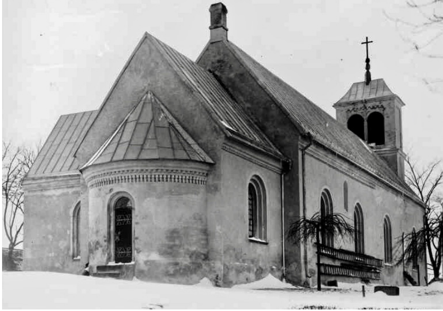
Kyrkan från nordöst. Okänt årtal, men sannolikt under 1900-talets två första decennier. Fasaderna tycks vara slätputsade och är avfärgade i gult. Notera även att ab- sidens ingång i öster ännu finns kvar.