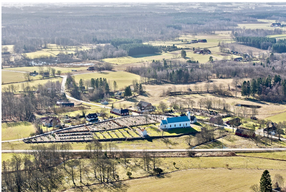
Flygbild över Långaröd tagen från norr. Foto: Pär-Martin Hedberg, 2015.

Laga skifte genomfördes vid 1800-talets mitt och spåren efter det gamla sockencentrat är få. Långaröds by utgörs idag främst av småskalig bebyggelse uppförd under 1800- och 1900-talet, placerad söder och väster om den gamla bygatan. En byggnad med central betydelse för byn står ännu kvar på kyrkbacken, den gamla sockenstugan och folkskolan som även fungerat som kommunhus och idag är församlingshem. Små-