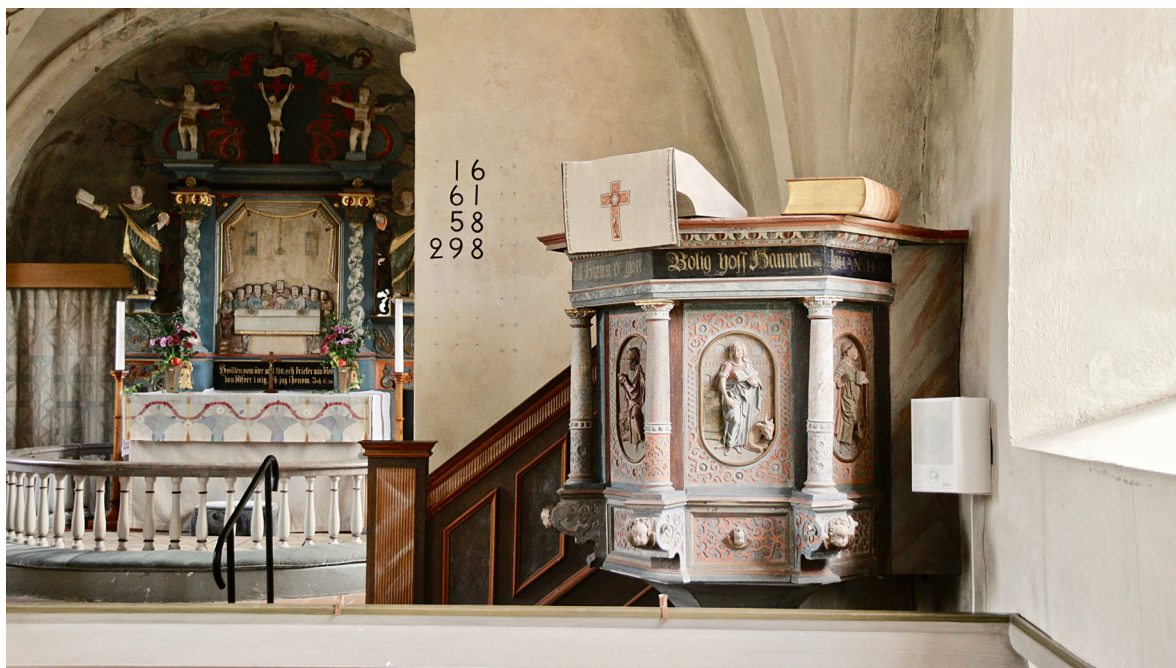
Predikstolen från 1600-talet. Till vänster i bild syns Johan Ullbergs altaruppsats som tillverkades 1745 eller 1746.

Altaruppsatsen tillverkades av den i Skåne välrepresenterade träsnidaren Johan Ullberg från Hurva, senare med verkstad i Finnja. Ullbergs produktion av altaruppsatser och predikstolar följer ett tidigt etablerat formspråk, i den stil som något nedlåtande