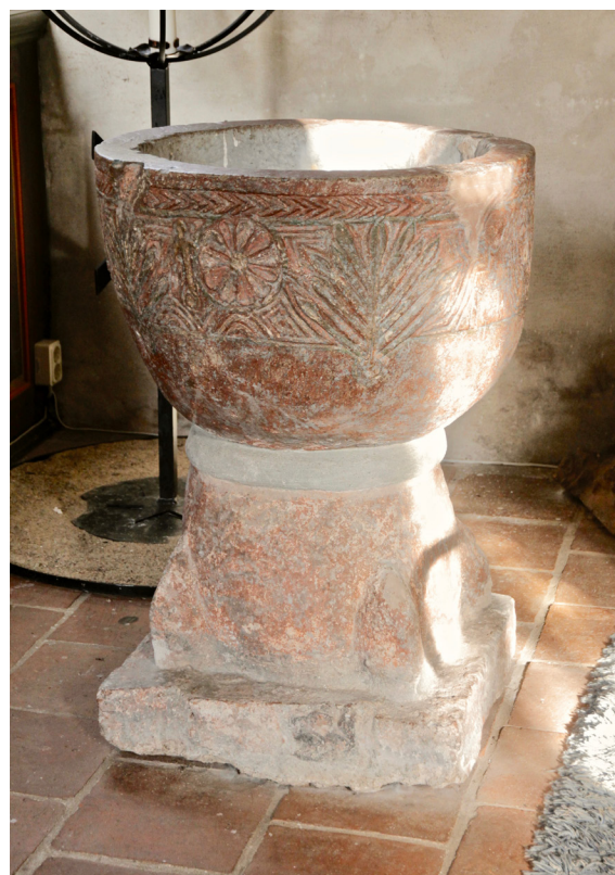
Den bemålade dopfunten i sandsten är kyrkans äldsta inventarium.

I långhusets nordöstra hörn står den medeltida dopfunten i sandsten som har tillskrivits Torrlösagruppen. Den runda cuppan är dekorerad med bland annat repstav och palmettfris. Den något konformade foten har hörntappar och