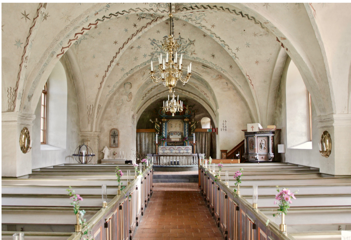
Kyrkorummet mot koret i öster.

av kalkmålningar som daterats till kring 1550 och bland annat framställer stiliserade blommor, rankor, stjärnor och fåglar. De rundbågiga fönstren har innerbågar av lackad ek, utan spröjsning och med klarglas. I de spröjsade ytterbågarna sitter antikglas. Den västra travéen upptas av orgelläktaren som vilar på åtta pelare av trä och nås via två svängda trappor utmed långhusets västra vägg. Balustraden utgörs av svarvade dockor och bryts centralt upp av ett femdelat ryggpositiv till orgeln. Balustraden är sedan 1987 förhöjd med ett tunt vitmålat metallräcke, ritat av Uno Nilsson på K-konsult. Läktaren inklusive ryggpositivet är målad i en bruten vit kulör med detaljer i rött, grönt och grått.