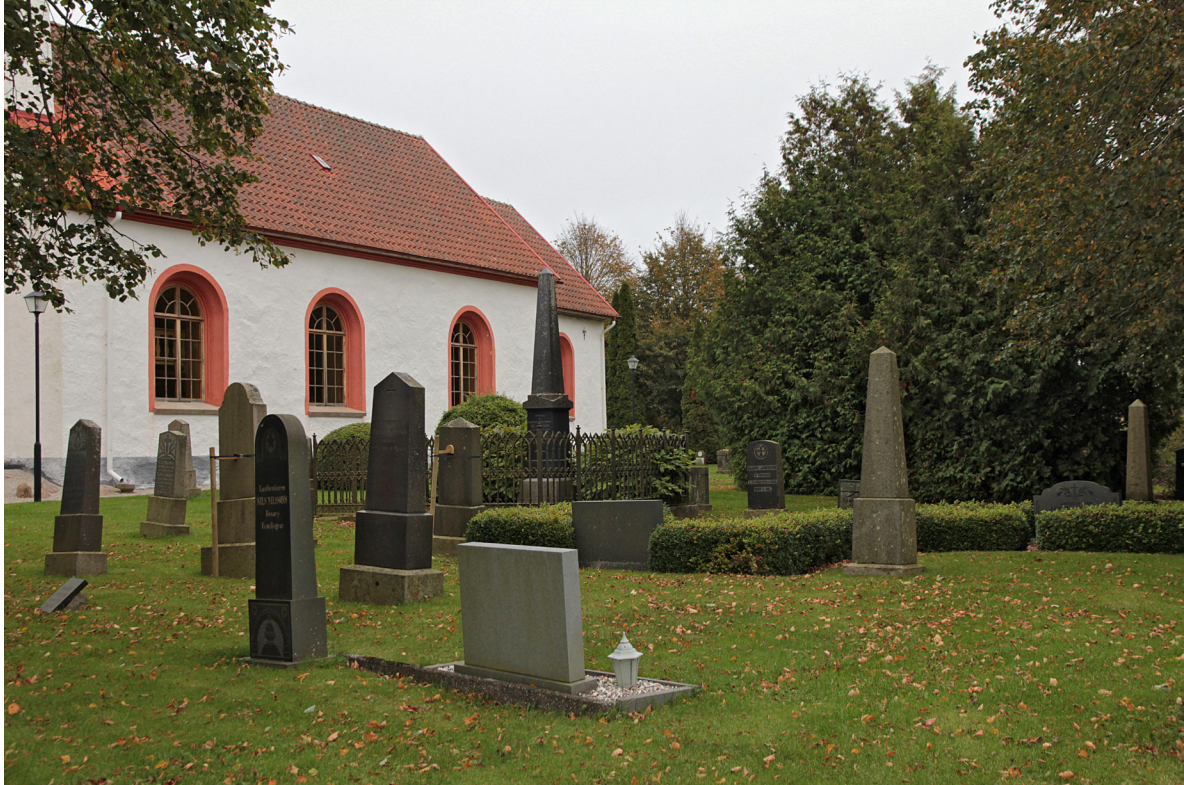
Söder om kyrkan karaktäriseras kyrkogården av äldre högresta gravstenar från tiden kring sekelskiftet 1900.

1890 anlades en ny kyrkogård i norr, vilken nås genom en grind i väster av samma typ som på den äldsta kyrkogården samt en grind längre norrut med annan typ av smidesgrind och järnstolpar, troligen samtida med utvidgningen. Längs de västra, norra och östra sidorna löper en kallmur av natursten och i väster och norr även en hagtornshäck samt en trädkrans. Kyrkogården är uppbyggd kring ett gångsystem av grusade gångar i rutnätsplan. Förutom ett fåtal grusade gravar med stensatta inramningar är kyrkogården i övrigt gräsbevuxen och domineras av glest placerade äldre högresta gravstenar. I öster finns ett fåtal yngre lågt hållna gravvårdar mot en rygghäck av liguster. Vegetationen är sparsam, med ett fåtal buskar som formklippt tuja och rhododendron samt några yngre lövträd.