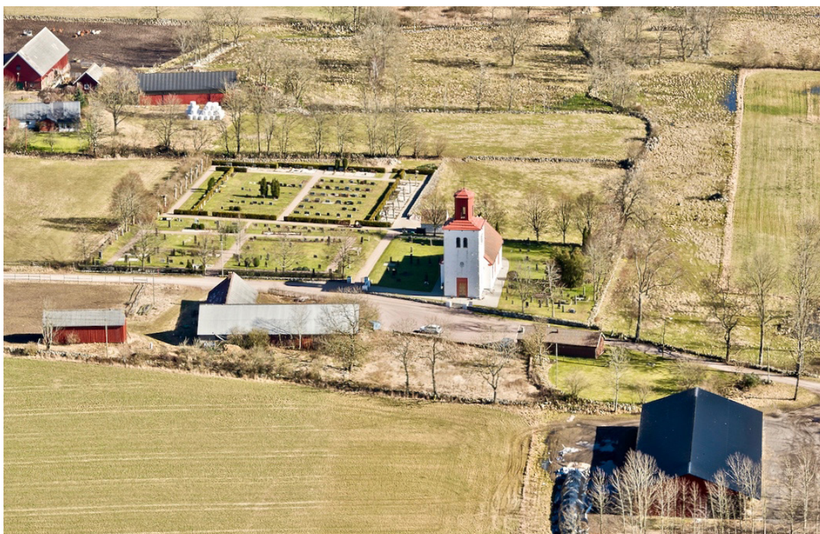
Flygbild över Äspinge kyrka 2015, tagen från väster.

Innan 1800-talets skiften var de flesta av byns gårdar samlade direkt norr om kyrkan. Nordväst om Äspinge anlades 1886 en station vid järnvägslinjen mellan Hörby och Kristianstad, och ett decennium senare ett bränneri i anslutning till stationen . Någon