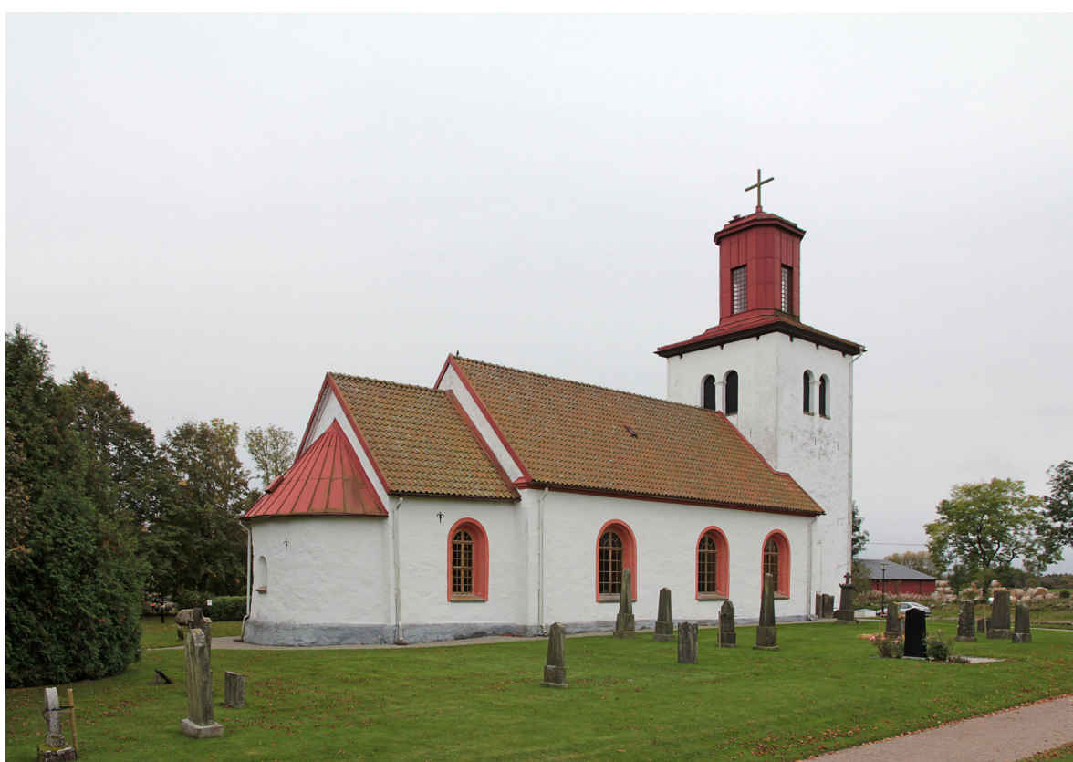
Kyrkan från sydöst 2017.

I västtornet återfinns kyrkans huvudentré. Den rektangulära och slätputsade omfattningen är något indragen från fasadlivet och enkelt utformad med lister som ovanför dörren bildar ett rektangulärt liggande parti. På listerna finns äldre handsmidda beslag från en tidigare utåtgående port. Den nuvarande porten sitter indragen från omfattningen och utgörs av en pardörr i lackad ek med fyra fyllningar i vardera dörrblad. I den södra fasaden finns ett fönster i en stickbågig fönsteröppning. Fönstret består av fyra småspröjsade och gråmålade lufter av trä, möjligen furu. På norra fasaden finns en stickbågig blindering. Tornets andra våning har i sydfasaden ett mindre runt fönster av vitmålat trä med korspröjs. Klockvåningens ljudöppningar är rundbågiga, två i varje väderstreck, med ljudluckor av svartmålad spontad panel. Tornets tak utgörs av ett flackt tälttak med lanternin, allt inklätt med rödmålad plåt i skivtäckning. Den åttkantiga lanterninen har ett högre rektangulärt och småspröjsat fönster i ek i varje