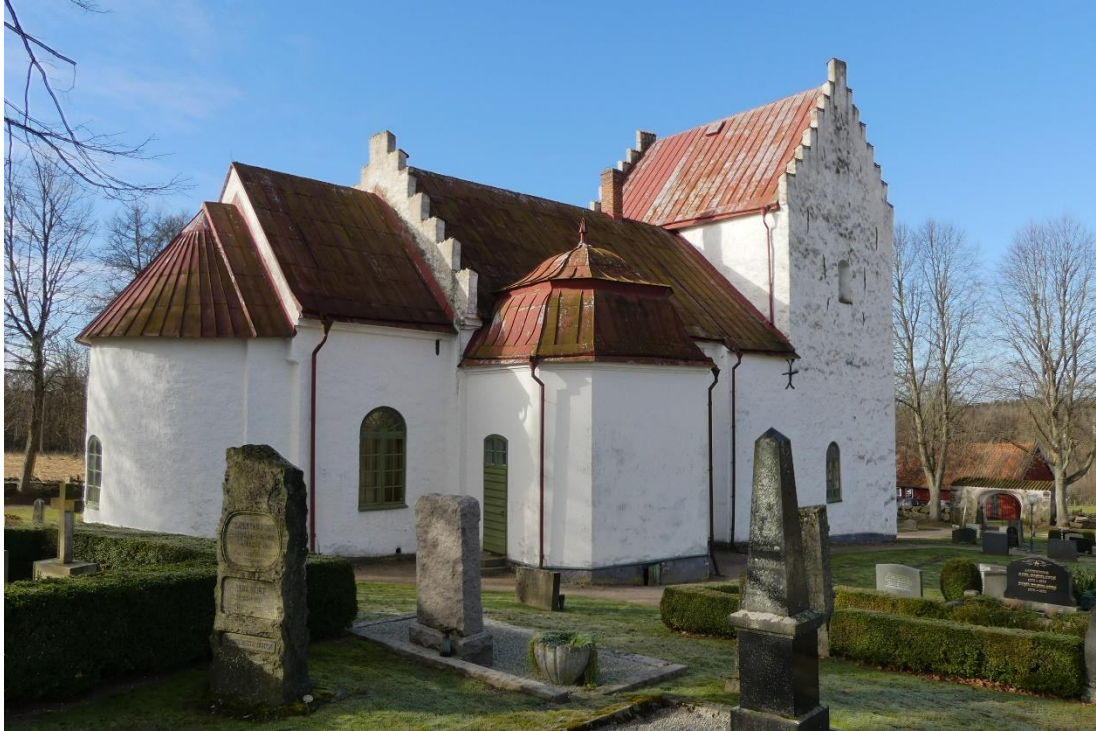
Gryts kyrka sedd från norr