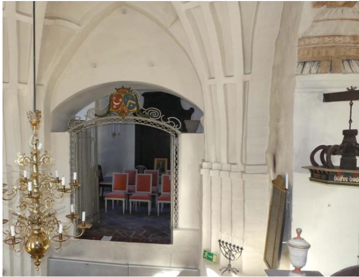
Grevekoret vid långhusets norra sida, sett från predikstolen.

En yttre renovering genomfördes 1977 då fasaderna putsades och avfärgades samt taken och fönstren målades. Nästa yttre renovering utfördes 1992 och 1993 då även en byggnadsarkeologisk undersökning utfördes av kyrkans fasader. Bland annat dokumenterades rester av den ursprungliga sydportalen, tre äldre fönsteröppningar och utvändigt dekormålning.