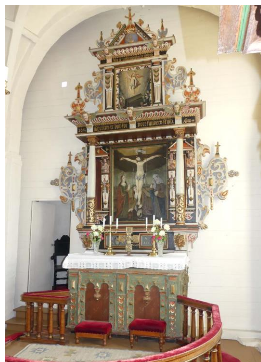
Kyrkans predikstol, altare och altarpredikstol är från 1600-talet.