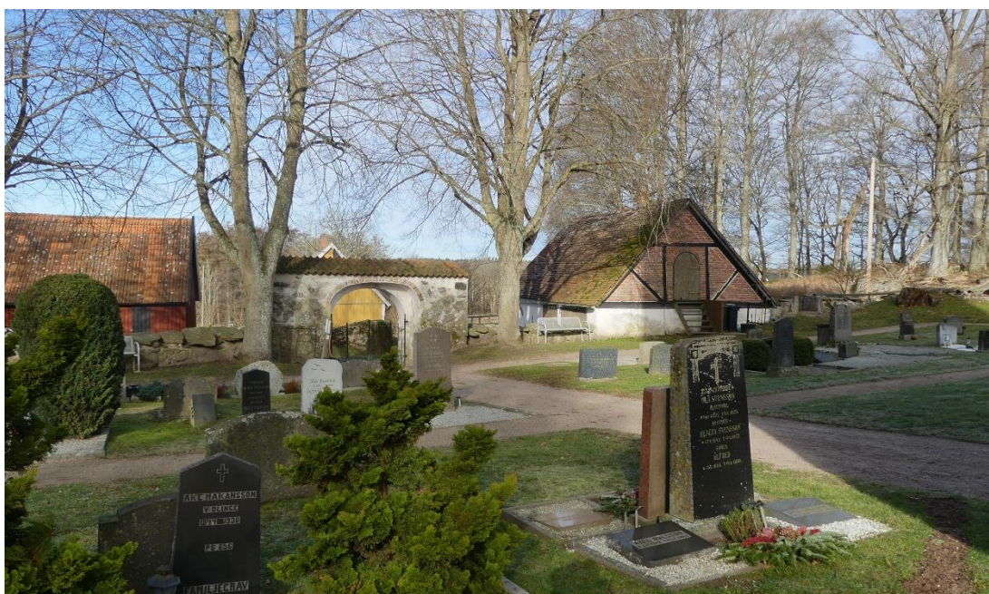
Vy över kyrkogårdens västra del med västra stigluckan och sockenstugan i fonden.

Kyrkan ligger mitt på den lilla kyrkogården som kan ha kvar sin ursprungliga storlek sedan kyrkan anlades. Kyrkogården ligger i en backe med sluttning ned från öster och norr. Den begränsas av en låg kyrkogårdsmur som finns omnämnd sedan 1600-talet. Liksom idag bestod muren av fogstruken gråsten avtäckt av tjocka gråstensflis. Mellan flisen ligger enkupiga tegelpannor som fungerar som vattenrännor. Två ingångar finns till kyrkogården i form av murade öppningar med takövertäckning, så kallade ”stigluckor”. Ytterligare en stiglucka har tidigare funnits, den så kallade ”likporten”. Den västra stigluckan är större än den södra. Båda stigluckorna är murade av stora gråstenar med en rundbågsformad öppning med valv murat av rött tegel. Öppningarna är invändigt murade med ett språng för inåtgående portar. Teglet och murverket är delvis synligt men rester av gammal rödfärgad puts finns bevarad kring muröppningen. Upptill avslutas stigluckorna med ett sluttande tegeltak lagt i bruk. I ingångsöppningarna sitter järngrin-