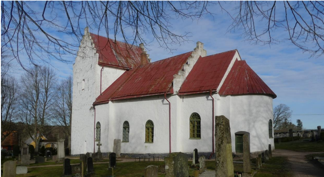
Kyrkan från söder.

brott i sockelpartiet på långhusets norra och södra sidor ungefär beläget under långhusets västra fönsteröppningar. Högt upp på norra långhusfasaden finns en ingång till kyrkvinden i form av en liten vitmålad lucka uppe vid murkrönet. Vid långhuset södra sida står en gravhäll av kalksten tillhörande ryttmästaren Böckler som begravs under korgolvet 1710. Vid slutet av 1800-talet flyttades stenen till sitt nuvarande läge. I absidens södra sida finns en sekundär dörröppning i form av en låg stickbågig muröppning. En grönmålad bräddtäckt dörr sitter djupt indragen i öppningen med ett utvändigt trägaller.