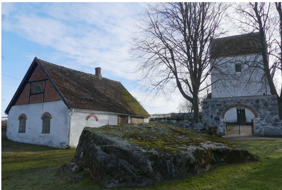
Sockenstuga och ingång till kyrkogården från väster. Längst fram i bilden syns trollstenen.

Kyrkan är uppförd i romansk stil vilket kännetecknar 1100-1200-talets mitt i de nordiska länderna. Någon närmare datering av kyrkan har inte utförts. Kyrkans äldsta delar består av ett kor med absid, långhus och den nedre delen av ett ursprungligt västtorn. Kyrkan byggdes av tuktad fältsten, framför allt granit, lagd i jämna skift i skalmurar. Murverket kan ursprungligen ha varit oputsat med brett utstrukna fogar. Hörnkedjorna i de äldsta delarna är murade av nästan släthuggna granitblock liksom fönster och portalomfattningar. Ursprungliga öppningar finns bevarade genom en igensatt fönsteröppning, synlig ovan valven, och ingångsöppningar i gavlarna till kyrkans vindsutrymmen. Den ursprungliga sydportalen är igenmurad men har dokumenterats vid murverksundersökning. Portalen har haft en omfattning av halvkolonner med kapital och profilhuggna valvstenar. Hur nordportalen har sett ut finns dock inte dokumenterat.