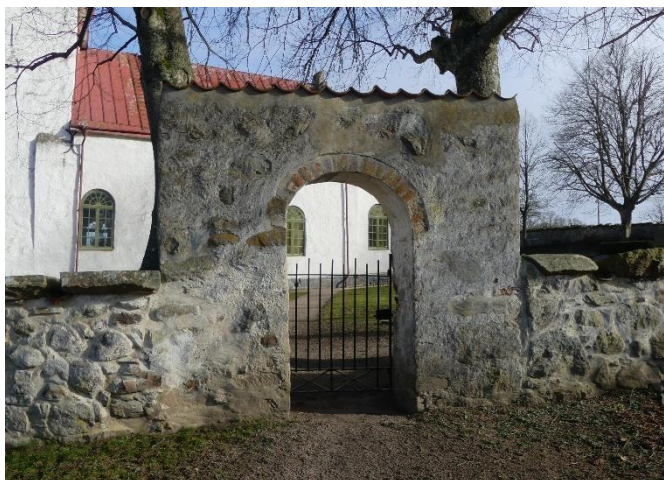
Södra stigluckan till kyrkogården.

gravplatser finns vilka begränsas med stenramar. En del låga städsegröna barrträdsbuskar finns intill gravvårdarna. Gravvårdarna är huvudsakligen äldre, höga stenvårdar från sekelskiftet 1900 och sent 1800-tal. På norra kyrkogårdsdelen är gravvårdarna lägre från omkring 1930-talet och framåt. Möjligen har man tidigare tillämpat begravning i varv på norrsidan, för de mindre bemedlade. I östra delen av kyrkogården finns flera större familjegravplatser upplåtna till ägarna av Wanås slott.