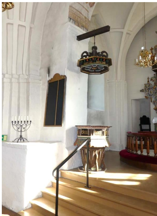
Vänster bild visar den del av långhuset som utgörs av det romanska tornet med senmedeltida valvslagning. Höger bild visar uppgången till koret genom triumfbågen med bevarad sockel och vederlag. Till vänster om triumfbågen finns ett bevarat sidoaltare.

Under 1800-talet flyttas ingången till kyrkan från det medeltida vapenhuset till tornets västra sida. Vapenhuset togs i bruk som ”materialbod”, eller förråd, och så småningom, år 1869, revs vapenhuset. Rivningsmaterialet återanvändes till att bygga upp en ny förrådsbyggnad strax väster om kyrkan, den nuvarande sockenstugan. Ett nytt fönster togs upp på platsen för den gamla sydportalen.