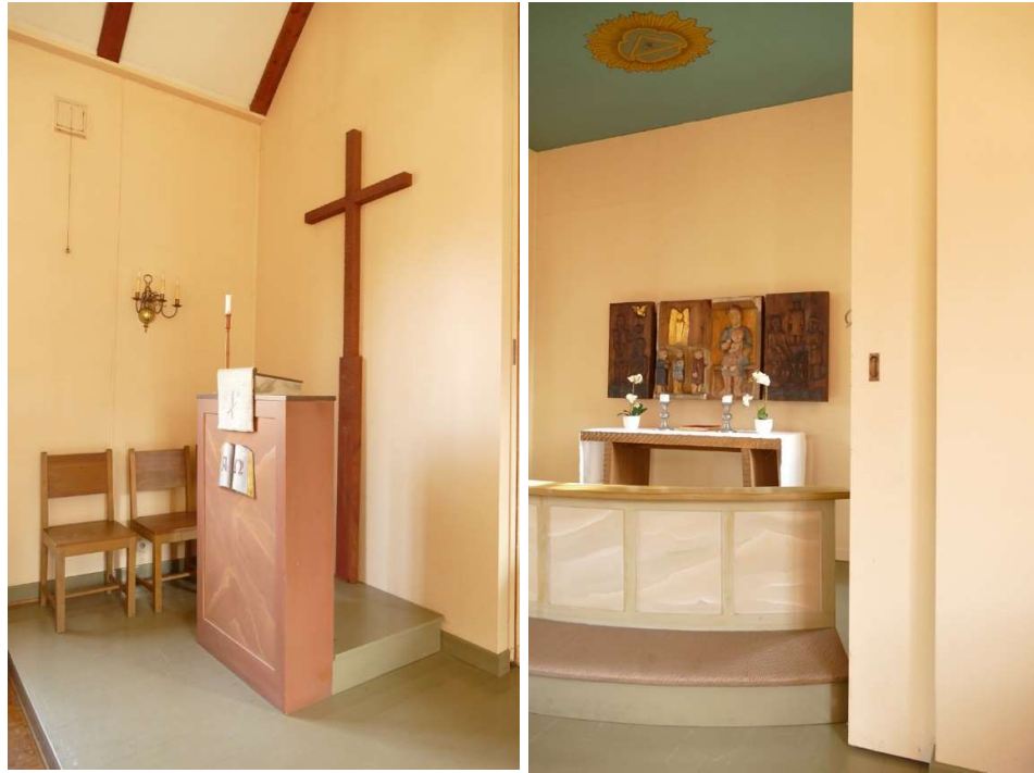
Predikstolen är enkelt och påminner mer om en ambo än en traditionell predikstol. Koret går att avskälja från kyrkorummets i övrigt med en utdragbar vägg. Detta är ett vanligt tillägg i 1900-talets kyrkorum som ofta byggdes med tanke på att kunna användas som samlingsal för andra syften.

I kortaket, finns en målning av det allseende ögat i gula kulörer. Söder om koret finns en psalmtavla och en dopfunt. Norr om koret står talarstolen och ett stort kors av trä är placerat på väggen. På ömse sidor sitter väggfasta, elektrifierade lampetter. Övrig belysning utgörs av en elektrifierad ljuskrona samt en lysrörsarmatur. Salen är traditionellt möblerad med flyttbara bänkar ordnade i två kvarter, ett på vardera sida om mittgången. Längst ner i kyrksalens södra hörn finns en orgel. Här finns också murstocken där tidigare en järnkamin varit belägen.