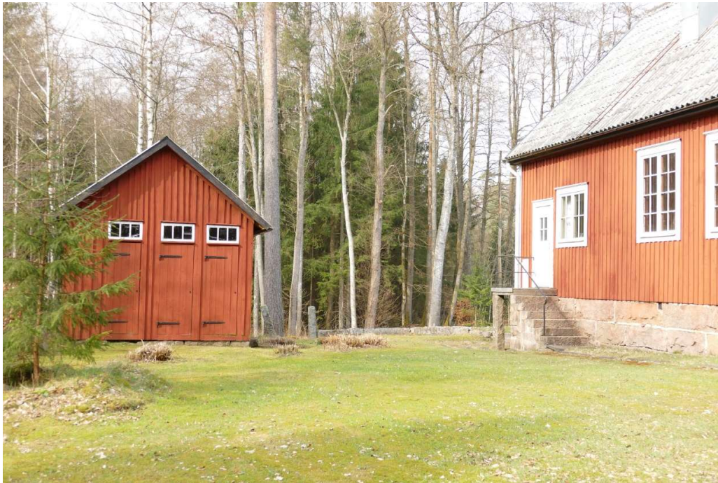
Kapellets baksida vetter åt söder. Här finns en köksingång och en ekonomibygnad som rymmer utedass och vedbod.