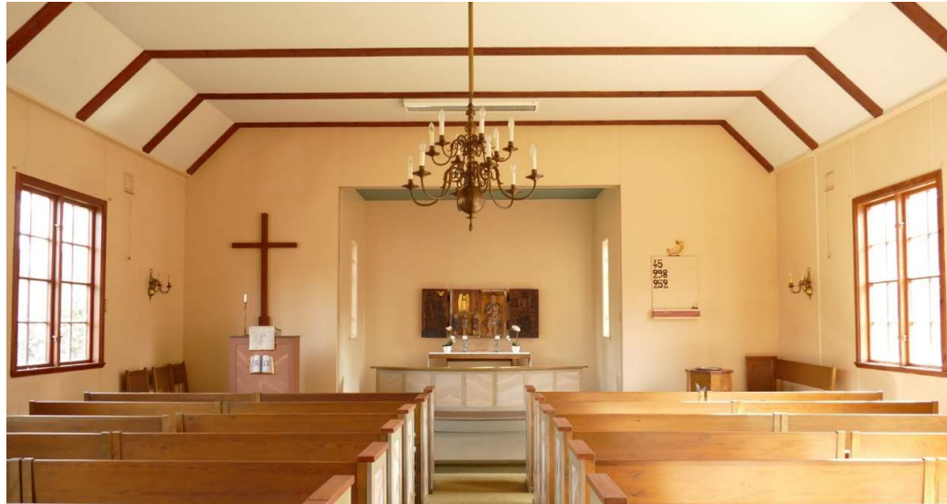
Utblick över kyrkorummet mot koret. Rummet är mycket välbevarat både vad beträffar möblering och färgsättning.