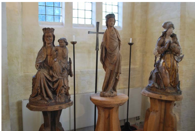
Träskulpturer från 1400-1500-talet.

Träskulpturer , två madonnor och en prinsessa från slutet av 1400-1500-talet.