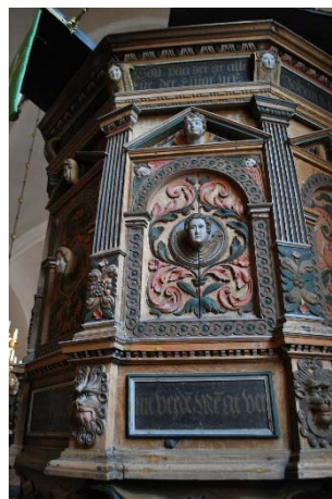
Detalj av predikstolen.