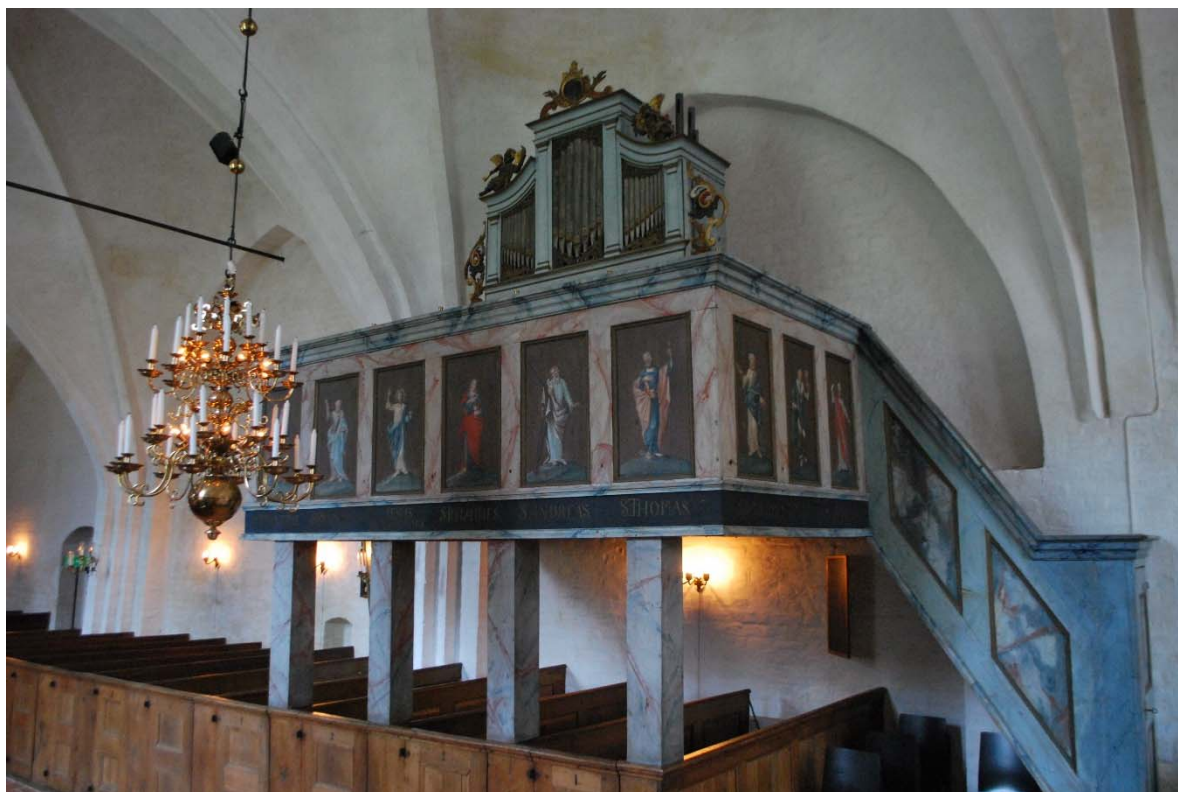
Orgelläktaren i norr med orgel från 1769.

Bänkinredningen är sluten och tillkom 1730. Vid renoveringen 1954 byggdes bänkarna om. Sitsarna nyttillverkades, ryggstöden vinklades och avståndet mellan bänkarna ökades. De kompletterades med fotstöd och psalmbokshylla. De främre bänkarna som är dubbelsidiga byggdes inte om utan har kvar sina smala sitsar. Dörrar, ryggar och framskärmar är uppbyggda med ramverk och fyllningar, medan sitsar och gavlar är hela brädor. Dörrarna har handsmidda gångjärn med lökformig avslutning. Gavlar och dörrar är av ek, resten av furu.