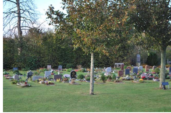
Urnlund på nya kyrkogården