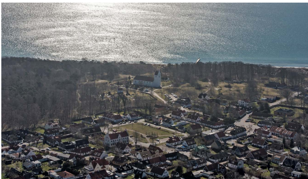
Från nordväst.

Falsterbo ligger på södra sidan och Skanör på norra sidan av den platta Falsterbohalvön omgiven av havet i sydvästra Skåne. Skanör och Falsterbos historia är delvis gemensam.