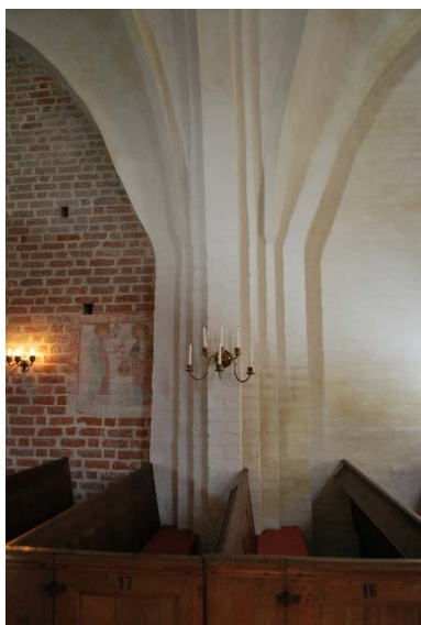
Kalkmålning och pilaster.

I koret står altarskåpet innanför altarringen. I det rymliga koret finns ytterligare ett altare med altarskåp, Kristofferskåp, dopfunt, klockarebänk, prästbänk, träskulpturer, ambo samt kororgel och flygel.