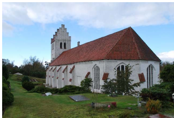
Fasad mot sydöst

Murarna är uppförda som skalmurar av rött stortegel med en kärna av gråsten. Murarna är spritputsade och vitkalkade. Fasaden på långhus och kor är indelad med strävpelare avtäckta med munk och nunnetegel i två nivåer. Murarna möter mark utan markerad sockel och avslutas uppåt med en takfotsgesims bestående av en sågtandsfris och utkragande skift. Koret har dessutom en gördelgesims. Flera igensatta äldre muröppningar är synliga i fasaden, bl.a. sydportalen och två spetsbågiga fönster på långhusets sydfasad. De är nu utförda som blinderingar.