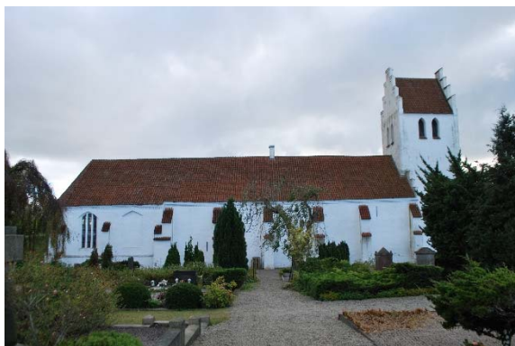
Fasad mot norr.

Kyrkan består av ett långhus med senare tillbyggt kor i öster och ett torn i väster. Koret som är något bredare än långhuset har en tresidig avslutning. Tornet är mindre och kvadratisk. Tornets murar avslutas med trappstegsgavlar liksom långhusets västgavel. Kyrkan är vitputsad och fasaden indelas med strävpelare. Fönstren sitter i spetsbågiga öppningar. Sadeltaget är belagt med röda munk/nunne-tegelpannor, vilka förnyades 1980.