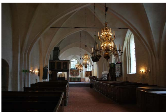
Långhuset mot koret i öster.