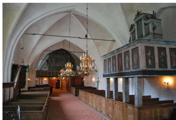
Långhuset mot väster.

På långhusets norra vägg står den gamla orgelläktaren från 1769, på södra sidan finns predikstolen. I väster finns orgelläktaren från 1925, ombyggd 1975. Den gamla orgelläktaren har en barriär av marmoreringsmålade ramverk med målade fyllningar av Jesus och lärjungarna. Den nya läktarbarriären i väster är en ramverkskonstruktion som är marmorerad i olika färger och vilar på marmorerade fyrkantiga stolpar.