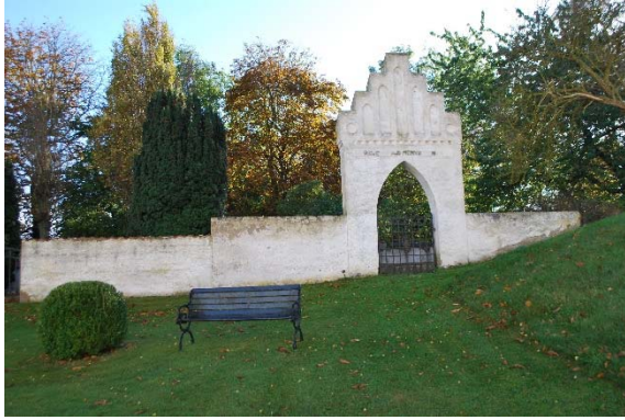
Gravplats bak mur i söder på gamla kyrkogården.