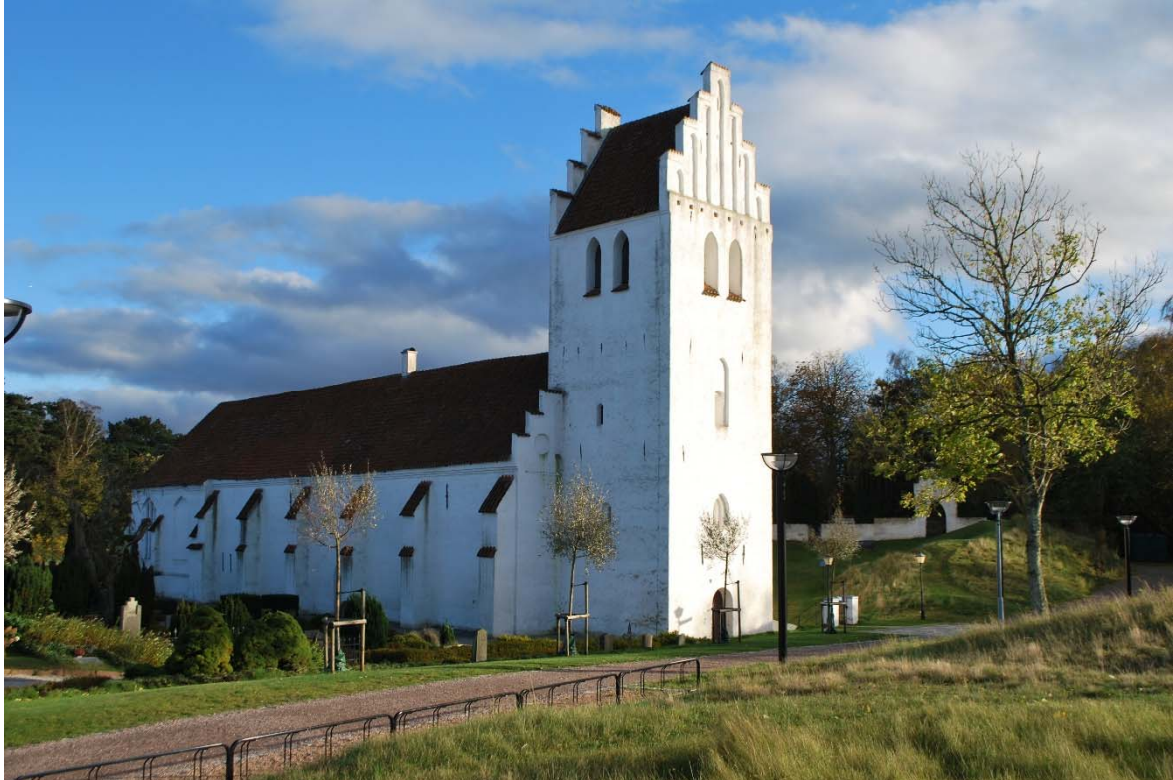
Fasad mot nordväst.