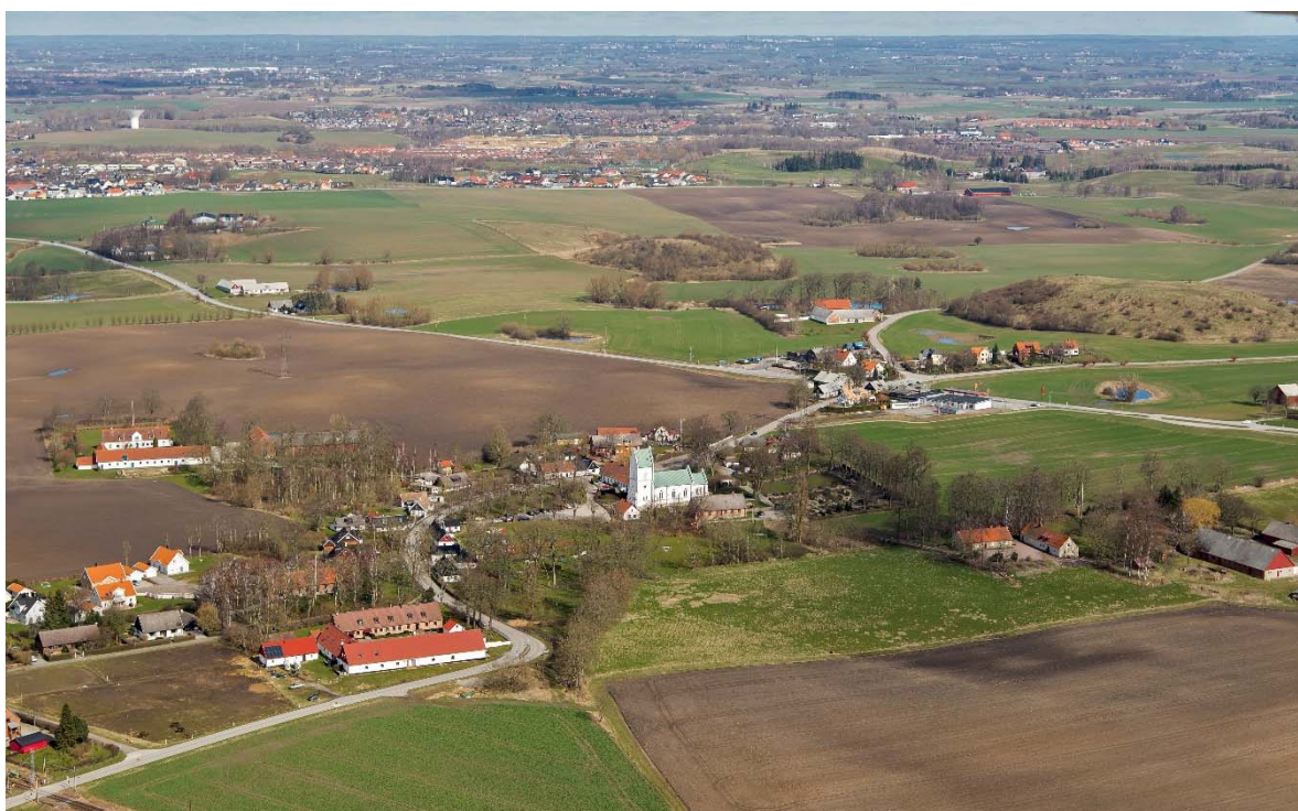
Från sydväst.

Arrie ligger på Söderslätt i sydvästra Skåne. Slättbygden har Sveriges bästa åkerjord. De goda förutsättningarna för odling gjorde området attraktivt redan under förhistorisk tid. Kring 1000-talet, efter befolkningsökning och förbättringar inom jordbruket, skedde en omfattande bybildning. Under 1100-talet bildades socknarna och flera romanska kyrkor byggdes i området. Socknarna var små och kyrkorna ligger tätt, vilket tyder på stor befolkning.