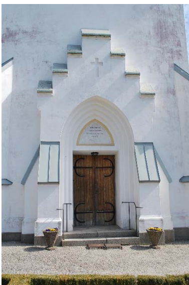
Portal i väster.