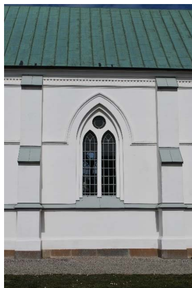
Fönster i långhuset

Kyrkan har två ingångar, huvudingång i tornet i väster och ingång till sakristian i öster. Huvudingången är en spetsbågig flersprångig perspektivportal. Den omges av ett utskjutande fasadparti med låga strävpelare och överst en trappgavel. Pardörren är klädd med pärlspontpanel av ek och har kraftiga smidda beslag. I tympanon står att kyrkan är byggd 1890. Östportalen är en mindre variant av västportalen.