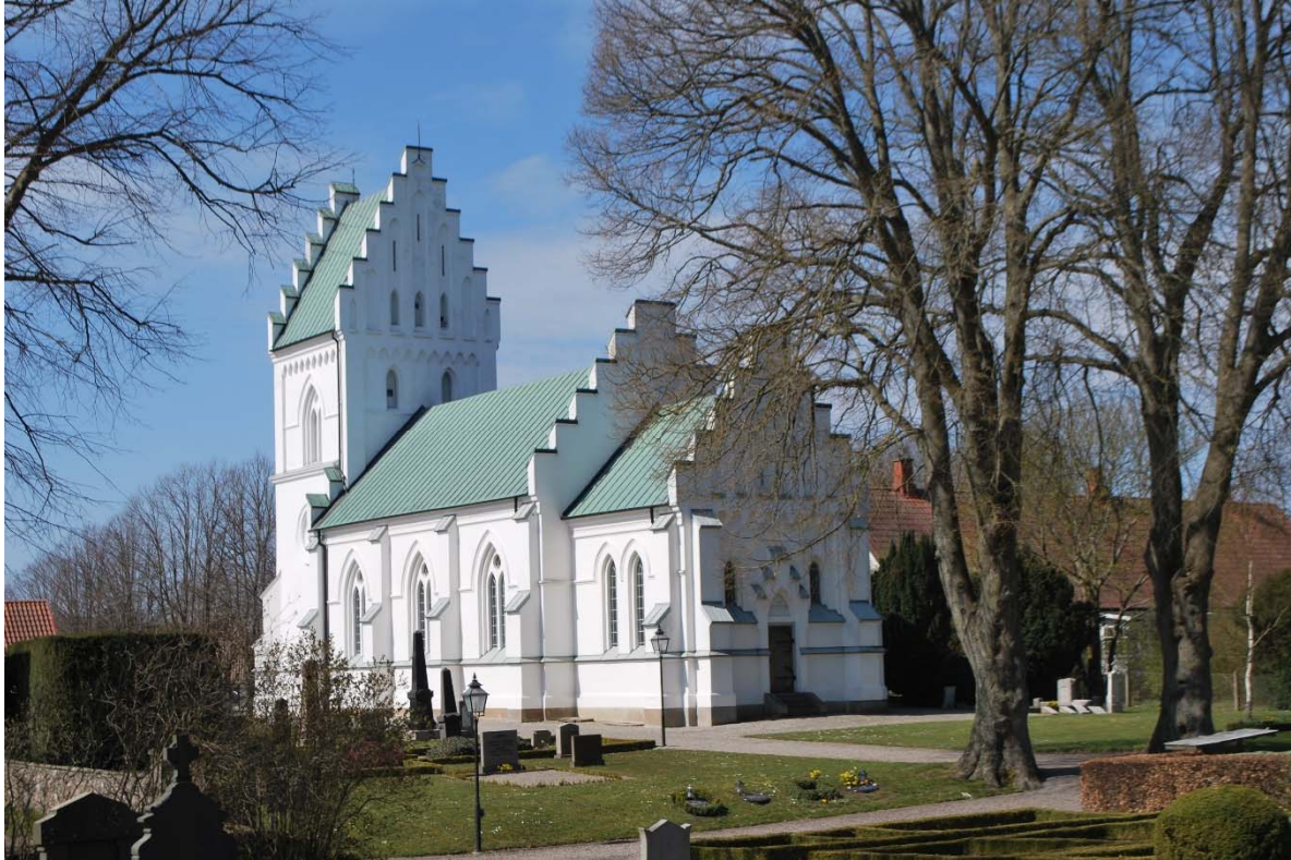
Fasad mot sydöst.