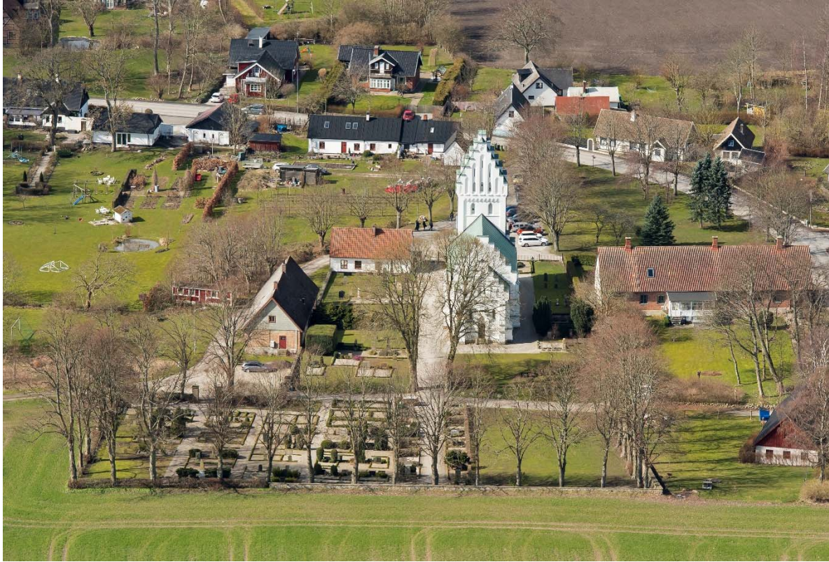
Från öster.