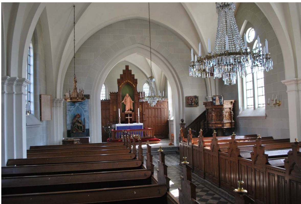
Långhuset mot koret i öster.

Väggarna är målade med imiterade kvaderstenar i olika gråbeige toner med vit fog. Golvet är belagt med cementmosaikplattor i svart och beige med diagonalt mönster. Längs bänkarna går en bård med löpande hund. Under bänkkvarteren ligger lackat furugolv. Predikstolen och ett digitalpiano står i sydöst. Dopfont och dopaltare med pietà-skulptur står i nordöst.