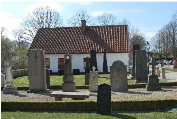
Kyrkogården söder om kyrkan.