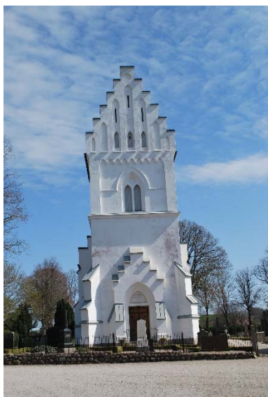
Fasad mot väster.

Tornet har två små spetsbågiga fönster i bottenvåningen, stora runda cementgjutna fönster i sexpassform på andra våningen samt spetsbågiga dubbla ljudöppningar med brädluckor i tre väderstreck i klockvåningen.