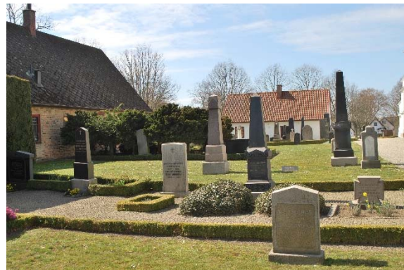
Skolhuset till vänster. Kyrkogården söder om kyrkan.

Flest gamla gravar finns söder om kyrkan. En del gravplatser är singelbelagda och är inramade av buxbom men flera står i gräs. Gravplatserna är oregelbundna och stora med flera stenar inom samma avgränsning. Här finns bland annat kalkstensvårdar från mitten av 1800-talet samt högresta obelisker och avbrutna kolonner i granit och diabas från sekelskiftet 1800/1900. Norr om kyrkan står gravstenarna mestadels i gräs. Här finns gjutna naturromantiska gravar som trädstammar och med bladkransar. Flera kyrkoherdar är begravda på norrsidan. Bland dem finns kyrkoherde Silander som var präst när kyrkan byggdes. Ett sorgligt öde är att tre av Silanders barn dog unga inom en vecka 1884. Kvinnliga titlar på gamla delen är mycket ovanligt men här vilar tvätterskan Bothilda Karlsson.