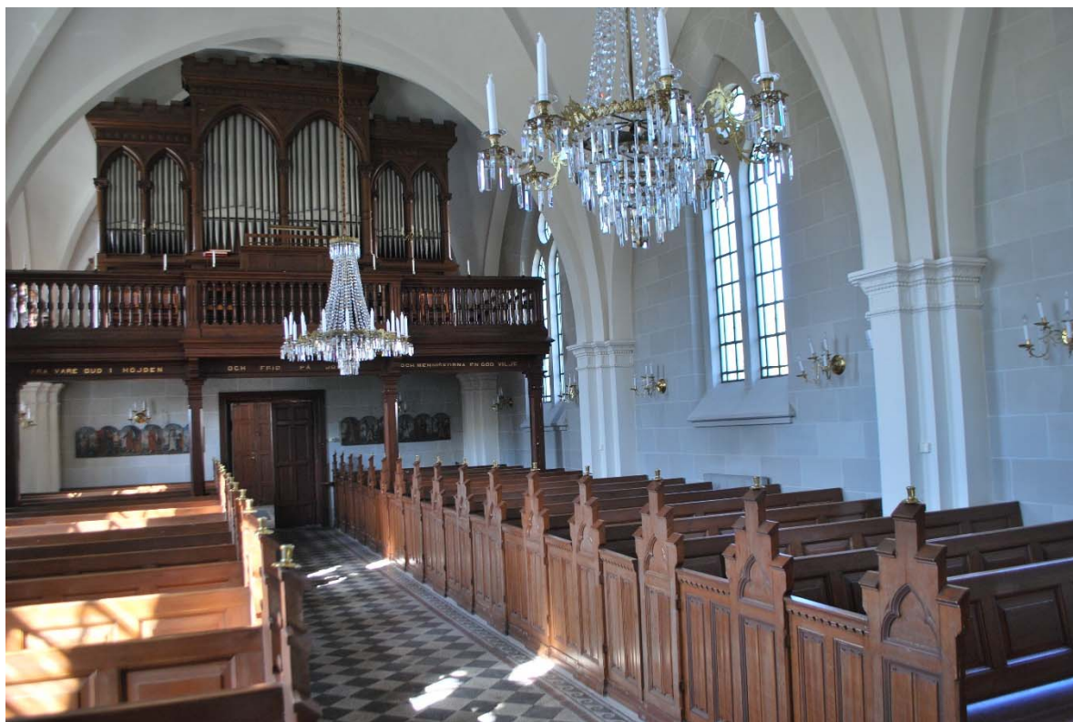
Långhuset mot orgelläktaren i väster.

Orgelläktaren med genombrutet räcke av ekådringsmålat trä bärs av fyra pelare med kapitäl och baser. Under läktaren hänger på väggen målningarna från 1700-talet tillhörande läktaren i den gamla kyrkan.