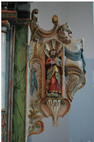
Detalj av altaruppsatsen.