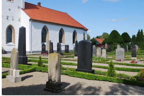
Kyrkogården söder om kyrkan.