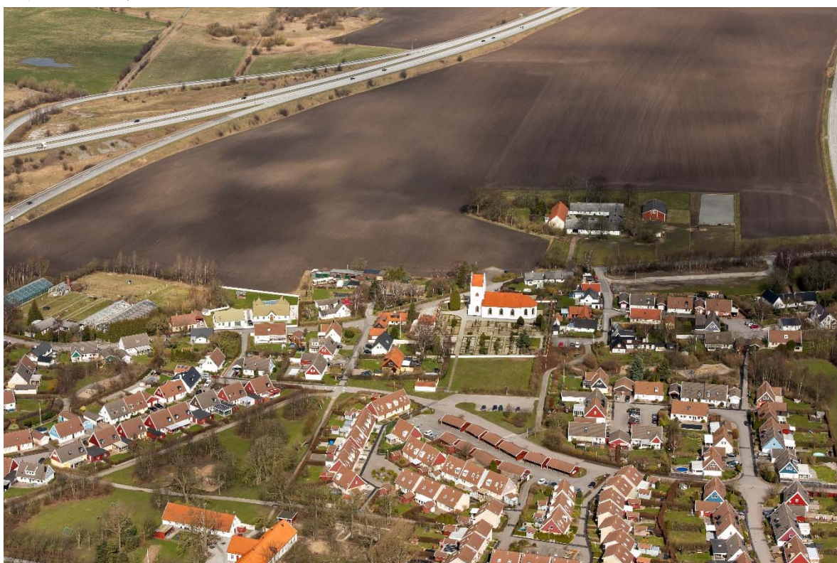
Från söder.

Eskilstorp ligger på Söderslätt i sydvästra Skåne, söder om Malmö. Idag har Eskilstorps kyrkby växt ihop med Vellinge samhälle.