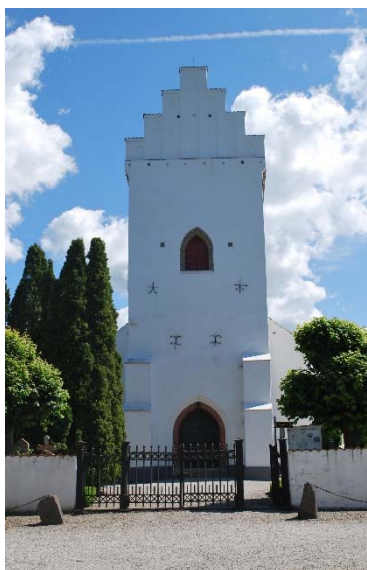
Tornet mot väster.

Kyrkan har sadeltak på torn och långhus, koret har ett femdelat tak. Samtliga tak är belagda med enkupigt rött taktegel lagt 1936. Även tornets trappstegstinnar är avtäckta med tegel.