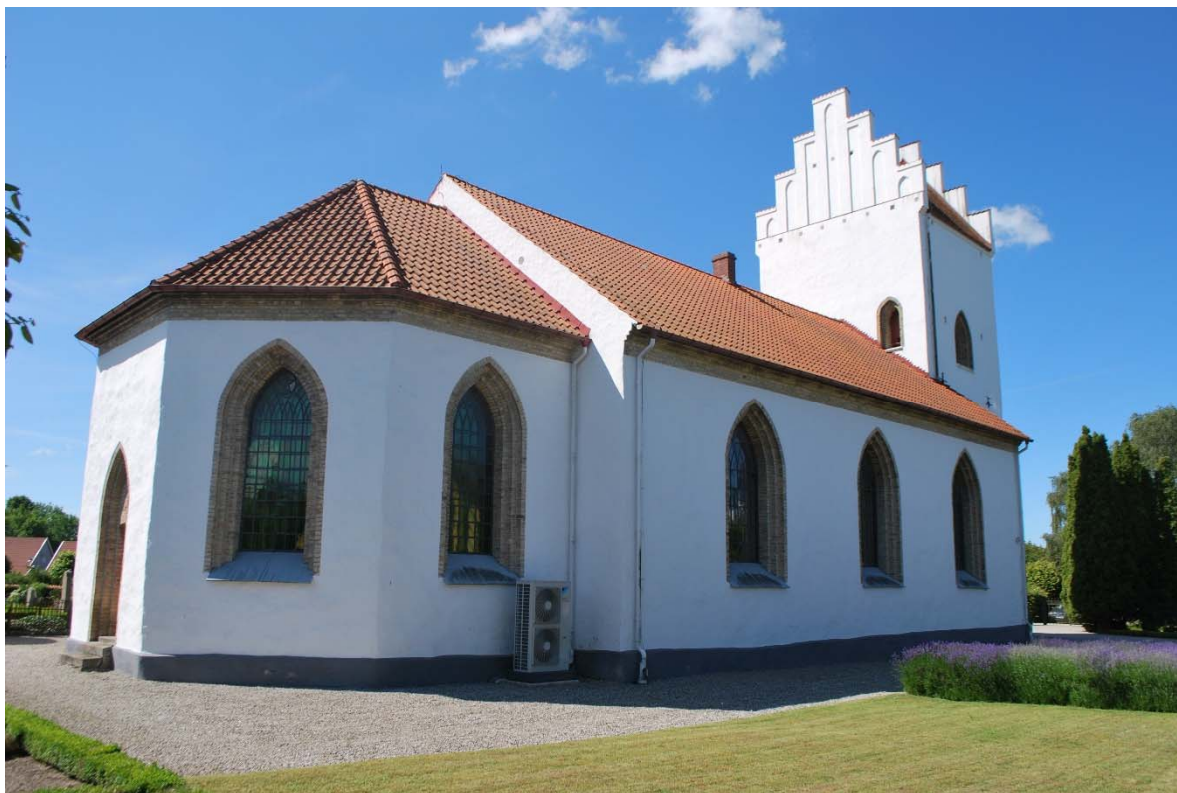
Fasad mot nordöst.

Kyrkans fönsteröppningar är spetsbågiga och omfattas av oputsat gult handslaget tegel med två språng. Fönstren är från 1874. Gjutjärnsbågarna är svartmålade och indelade i rektanglar och överst bågar och en cirkel med inskriven femuddig stjärna. Fönstren är glasade med klarglas i långhuset och rosa och grönfärgat glas i koret. Solbänkarna har gråmålade räfflade gjutjärnsplåtar. I tornet finns flera äldre igensatta muröppningar dolda under putsen.