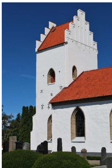
Tornet mot sydöst.