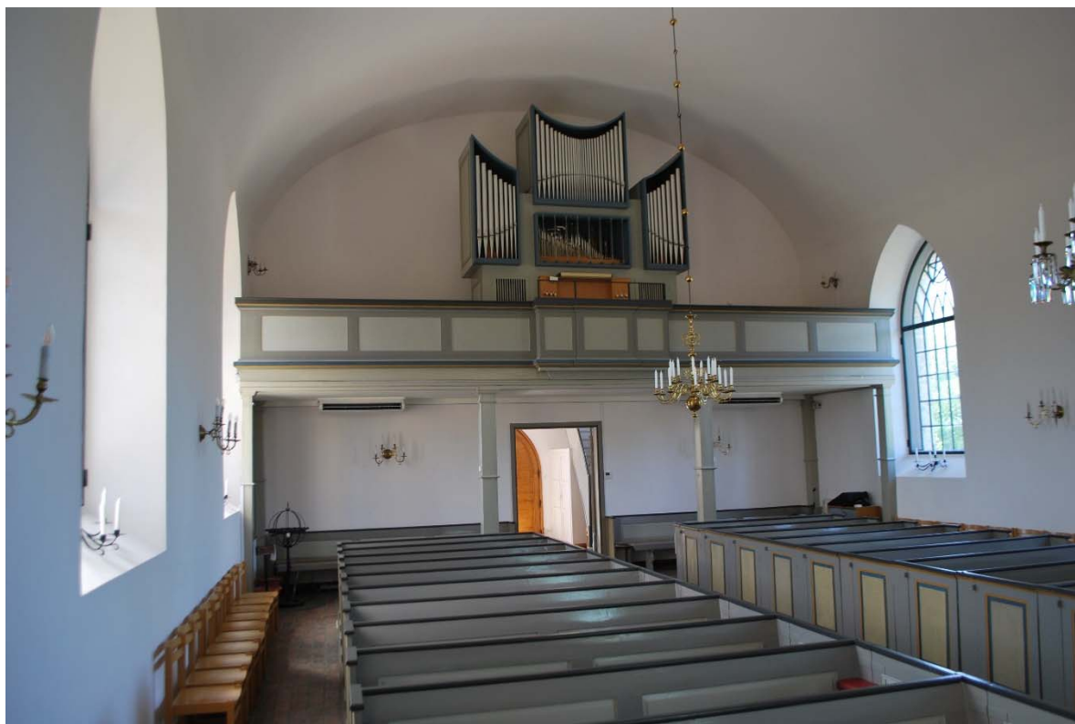
Långhuset mot orgelläktaren i väster.

mot taklaget. Klockbocken är av ek och fur och bär två klockor från 1700-talet. Eken är återanvänd med flera äldre urtagningar. På plan två förvaras den gamla orgelns pipor och fasad. Vinden nås genom en lucka från klockvåningen. Taklaget av furubrädor är från 1936. Valvet är isolerat med mineralull.