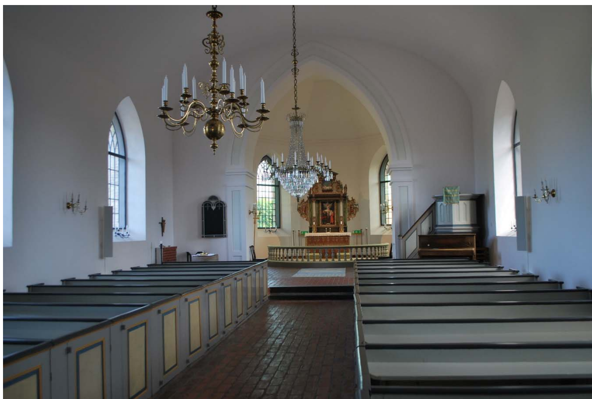
Långhuset mot koret i öster.

Koret utökades 1998 och går numera en bit in i långhuset. Det nya tegelgolvet skiljer sig i färg från tidigare tegel. En trappa i mitten med två steg av svart natursten leder till koret. Triumfbågen mellan långhus och kor är spetsbågig och markeras med en utskjutande, bred list runt muröppningen. Valvanfängen markeras med utkragade tegelskift. Koret är välvt med ett femkappigt valv med ett plant mittparti. Mellan valv och vägg löper en profilerad list. De fyra korfönstren är försedda med tonat glas. Koret upptas av altaruppsatsen och altarringen. Innanför altarringen ligger brädgolv täckt med en vävd matta.