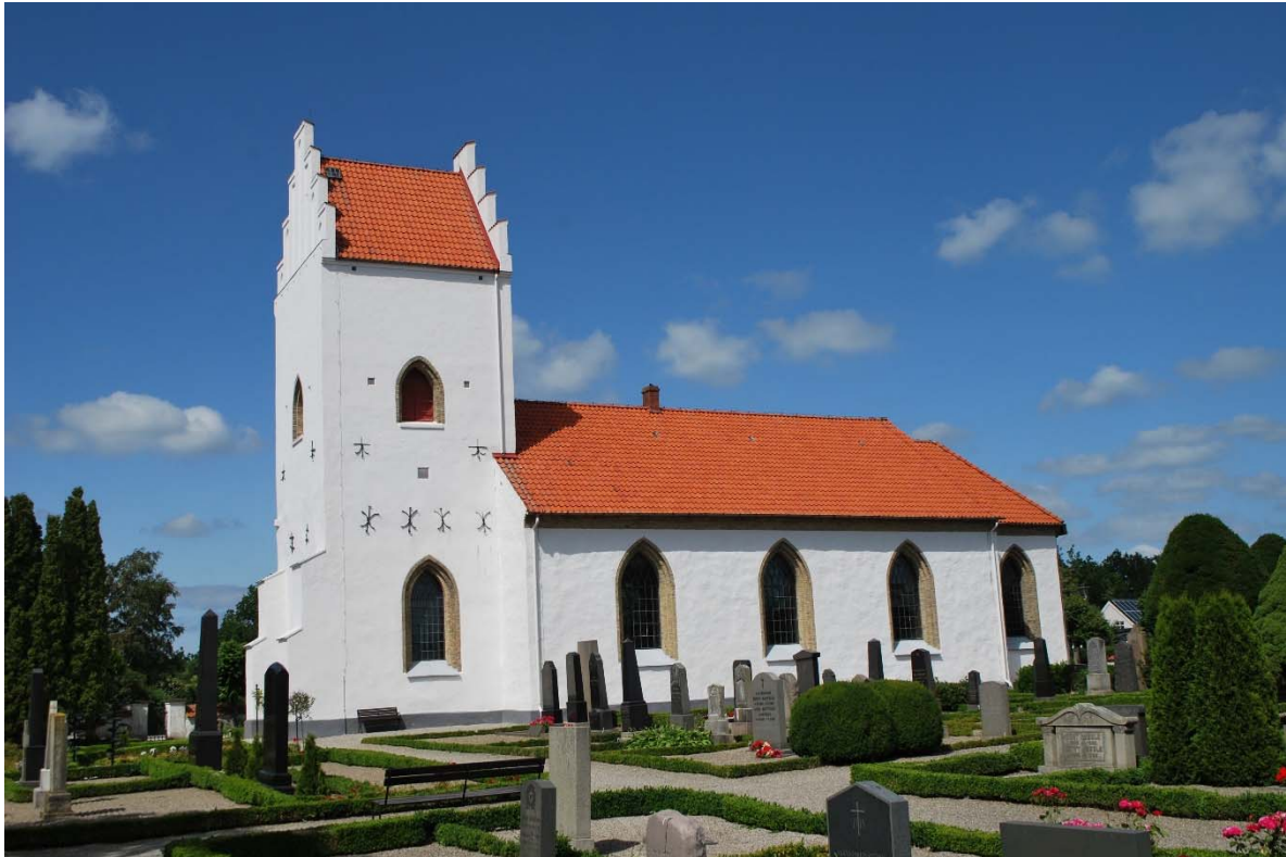
Fasad mot sydväst.