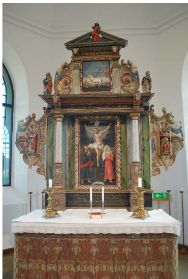
Altaruppsatsen i koret.

Predikstolen av målat trä från 1874. Sidor av ramverk och spetsbågiga fyllningar. Listverk i ovan- och nederkant. Grågrön med detaljer i gult och blått.