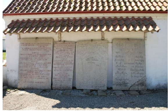
Kalkstenshällar mot spruthuset på gamla kyrkogården.