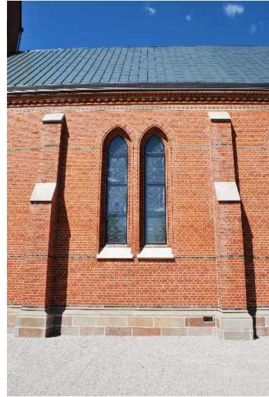
Fönster i långhuset mot söder.

Tornet har en åttkantig spira, långhus och sakristia har sadeltak. Kyrkans samtliga tak är täckta med mörkgrå målad aluminiumplåt i falsad skivtäckning. Taket förnyades 2003. Tornspiran kröns av kompassros och kyrktupp. Takavvattningen består av fotrännor och stuprör av svartmålad plåt.