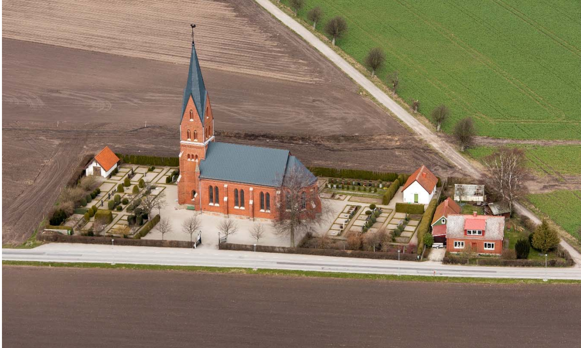
Från söder. Fotot taget före den nya vägen anlades 2016 norr om kyrkan.