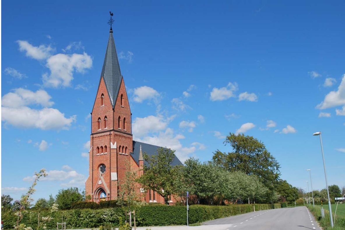
Fasad mot sydväst.