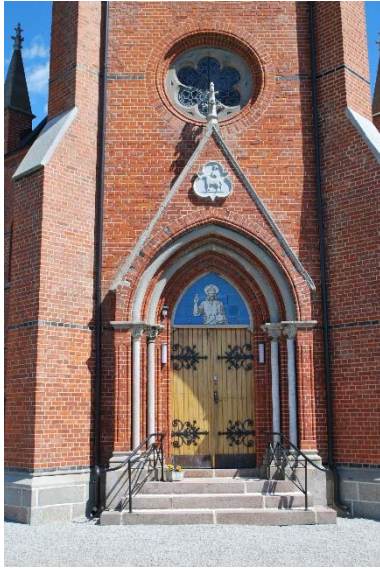
Portal i väster.

I öster finns en ingång till sakristian. Portalen är spetsbågig och omges av profiltegel med rundstav. Enkeldörren har panel och dekorativa gångjärn lika huvudingången. Dessutom finns en ingång till torntrappan i en spetsbågig öppning. Dörren är klädd med skivmaterial. Eventuellt tillkom denna öppning 1948.