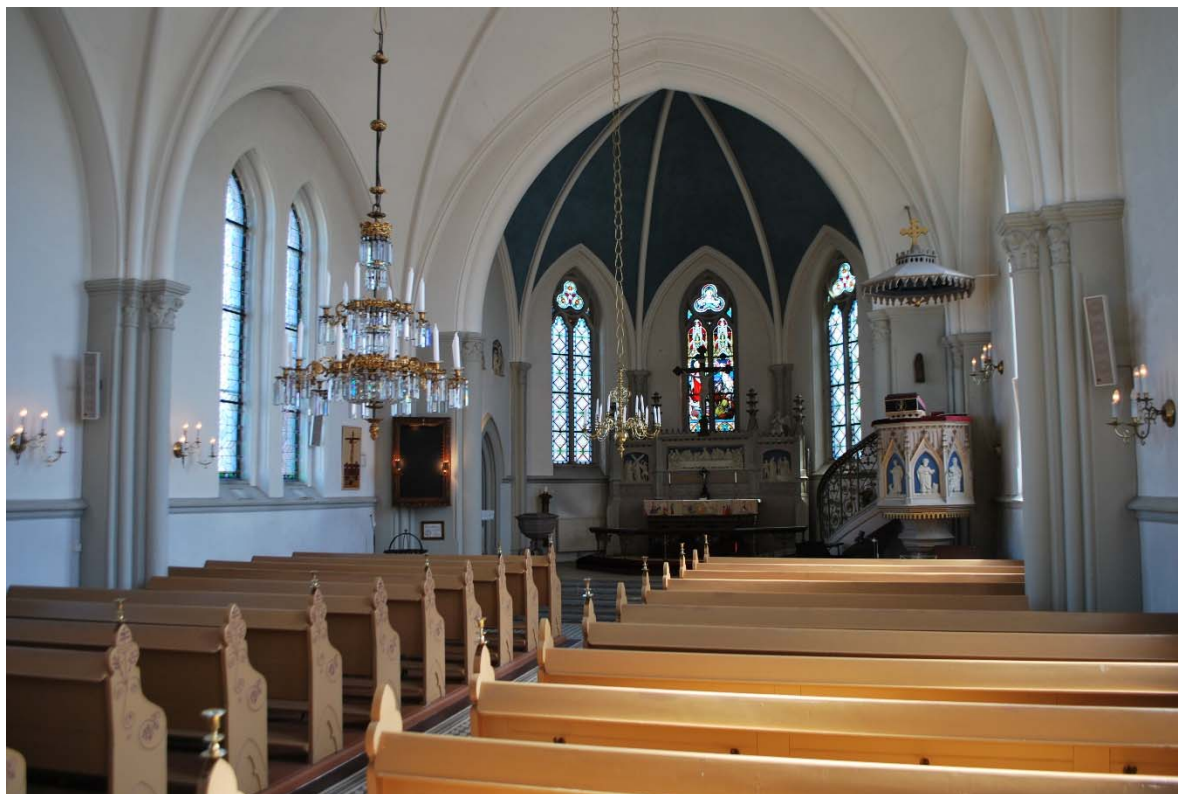
Långhuset mot koret i öster.

sexkantiga plattor. De har mönster med vita, ljusgrå och mörkgrå romber som bildar ett optiskt mönster. Under bänkarna ligger målat brädgolv. Väggar och valv är putsade och vitkalkade. Fönsterfallen är grå med en gördelgesims i nederkant som löper runt väggarna.