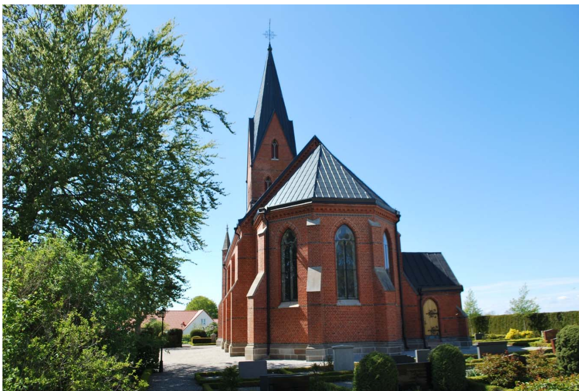
Fasad mot öster.

Kyrkans fönster är mestadels spetsbågiga och har en omfattning av formtegel som bildar rundstavar. I långhuset sitter fönstren parvis. Det dekorativt målade glaset är blyspröjsat och förstärkt med horisontella stormjärn av plattjärn. Korets fönster har masverk gjuten i cement med trepassformer. Fönstren är även här blyspröjsat med dekorativt glasmåleri, det mittersta med figurativt måleri. Fönstren har 2017 försetts med ytterbågar av svart aluminium med tre horisontella delningar. Solbänkarna är klädda med kalksten. Tornet har ett runt fönster med cementgjutet sexpass med blyspröjsat glasmåleri. Ljudöppningar i två nivåer finns i tornet åt tre väderstreck. Öppningarna omges liksom fönstren av profiltegel. Varje öppning delas av en cementgjuten kolonnett med ett ovanförliggande masverk med trepass. Brädluckorna är på utsidan klädda med rödmålad pärlspontpanel.