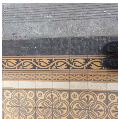
Golv i koret.