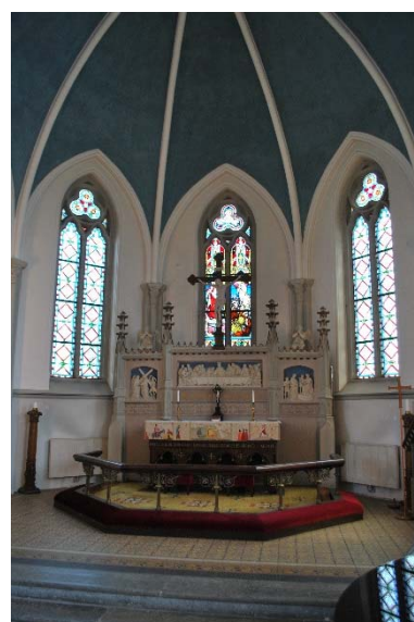
Altaruppsatsen i koret.

Bänkinredningen tillkom 1888 när kyrkan byggdes. Bänkarna var tänkta utan dörrar men fick på kyrkorådets uppmaning dörrar vilka nu är borttagna. De höga gavlarna är dekorerade med infrästa bladornament och avslutas med en trepassform. Målad i ljust gulbrunt, tidigare målad i mörk ekådring.