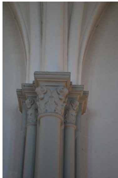
Kolonner med gjutna kapital.

Koret är upphöjt tre steg, belagda med kalksten med inhuggna räfflor. Korgolvet är täckt av keramikplattor från Villeroy & Boch. Plattorna är mönstrade i gult och grått med liljor och fyrpassformer. Utanför dessa finns tre bårder med olika mönster. Taket är kryssvälvt med sex kappor. Kapporna är målade mörkt blå medan valvribborna är vita. Pilastrarna är lika de i långhuset. I koret står altaruppsatsen mot östväggen innanför altarringen. Dopfunten av sten står på norra sidan. Det femkantiga koret har fyra fönster med masverk av cement med blyinfattade målade glas. Mittfönstret har en figurativ målning av Uppståndelsen. Nedanför Jesus syns förskräckta väktare. De övriga fönstren i koret har mönster av druvblad omgivna av kvadrater. Samtliga fönster är tillverkade av Königl. Bayerische Hofglasmalerei F.X Zettler München. Denna märkning finns på vissa fönster. Frans Xaver Zettler (1841-1916) var glasmålare som grundade verkstaden som fick världsrykte. Glasmålningar av Zettler finns bland annat även i Johannes kyrka och Tyska kyrkan i Stockholm samt i Fuglie och Tygelsjö kyrkor i Malmö pastorat.