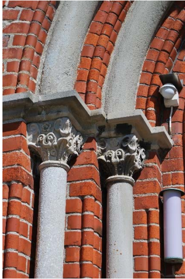
Kapitel på västportal.