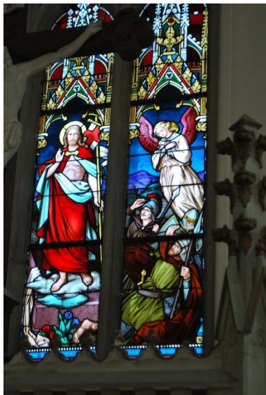
Glasmålning i koret, Uppståndelsen.

De höga smala fönstren har blyspröjsade glasmålningar i form av ett blommönster längs kanterna och svagt färgat glas i mitten. Fönsteröppningarna omges av formtegel liksom dörröppningarna.