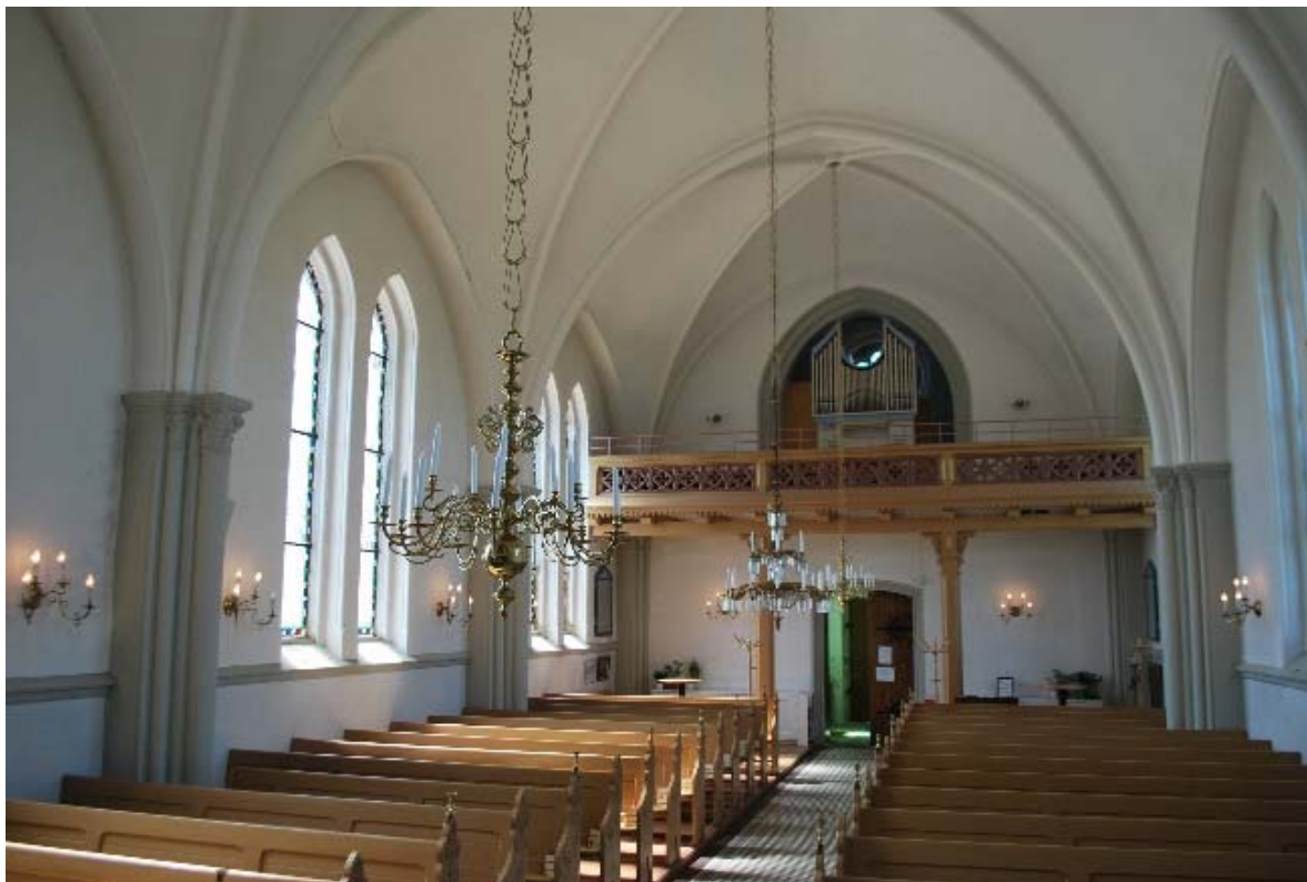
Långhuset mot orgelläktaren i väster.

Tornets övre våningar nås från vapenhuset. Klockvåningen på fjärde våningen har brädgolv och putsade väggar. Ljudluckor i två våningar finns i alla väderstreck. Det är öppet upp mot torntoppen. Klockbocken av ek bär två klockor. Valven på vinden över långhuset är isolerade med mineralull.