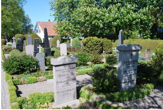
Gamla kyrkogården norra sidan.