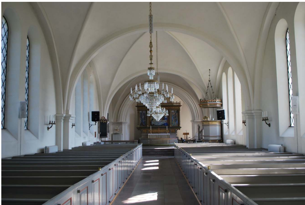
Långhuset mot koret i öster.

Den lilla sakristian inryms bakom altaruppsatsen i den rundade absiden. Ett vindfång med klädska vid sidorna finns framför östutgången. Vindfånget är uppbyggt av ramverk och fyllningar och med en profilerad krönlist med tandsnittsfris. Absiden är täckt med ett trekappigt valv med ribbor som vilar på konsoler på väggen. Väggar och valv är vitputsade. Golvet är belagt med brädor i mitten och med kalksten längs väggarna. Böjda träbänkar följer absidens rundade form.