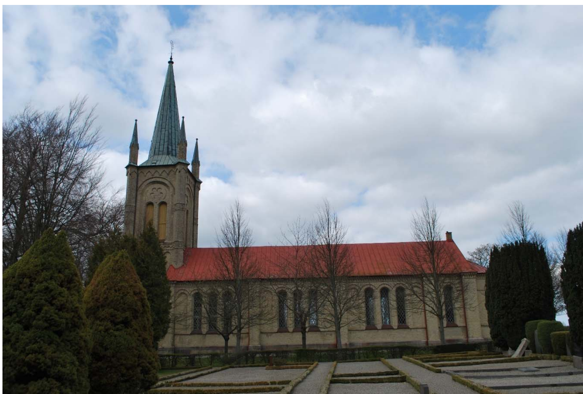
Fasad mot söder.

I tornet finns ett fyrpassfönster med gjutjärnsbåge och färgat glas. Tornet har även rundbågiga dubbla ljudöppningar med brädluckor i fyra väderstreck. Ljudöppningarna sitter inom en rundbågig nisch med en blindering av fempass ovanför.