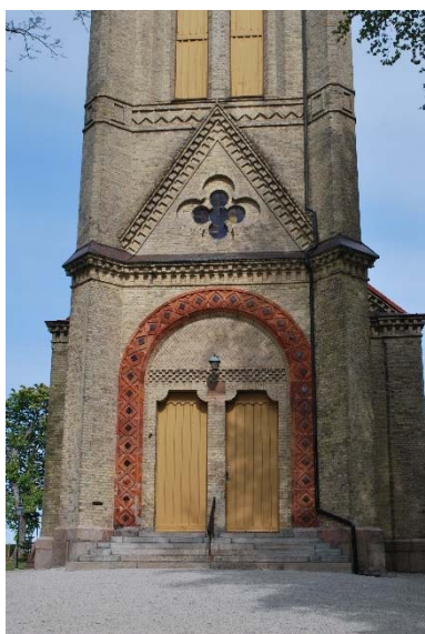
Portal mot väster.

Långhuset har sadeltak och tornet en åttkantig spira med fyra små hörntorn. Långhus- och absidtak är täckta med rödmålade järnplåt i skivtäckning. Tornets spira är täckt med kopparplåt i skivtäckning. Takavvattningen och takplåtar är av koppar på tornet medan den är av rödmålade plåt på långhus och absid.