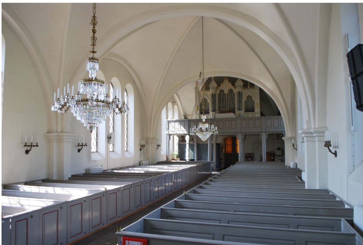
Långhuset mot orgelläktaren i väster.

Tornets övre våningar nås från vapenhuset. Klockvåningen har brädgolv, putsade vitmålade väggar och öppet upp till tornspiran. Klockstolen av ek bär två klockor. Dubbla ljudluckor finns i alla väderstreck. Vinden över långhuset nås från andra våningen. Taklaget har sparrar, hanband, snedsträvor och saxsparrar. Valven är isolerade med mineralull.