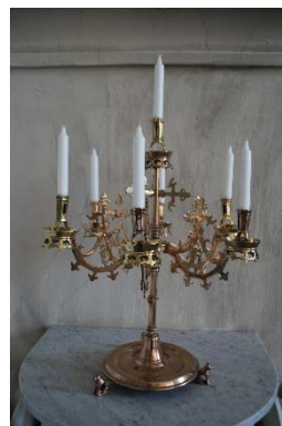
Altarpuppensats av Wåhlin och målningar av Törneman.