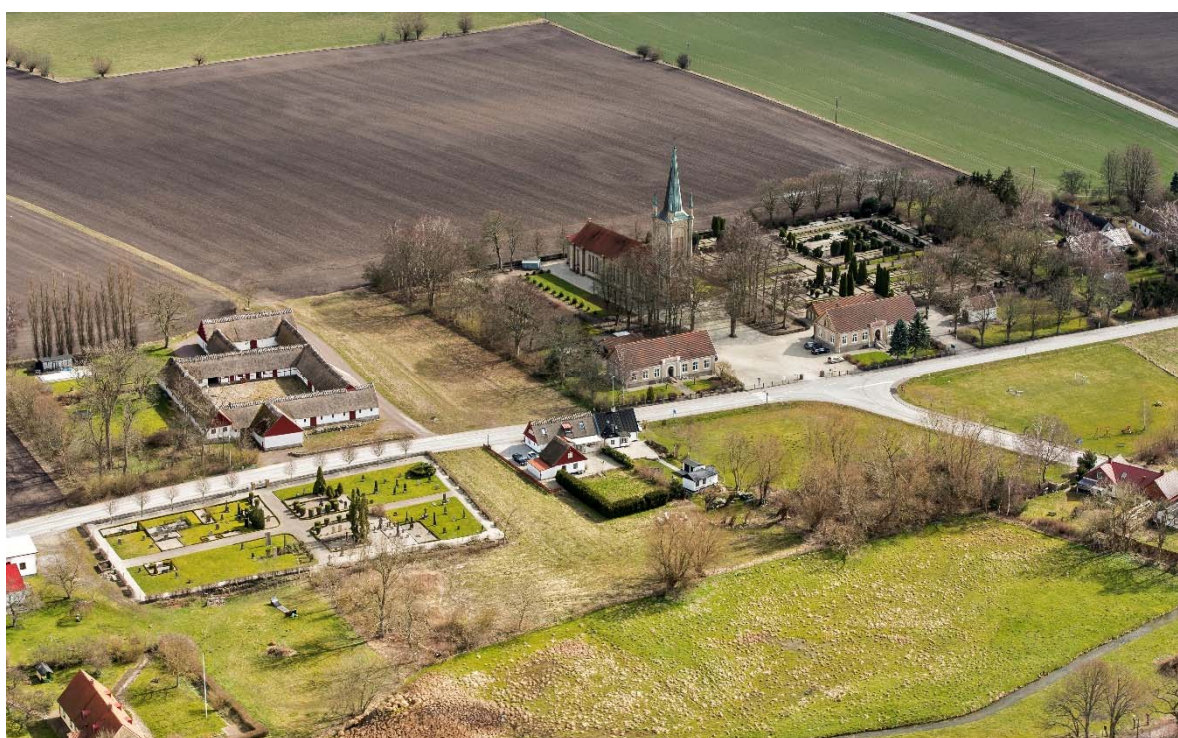
Från nordväst.

Hököpinge ligger på Söderslätt i sydvästra Skåne, söder om Malmö. Söderslätt är området söder och väster om gamla landsvägen mellan Malmö och Ystad. Slättbygden har Sveriges bästa åkerjord. De goda förutsättningarna för odling gjorde redan under förhistorisk tid området attraktivt. Kring 1000-talet, efter befolkningsökning och förbättringar inom jordbruket, skedde en omfattande bybildning. Under 1100-talet bildades socknarna och flera romanska kyrkor byggdes i området. Socknarna var små och kyrkorna ligger tätt, vilket tyder på stor befolkning och bördig jord. Hököpinge är skriftligt belagt från 1300-talet. Förledet är förmodligen höj och syftar på en höjd eller de bronsåldershögar som finns i närheten. -köpinge betecknar en by som varit en gammal handelsplats. Ofta var de belägen intill ett vattendrag som i äldre tider troligen varit segelbart. Ett arkeologiskt fynd bekräftar tidig internationell