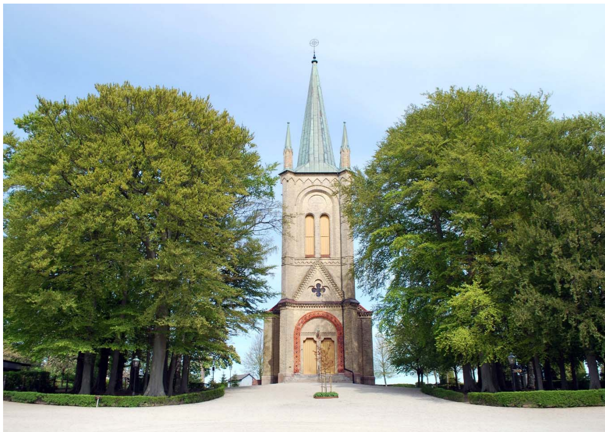
Fasad mot väster.