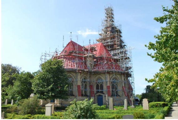
Fasad från nordöst under kyrkans senaste renovering.