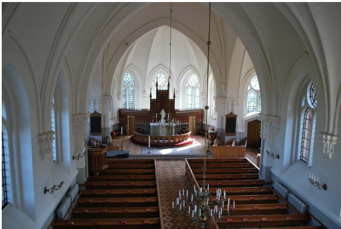
Långhuset mot koret i öster från orgelläktaren.