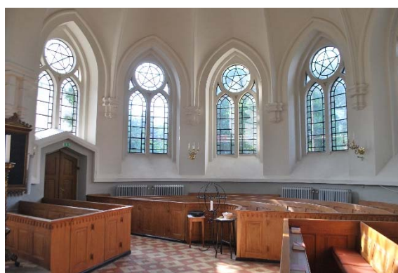
Södra korsarmen med rundade bänkar.