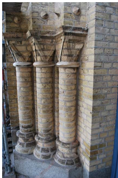
Del av portalen i väster