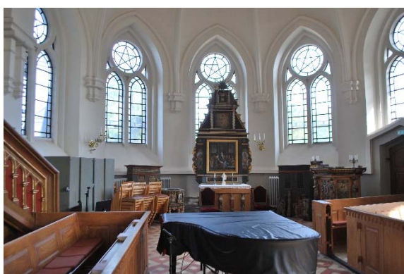
Norra korsarmen med äldre inventarier.

Ovan västingången inryms orgelläktaren i tornets andra våning. Orgelfasaden är delad så att ljus kommer in från det stora runda västfönstret. Långhusets vägg mot väster har listverk och är målad med dekorationer av ramverk. Utgången till vapenhuset omges av en flersprångig spetsbågig pespektivportal.