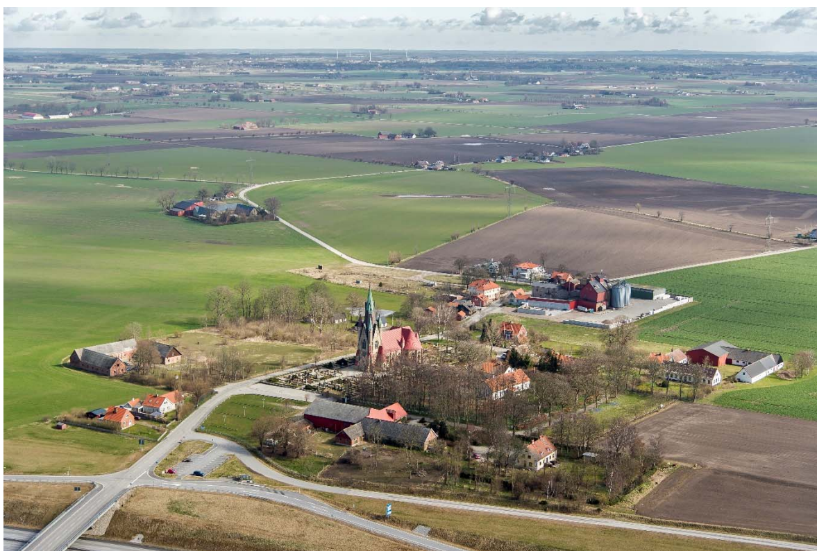
Från sydväst.

Håslövs socken ligger på Söderslätt i sydvästra Skåne. I socknen finns byn Norra Håslöv och kyrkbyn Södra Håslöv. Slättbygden har Sveriges bästa åkerjord. De goda förutsättningarna för odling gjorde redan under förhistorisk tid området attraktivt, vilket fornlämningar visar. Kring 1000-talet, efter befolkningsökning och förbättringar inom jordbruket, skedde en omfattande bybildning. Under 1100-talet bildades socknarna och flera romanska kyrkor byggdes i området, ibland ersatte de en träkyrka. Socknarna var små och kyrkorna ligger tätt, vilket tyder på stor befolkning. I bykärnan låg gårdarna samlade omgivna av odlingsmark indelad i en mängd smala tegar. Denna struktur behölls fram till enskiftet i början av 1800-talet som