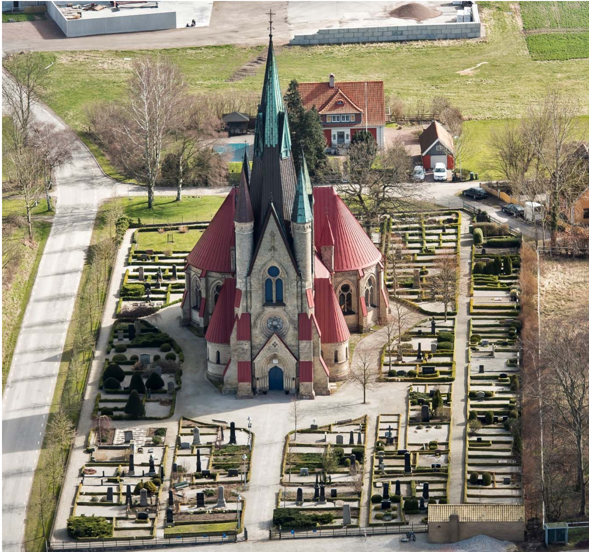
Från väster.