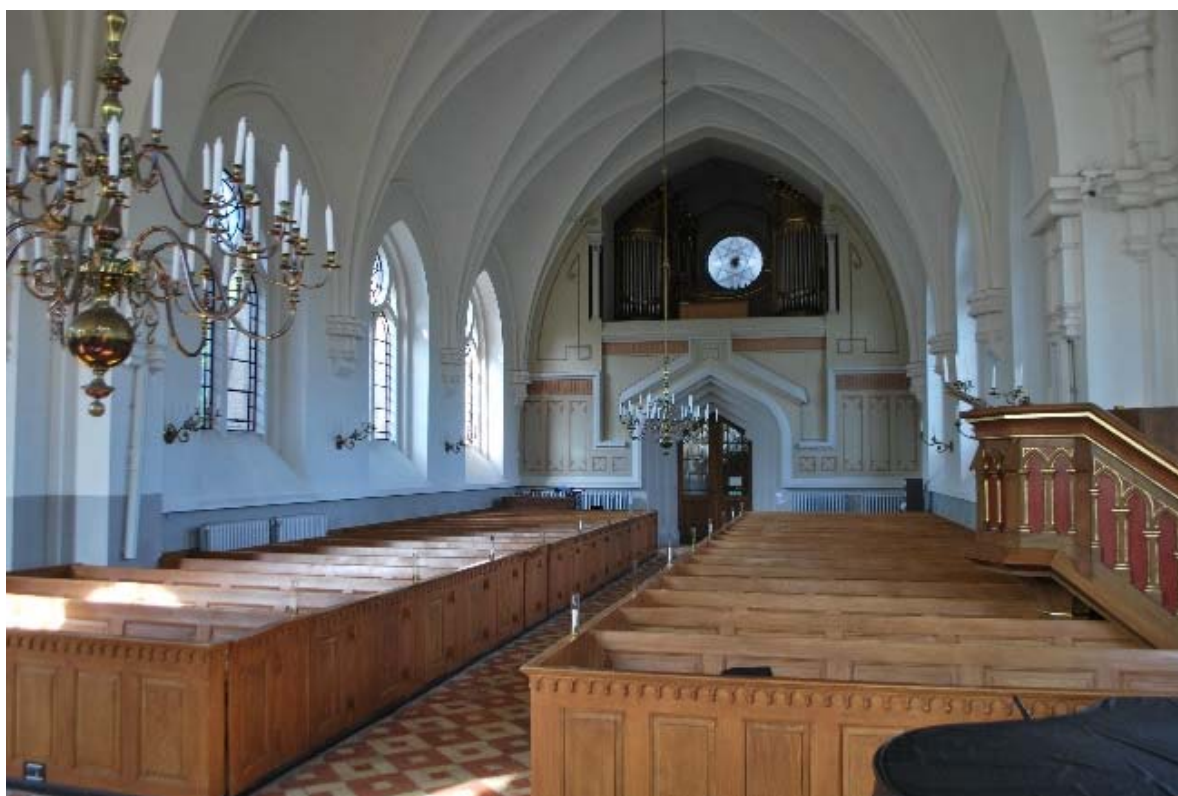
Långhuset mot orgelläktaren i väster.

Kyrkorummet är ljust med stora högsittande svarta gjutjärnsfönster med klarglas. På golvet i hela kyrkan ligger tegelgolv i rött och gult i mönsterläggning lika den i vapenhuset. Under bänkkvarteren ligger brädgolv. Väggar och valv är putsade och vitmålade med en ljusgrå bröstning under de kraftigt sluttande fönsterbänkarna. Långhuset har tre travéer med spetsbågiga kryssribbvalv. Ribborna av profiltegel vilar på konsoler med kapitäl på väggen, liksom sköld- och gördelbågarnas halvrunda ribbor. Korsmittens valv är högre än övriga valv och ribborna avslutas med en cirkelform i valvhjässan. Två mässingsljuskronor hänger i långhuset och korsmitt. De båda korsarmarna och koret är välvda med femkappiga ribbvalv. Valvkapporna är vinklade och inte rundade som i övriga valv. Ribborna vilar på konsoler med kapitäl på väggarna. Korsarmar och kor har vardera fem stora fönster. I norra korsarmen står 1600-1700-tals inventarier från den gamla kyrkan; predikstol, altarpopsatser, dopfunt, baldakiner samt förråd för stolar och podier.