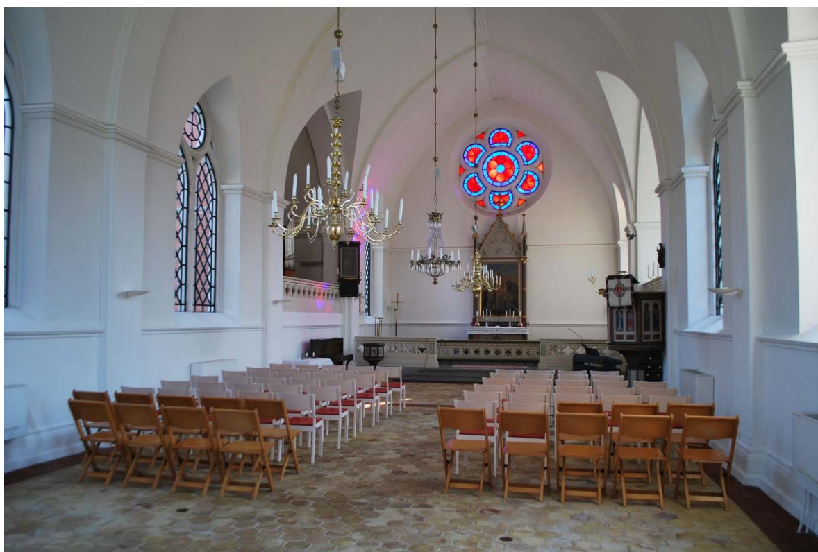
Långhuset mot koret i öster.

I nordöst står dopfunten av trä och ett piano, i sydöst finns predikstolen och ett digitalpiano.