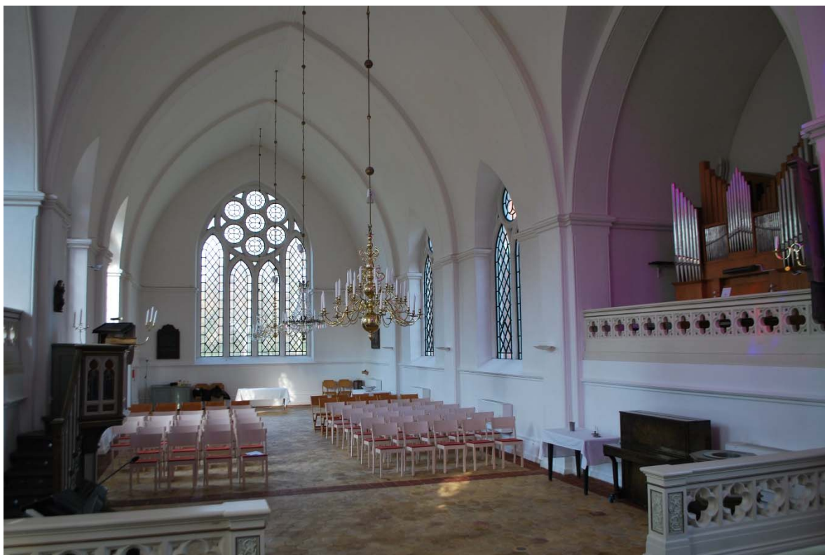
Långhuset mot nordväst.