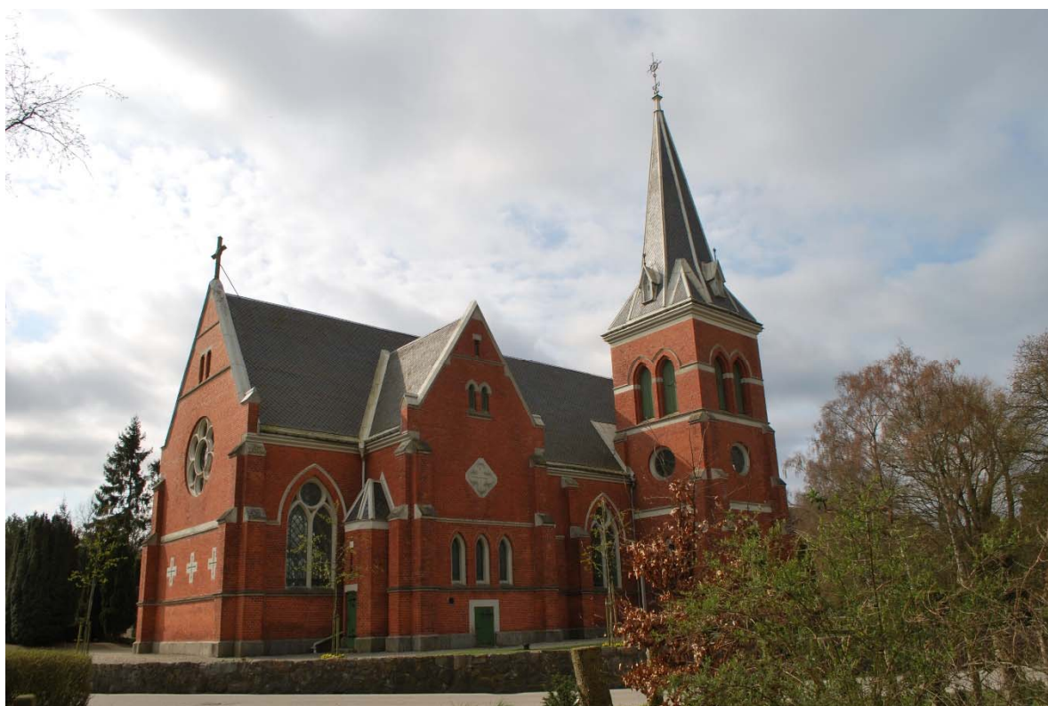
Fasad mot nordöst.

Kyrkans fasadmurar är uppförda av rött maskinslaget tegel, förbländertegel. Alla stenar har kopsidan vänd utåt med en halv stens förskjutning. Fasadteglet bakmurades med enklare murtegel. Kyrkans sockel är av granit med snedfasad ovankant. Fasaden indelas mellan fönstren av strävpelare som är avtrappade uppåt och avtäckta med cementplattor. I de röda tegelmurarna finns horisontella gesimser, i fönstrens nederkant och vid övre delen av fönstren. Den senare markerar även fönstrens spetsbågiga form. Tornet har ytterligare två gesimser över och under ljudluckorna. En kraftig profilerad takgesims av cement löper runt kyrkan. Mot öster finns tre kors av cement infällda i tegelmuren.