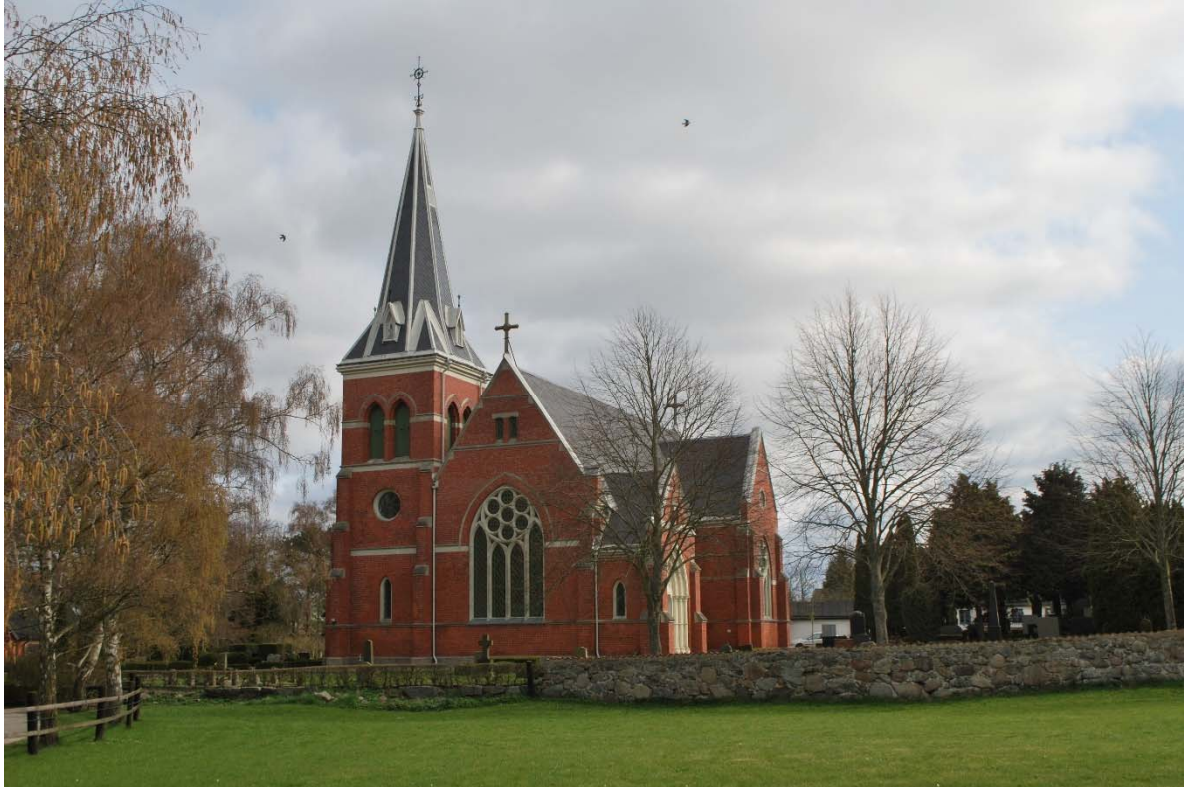
Fasad mot sydväst.