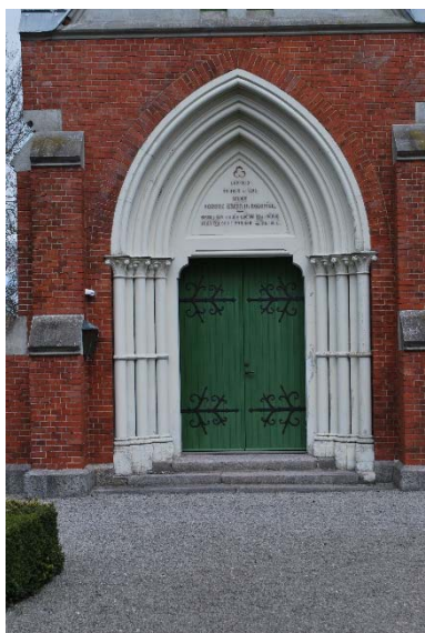
Portal i väster.

Kyrkan har huvudingång genom vapenhuset i söder. Därtill finns ingångar i båda korsarmarna, i tornet samt en till källaren. Huvudingången är en spetsbågig cementgjuten profilerad perspektivportal. På vardera sidan finns tre kolonner med knoppkapitäl. I tympanon sitter en stentavla med text och kyrkans byggnadsår. Ingångarna i södra korsarmen samt torningången sitter också i spetsbågiga portaler, men är enklare än huvudingången. Ingången till orgelläktaren i norra korsarmen är genom ett minitrapptorn, så kallad turell. Den raka dörren har i ovankant en cementsten. Samtliga dörrar är klädda med grönmålad pärlspontpanel, har stora dekorativa smidda svarta gångjärnsbeslag och är originaldörrarna.