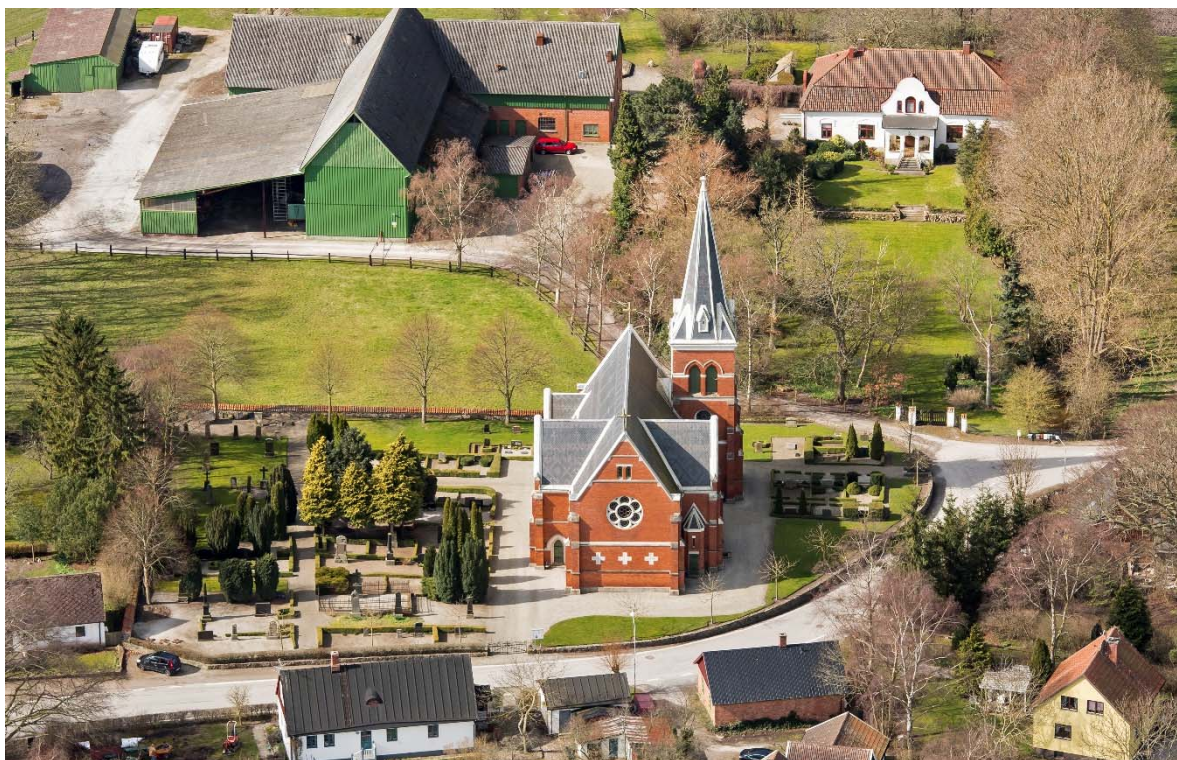
Från öster.

På en karta från 1763 var Mellan-Grevie kyrkogård närmast kvadratisk och omgiven av en mur. Ingången var i norr. Kyrkogården utvidgades åt norr och väster 1862 och ytan dubblerades därmed. Den nya kyrkan byggdes på den utvidgade kyrkogården. När kyrkan uppförts 1893 ordnades kyrkogården med nya gravkvarter och gångar. Den gamla muren restaurerades och ny stödmur byggdes kring utvidgningen.