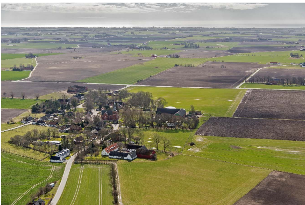
Från norr.

Mellan-Grevie är en liten kyrkby på Söderslätt i sydvästra Skåne. Söderslätt är området söder och väster om landsvägen mellan Malmö och Ystad. Mellan-Grevie ligger i övergången mellan slättbygd och backlandskap. Slättbygden har Sveriges bästa åkerjord. De goda förutsättningarna för odling gjorde området attraktivt redan under förhistorisk tid. Flera gravhögar från bronsåldern visar detta. Kring 1000-talet, efter befolkningsökning och förbättringar inom jordbruket, skedde en omfattande bybildning. Under 1100-talet bildades socknar och flera romanska kyrkor byggdes i området. Socknarna är små och kyrkorna ligger tätt, vilket tyder på stor befolkning i en bördig och rik trakt.