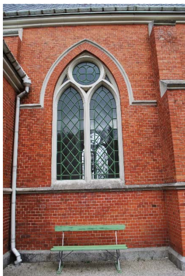
Fönster i långhuset.