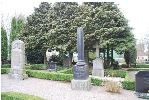
Kyrkogården söder om kyrkan.

Gångarna är av singel. Gravplatserna är mestadels täckta med singel och omgärdade av låga buxbomshäckar. Enstaka gravar har smidesräcke eller kätting. Få träd, men flera vintergröna buskar, en del uppstammade, växer på några gravar. De äldsta gravarna finns söder och väster om kyrkan. De äldsta stenarna är kalkstenshällar från mitten av 1800-talet i empirestil. Det finns högresta gravstenar i granit och diabas, bland annat i form av obelisker och avbrutna kolonner från sekelskiftet 1800/1900. Den vanligaste titeln är lantbrukare. Kyrkans byggmästare Per Pettersson är begravd väster om kyrkan. Norr och väster om kyrkan, det vill säga på den utvidgade delen från 1862, finns flera grässådda partier med stenarna stående i gräs.