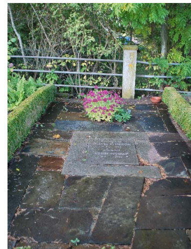
[9]: Modern hållgrav

Den norra utvidgningen avgränsas av en grusgång mot söder, och i övriga väderstreck ett staket med stålrör mellan betongstolpar. Längs staketet i norr, från vilket man har vidsträckt utsikt över åkrarna, finns buskar och askar, som bildar en gles trädkrans. Gravplatserna är med få undantag grusade med buxbomsomgärdning, ibland prydda med vintergrönt eller blommor. Bland titlarna finns t.ex. åboer, skräddarmästare och fiskare liksom epitetet "flitiga och plikttrogna enkan Joel Karl Anders" . Bland de moderna gravarna märks den över paret Svensson Ingerup [8], geometriskt uppbyggd med en kvadratisk namnplatta omgiven av stenhällar som täcker hela gravplatsen.