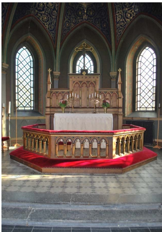
[5]: Altare, altarring och altaruppsats

Bänkinredningen från 1880-talet är gjord av ekådrat trä med nygotisk dekor i form av spetsbågar och andreskors. De två kvarteren är slutna med dörrar mot mittgången och galler som skydd framför ytterväggarnas sektionsradiatorer. Gavlar, dörrar och skärmar avslutas av profilerade socklar och överliggare dekorerade i rött och grönt. I sitsarna av hela bräder ligger lösa dynor klädda med ett rött tyg.