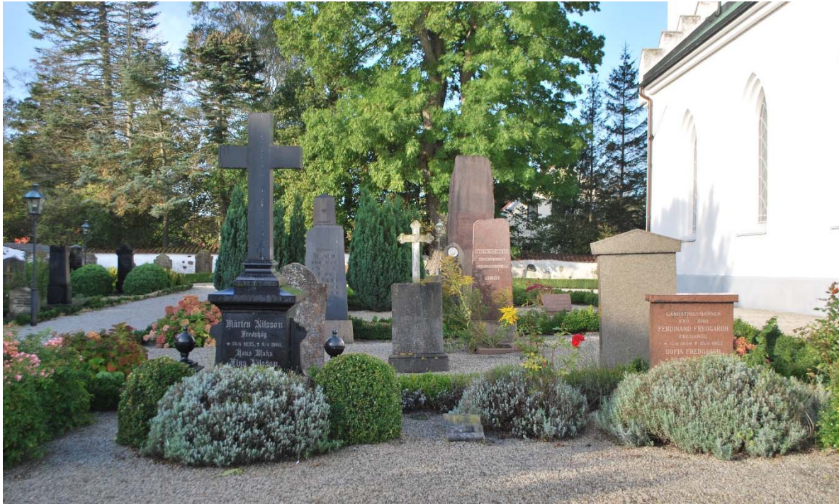
[7]: Kvarter 2, söder om kyrkan