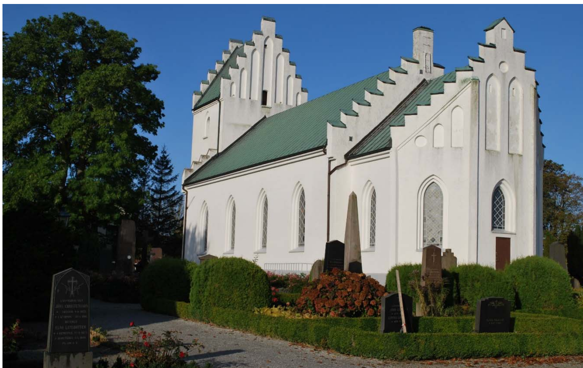
[2]: Kyrkobyggnaden från sydöst

Kyrkofasaderna är vita, spritputsade och avfärgade med kc-färg. Det romanska murverket är gjort av gråsten med sandsten i omfattningarna, övriga delar av tegel. Längst ned löper en skråkantad, gråmålad sockel. Alla gavlar är utformade som trappstegsgavlar med tinnarna avtäckta med kopparplåt. Kor- och torngavlarna pryds av vitputsade, små cirkulära och höga spetsbågiga blinderingar. Korets sidor skiljs av hörnlisener och väggpilastrar, som sammanbinds av en enkel taklist i två grunda språng. Ytterväggarna möter taken genom en tvåsprångig, slätputsad gesims.