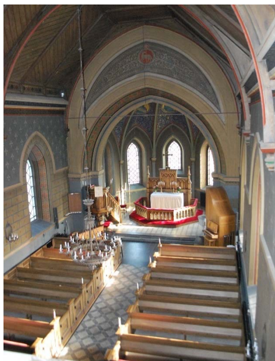
[3]: Långhuset och koret från läktaren