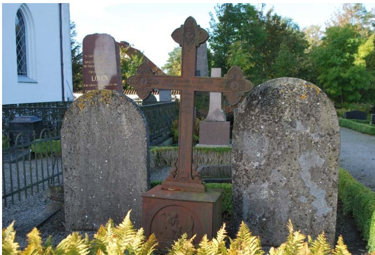
[8]: Gjutet järnkors flankerat av kalkstensvärdar