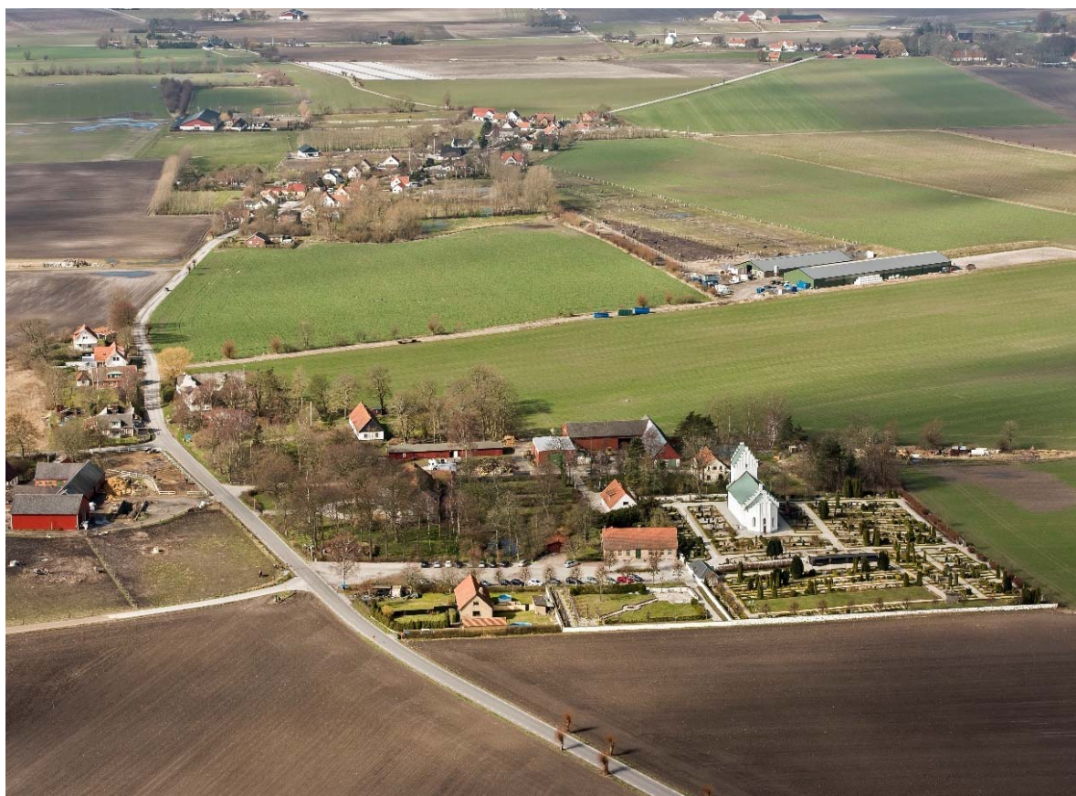
[1]: Rängs kyrkby från öst, Lilla Räng i bildens ovankant

Öster om kyrkbyn finns ett lätt kuperat jordbrukslandskap, där den långa utsikten endast bryts av den glesa pileallén längs byvägen.