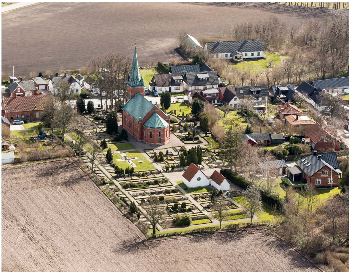
Från nordväst. (Kyrkan har omvänd orientering med tornet i öster.)