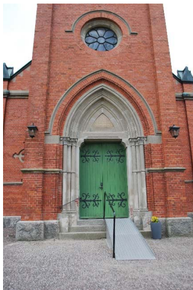
Portal i öster.