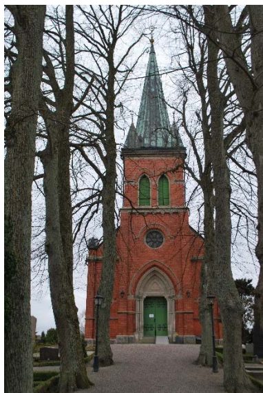
Fasad mot öster.