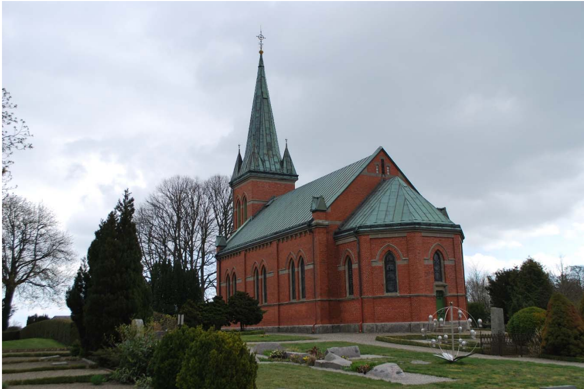
Fasad mot nordväst. Kyrkan har ovanlig omvänd orientering med torn i öster och absid i väster.