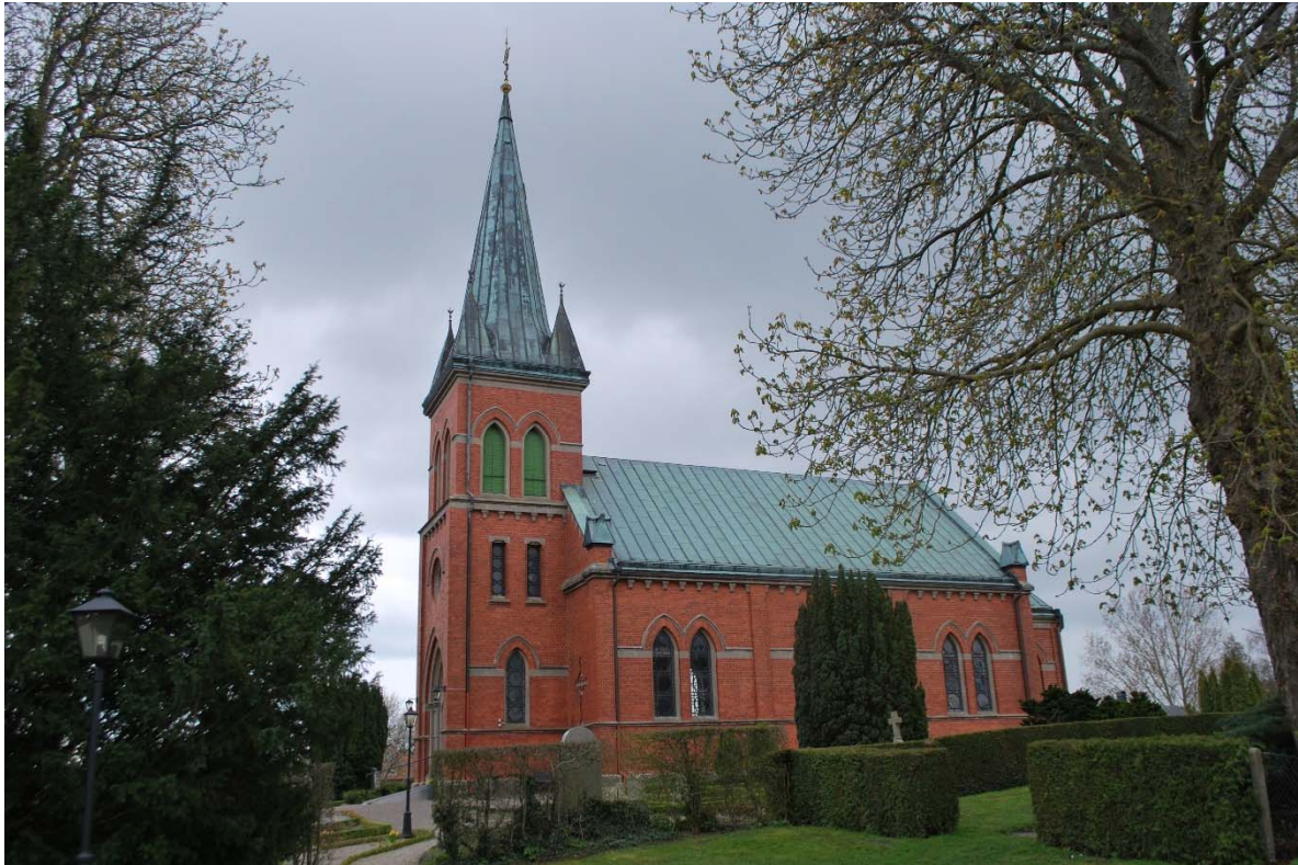
Fasad mot norr.