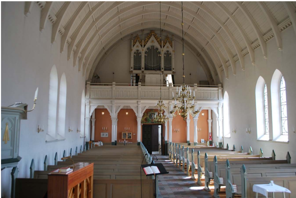
Långhuset mot orgelläktaren i öster.

Den lilla sakristian med klädskaup inryms bakom altaruppsatsen. Det lägre golvet är belagt med brädor.