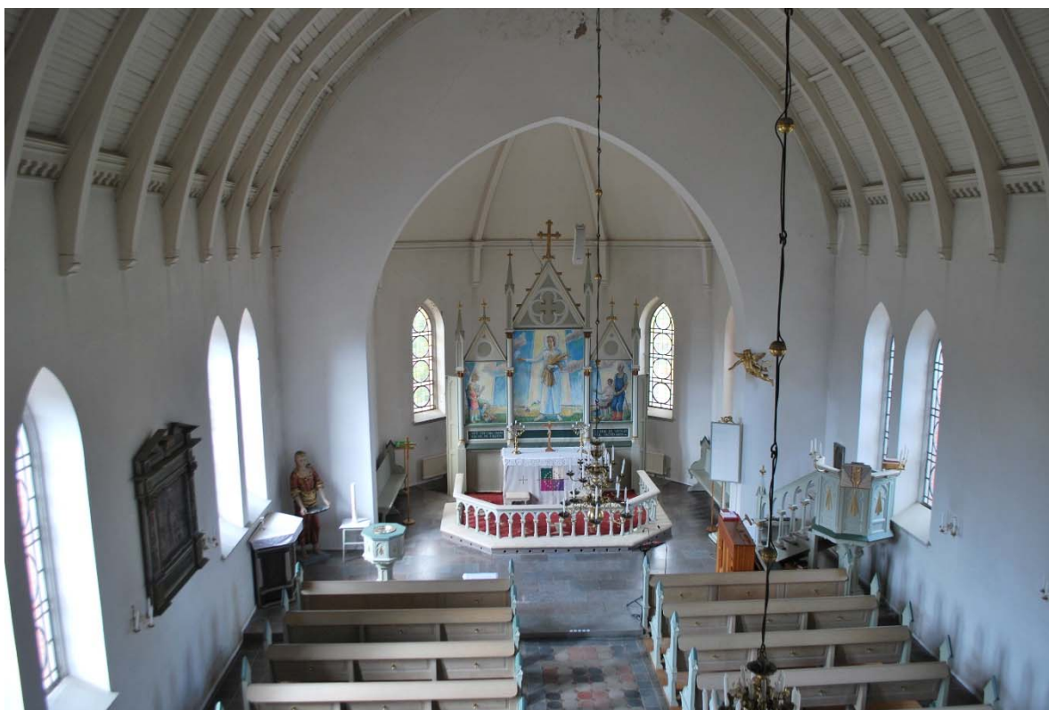
Långhuset mot koret i väster. Från orgelläktaren.

Vapenhuset i tornet har högt i tak och ljus från två höga fönster. Väggarna är putsade och målade, i taket sitter träpanel och på golvet ligger kalkstensplattor. En trätrappa leder till tornets övre våningar. Under trappan är inbyggt teknikutrymme. En brunmålad pardörr med ramverk och fyllningar leder in i kyrkan.