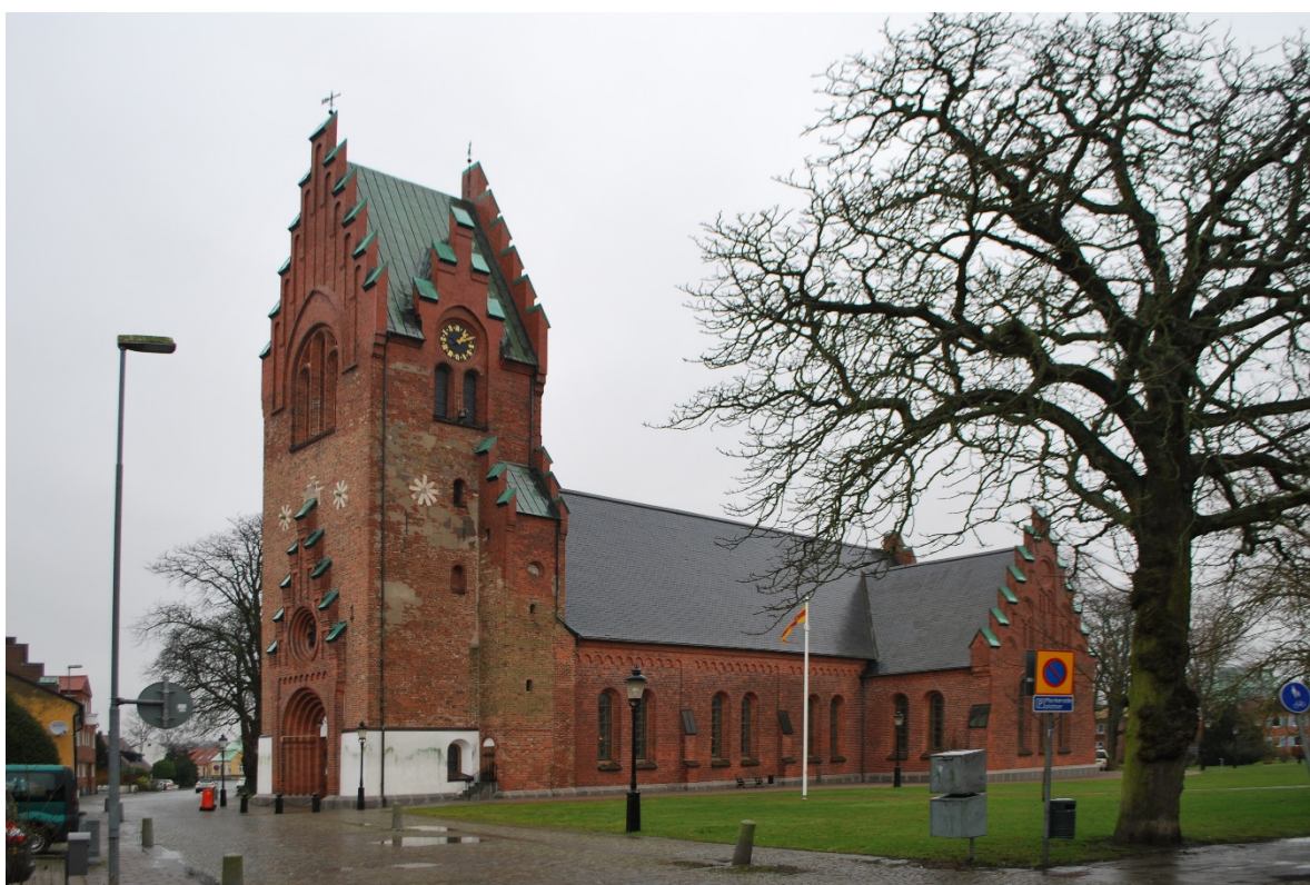
Fasad mot sydväst.

Kulturhistorisk karaktäristik och bedömning