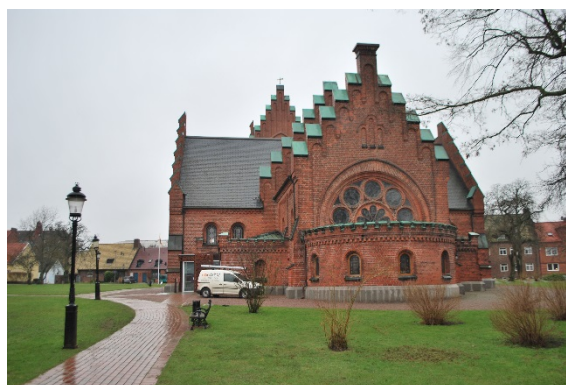
Fasad mot öster.

Huvudingången är genom tornets perspektivportal i väster som tillkom på 1880-talet. Portalen kragar ut en tegelsten från tornets murliv. Dubbeldörren omges av sex rundbågiga tegelsprång. Ovanför sitter ett rosettfönster och portalen avslutas som en trappgavel. Dörrarna av ekbrädor är försedda med dekorativa gångjärnsbeslag och bronslejon med ringar som handtag. Ett lejon är från gamla kyrkan medan det andra är från 1880-talet.