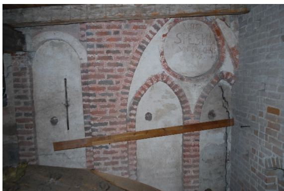
Långhusets forna västgavel med medeltida blinderingar.

vapenhuset. Trapphuset är samtida med tornet från 1617. Tornet ersatte då ett smalare senmedeltida torn. Ingången från vapenhuset till trappan är dock från 1933. Spiraltrappan och väggarna är av tegel. Upp till orgelläktaren är trappans steg belagda med Skrombergaklinker. I tornets andra våning, ovanför orgelläktarens isolerade valv, finns ett före detta fläkthus till orgeln. Den östra väggen i rummet är långhusets forna västgavel och väggen har medeltida rundbågiga och senmedeltida spetsbågiga blinderingar.