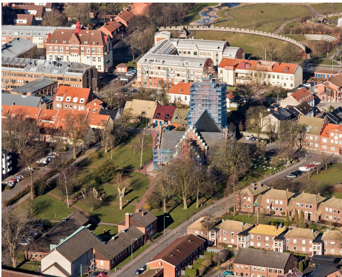
Från öster. Den rekonstruerade Trelleborgen i bakgrunden.

Trelleborg ligger på Skånes sydkust på Söderslätt. Trelleborg är belagd som stad på 1250-talet men viss bosättning fanns tidigare. En ”trelleborg”, det vill säga en rundborg, daterad till 900-talet fanns. Delar av Trelleborgen, som gett staden