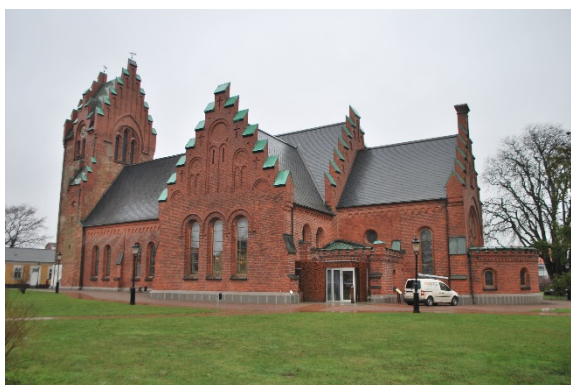
Fasad mot sydöst.

Fönstren är alla rundbågiga men av olika format och utseende. De flesta försågs med ytterbågar av mahogny 1978. Långhusets stora rundbågiga fönster av gjutjärn är indelade i rektangulära rutor med färgat glas längs kanterna och runda klarglas i mitten. Koret har flera fönster med glasmålningar. På korets östgavel sitter ett stort halvrosettfönster med glasmålningar. Insidan är igenmurad men glasmålningarna syns utifrån. Solbänkarna är cementputsade och sedan 1978 klädda med koppar.