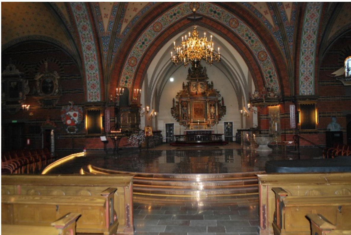
Långhuset mot koret och nytt podium i korsmitten.