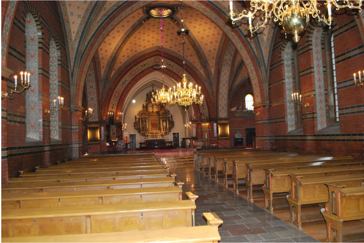
Långhuset mot koret.