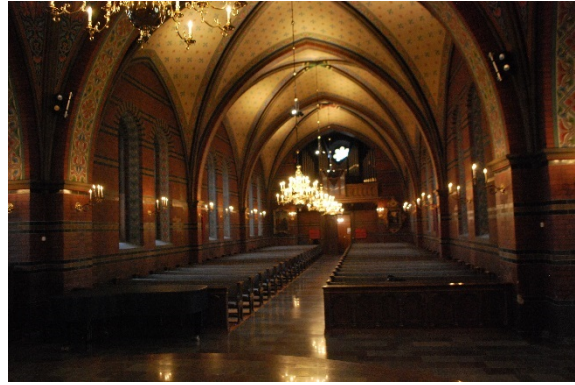
Långhuset mot orgelläktaren.

Norra och södra korsarmen har golv, väggar och valv som är lika långhusets. Bänkinredningen är borttagen i båda korsarmarna. Norra korsarmen är inredd med lekhörna, sidoaltare, modell över Jerusalem och monter med silversamling. På väggarna hänger flera epitafier. Här finns ingången till Ehrenbuschska gravkapellet med en dörr från 1600-talet som flyttats hit från predikstolstrappan. I gravkapellet står kistor från 1600-1700-talet. Kapellet är vitmålat, har tegelgolv och är välvt med ett flackt kryssvalv.