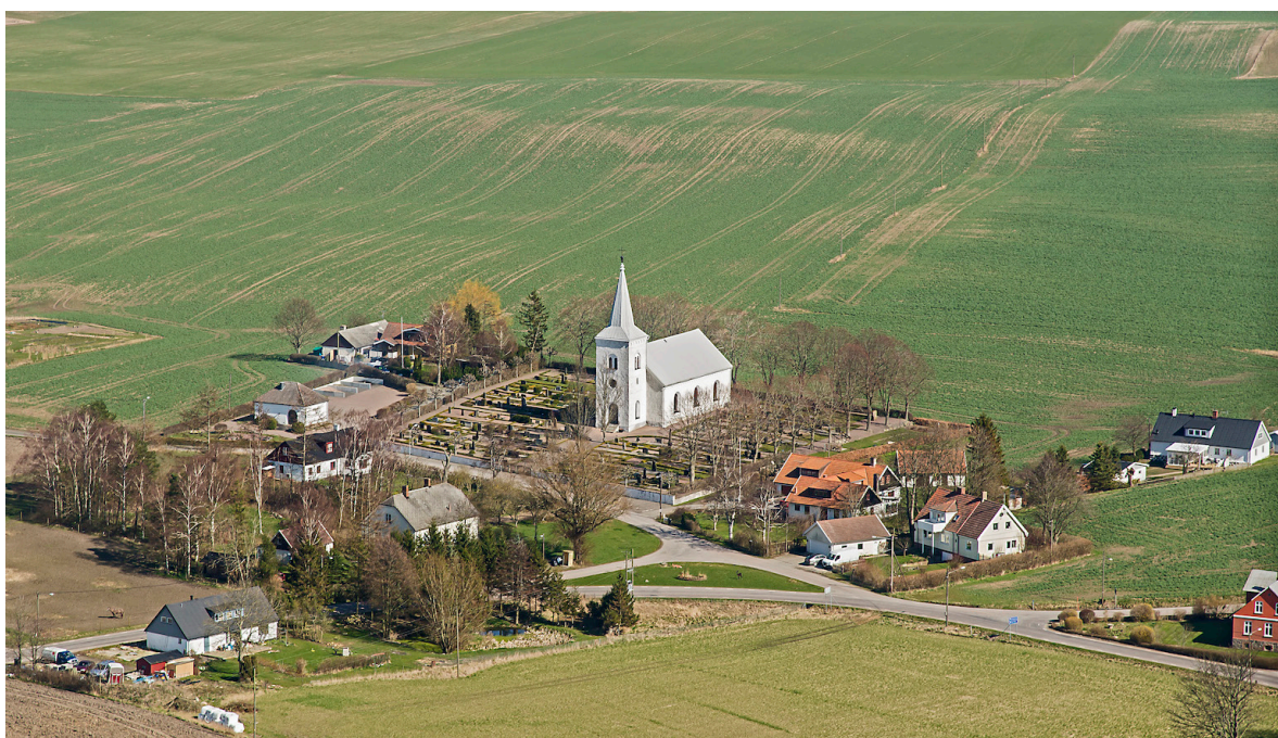
Flygbild över Katslösa 2014, tagen från sydväst.

Katslösa präglas idag av 1800-talets skiften, då flertalet av byns 14 gårdar som var samlade utmed bygatan väster om kyrkan skiftades ut och gatehus uppfördes på de gamla gårdstomterna. Bebyggelsen utgörs av äldre mangårdsbyggnader och gatehus, en äldre skolbyggnad samt ett mindre antal bostadshus av yngre datum.