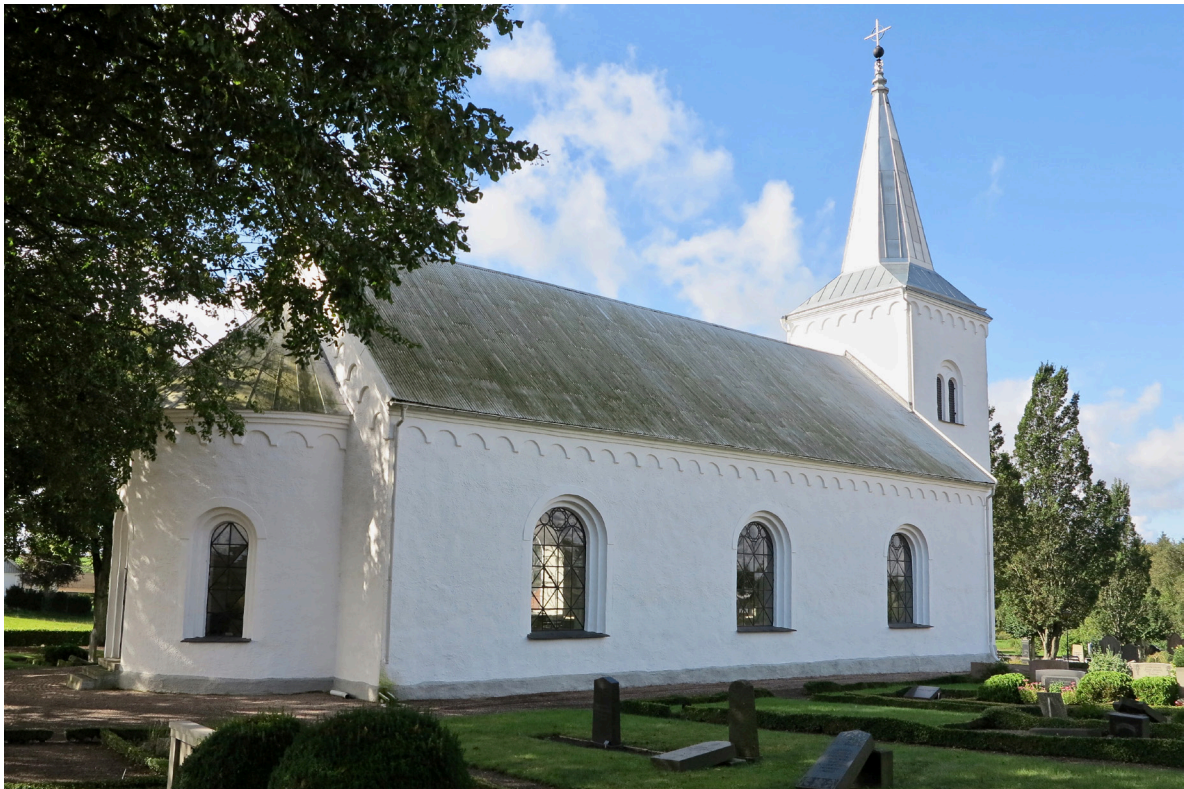
Kyrkan från nordost.

Skeppet med långhus och kor har tre stora rundbågiga gjutjärnsfönster i söder respektive norr. Spröjsningen är uppbyggd som två rundbågar med snarlik gestaltning som i tornets rundbågefönster, med ovanliggande dekorativa cirklar och kvadrater.