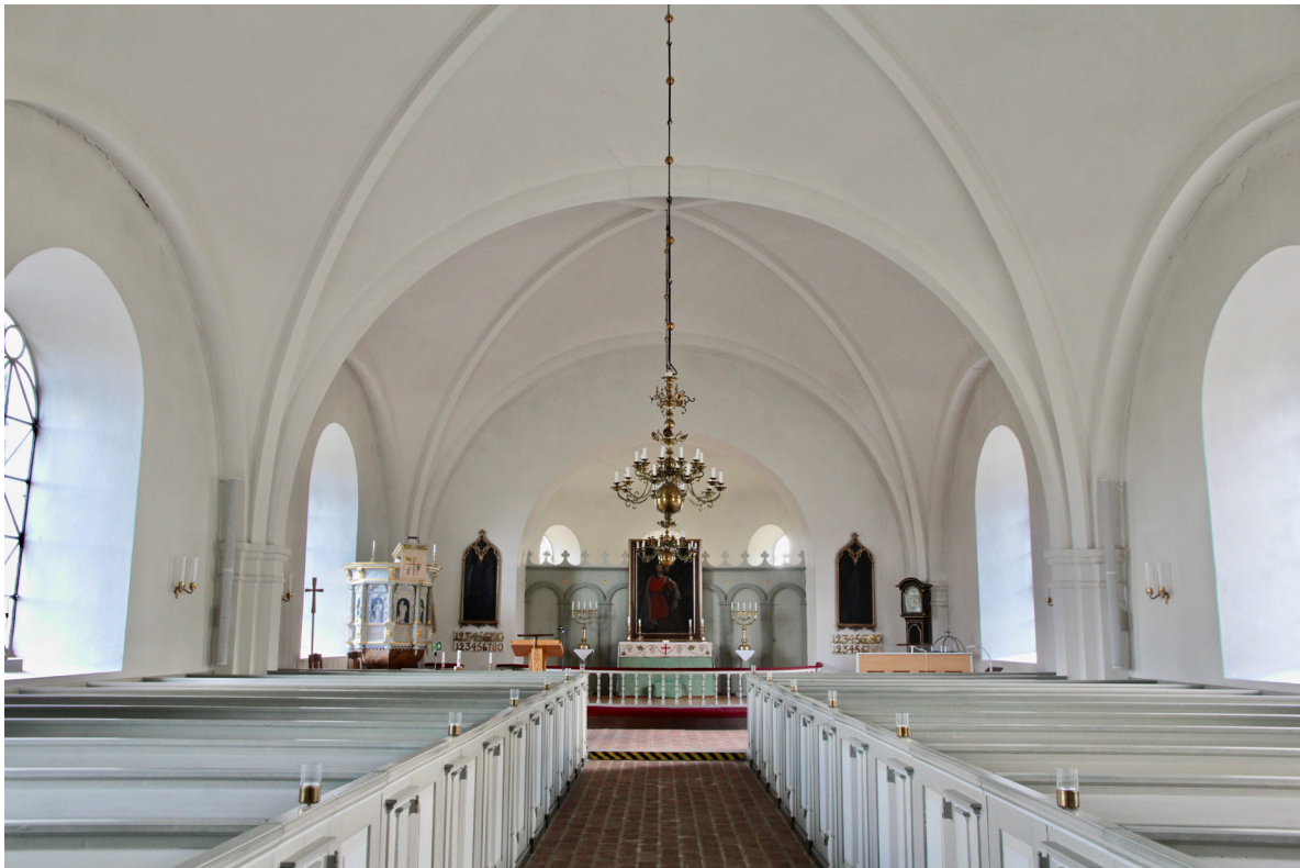
Kyrkorummet mot koret i öster.

Genom kyrkans huvudentré i väster nås vapenhuset vars golv är belagt med handslaget rektangulärt rött tegel. Utmed södra väggen avviker teglet som tillkom när den ursprungliga inbyggda torntrappan revs 1992 något i kulör. Väggarna är putsade och vitkalkade utom mot öster där en vitmålad brädvägg och skåp av skivmaterial återfinns. Innertaket utgörs av ett brädtak målat i vit alkydoljefärg. Fönstren, vars övre delar avskiljs av taket och ger ljus åt första tornvåningen, saknar innerbågar och har ljust gråmålad insida. Kyrkportens insida är utformad likt utsidan och målad i en ljust grå kulör. Mot kyrkorummet i öster har den delvis glasade och gråmålade pardörren hängts av från karmen och flyttats österut i samband med att läktarunderbyggnader för ny trappa och väntrum m.m. tillkom 2011.