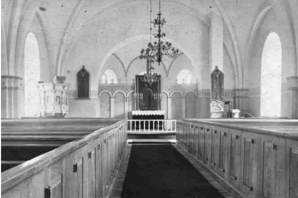
Interiören fotograferad vid okänd tidpunkt, möjligen 1930. Väggarna har dekorationsmålningar och bänkkvarteren är ådringsmålade.

tiden, där fokus låg på ett rymligt och ljust kyrkorum, med långhus och fullbrett kor under gemensamt sadeltak, halvrund absid i öster samt kvadratisk västtorn. Av entreprenadkontraktet framgår bland annat att kyrkans fasta inredning i trä skulle målas vit med förgyllda detaljer, att gjutjärnsfönstren skulle målas svart utvändigt som invändigt samt att taket skulle beläggas med furuspån. Andra källor och äldre bilder tyder dock på att taken istället belades med falsad plåt.