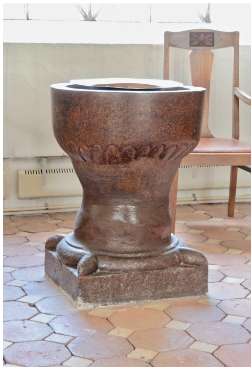
Den marmoreringsmålade dopfunten utgör kyrkans äldsta inventarium.

Bland kyrkans övriga inventarier av kulturhistoriskt intresse bör nämnas ett golvur från 1700-talet som är placerat i korets sydöstra hörn samt två psalmmummertavlor som tillhör den ursprungliga inredningen.