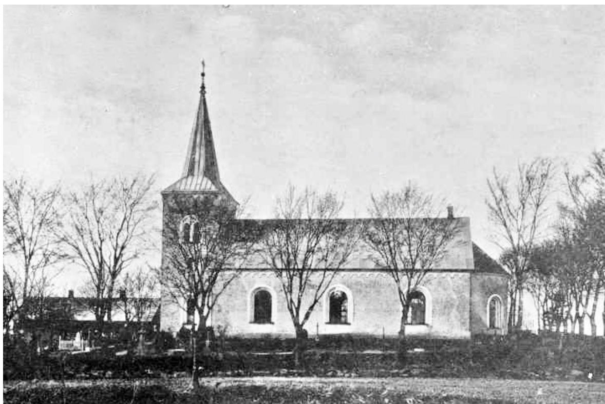
Katslösa kyrka vid okänd tidpunkt, troligen tidigt 1900-tal. Fasadputsens framstår som mörkare jämfört med de vita omfattningarna, vilket troligtvis även beror på att fasaderna är spritputsade. Nordväst om kyrkan syns den skolbyggnad som revs när gravkapellet uppfördes 1962.

Den nya kyrkan som stod färdig 1870 uppfördes på platsen för den romanska kyrkan, från vars murverk gråsten sannolikt återanvändes. Gestaltningen var typisk för