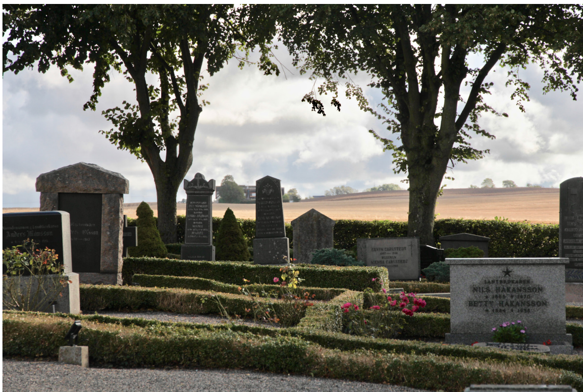
Kyrkogården karakteriseras av en blandning av äldre högresta och yngre lägre hållna gravstenar inramade av lågt klippta buxbomshäckar.

Den nuvarande kyrkan är uppförd på platsen för den romanska kyrkan och Katslösa kyrkogård har således medeltida anor. Medeltida kyrkogårdar var vanligen små och omgav kyrkan i dess direkta närhet. Den geometriska avmätningsskarta från 1747 uppvisar kyrkogården som en oregelbunden fyrkant, vars utbredning möjligen stämmer med den medeltida. Enskiftet 1817 påverkar inte kyrkogårdens utbredning men enligt vård- och underhållsplanen för kyrkogården planeras det 1841 i samband med laga skifte för en utvidgning åt öster som senare genomförs. Av det äldre kartmaterialet framgår emellertid att laga skifte avslutades 1835 och att utvidgningen skedde åt väster. Sin nuvarande omfattning fick kyrkogården i samband med den nya kyrkans uppförande 1868–70. Handlingarna som upprättades 1869 visar att den östra gränsen rätades upp medan utvidgningar skedde ut till bygatan i väster samt i söder. Förändringarna tycks därefter varit relativt få. På 1920-talet upprättas nuvarande gångsystem, troligen rör detta främst det huvudaxlarna, och 1932 byts samtliga ligusterhäckar ut mot buxbom. Vid något tillfälle, möjligen i samband med att elektricitet installeras i kyrkan 1958, tillkommer belysning i form av stolparmaturer och 1962 uppförs ett gravkapell direkt norr om kyrkogården på platsen för en tidigare skolbyggnad. 2003 anläggs askgravlund på den kilformade delen utanför trädkransen i söder, utformad av Gunnel Rydberg.