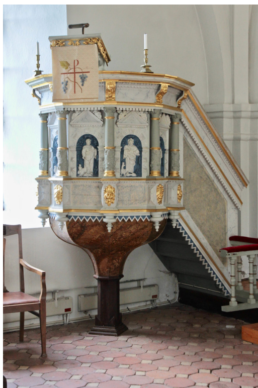
Predikstolen framstår åtminstone delvis som betydligt äldre än 1860-talet som källorna anger.