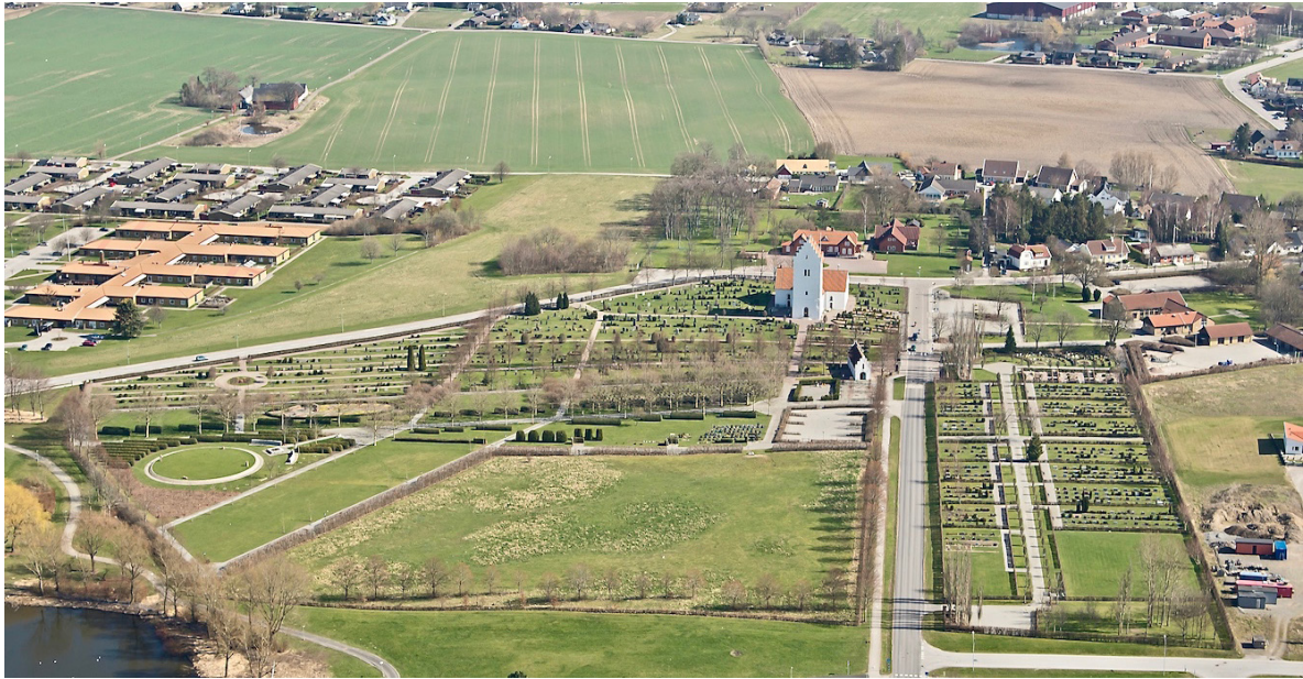
Skurups kyrkogård 2014.