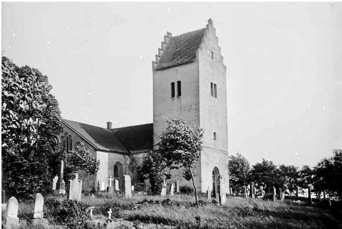
Skurups kyrka fotograferad på tidigt 1900-tal. Kyrkogården bevarar ännu ängskaraktär medan kyrkan i det närmaste har samma utseende som idag.

Skurups kyrka, som är helgad åt Maria, uppfördes kring år 1200 efter traditionellt romanskt kyrkobyggnadsmönster med ett långhus om två travéer, lägre och smalare kor samt halvrund absid i öster. Troligen byggdes samtidigt eller tidigt i kyrkans byggnadshistoria ett västtorn alternativt en förlängning av långhuset åt väster. Sannolikt var det herrskapet på Skuderup som initierade och finansierade kyrkobygget. Patronatsförhållandet är med säkerhet belagt sedan 1400-talet och kom att bestå tills patronatsrätt i Sverige avskaffades 1922. Under 1300-talet valvslås kyrkorummet och kring 1350 dekoreras valven med målningar av den så kallade Snårestadsmästaren, vilka målas över och ersätts med nya målningar som daterats till cirka 1500 och knutits till Lilla Harrie-gruppen. Västförlängningen valvslås senare under medeltiden, vilket tyder på att det skulle kunna röra sig om ett torn snarare än