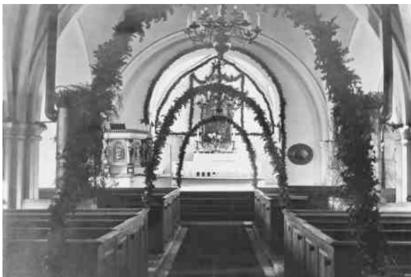
Interiören fotograferad någon gång mellan 1906 och 1928. Bänkarna är ådringsmålade och predikstolen vit. Över altaret hänger ännu den tidigare altartavlan.

1957 byts fönster och dörrar ut efter ritningar av arkitekt Torsten Leon-Nilson. 1968 putsas fasaderna med kalkcementbruk och avfärgas med cementbaserad färg. Konservator Albert Eriksson konserverar 1976 altartavla, epitafium samt kalkmålningarna och året därpå tas främsta bänkraden i mittgången bort och trappräcken av plattstål tillkommer mot koret.