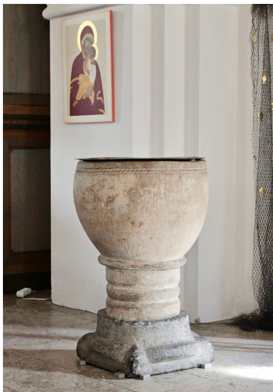
Den romanska dopfunten utgör kyrkans äldsta inventarium.