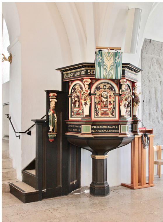
Predikstolen i polykromt bemalad ek från 1605.

Orgeln med 14 stämmor fördelade på två manualer plus pedal tillverkades 1906 av den framstående orgelbyggaren Eskil Lundén i Göteborg. Orgeln har rörpneumatisk traktur kopierad av den tyske orgelbyggaren Wilhelm Sauer och är troligen den enda bevarade Lundénorgeln med denna konstruktion. Den vitmålade fasaden med synliga stumma pipor som flankeras av integrerade dörrar har ett klassicistiskt formspråk där den för tiden aktuella jugendstilen gör sig påmind i dörrbladens säregna avslutning och