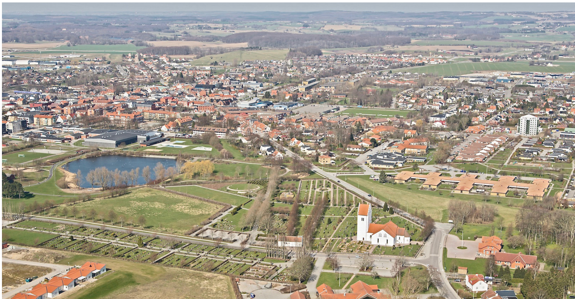
Flygbild över Skurup 2014, tagen från söder.

Ortnamnet Skurup kommer av den medeltida borg med namnet Skuderup som var en föregångare till Stjärneholm och sedermera Svaneholm. Namnet dyker upp i skrift för första gången 1443 och nämns då som sätesgård. Efterleden -rup med betydelsen torp är medeltida och byns framväxt bör därmed vara samtida med uppförandet av kyrkan på 1100-talet. Kyrkbyn var fram till järnvägens ankomst en medelstor skånsk by, men när den så kallade Grevbanan mellan Malmö och Ystad anlades 1874 växte ett stationssamhälle i karaktäristisk tegelarkitektur snabbt fram och övertog kyrkbyns roll