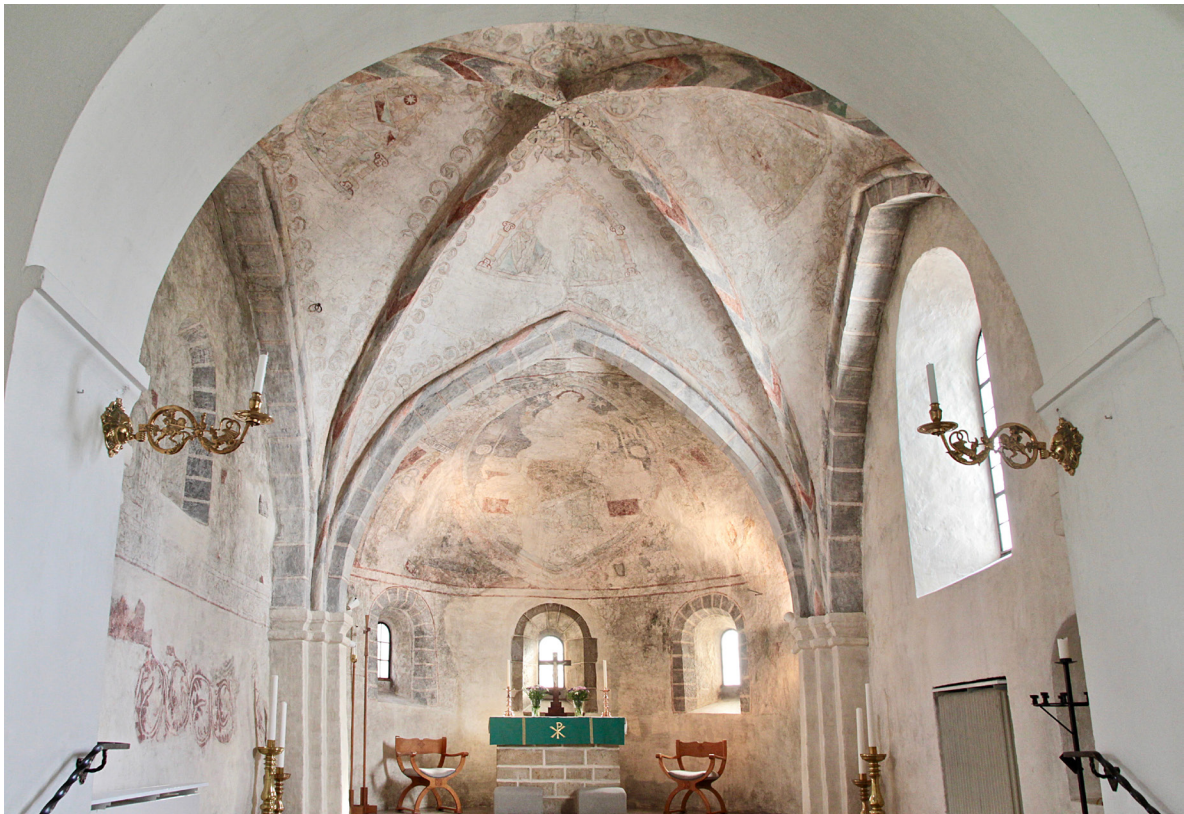
Koret och absiden med kalkmålningar av Snårestadsmästaren.

Första tornvåningen ovanför vapenhuset nås via en murad trappa med ingång på tornets södra sida. Rummet har låg takhöjd, där taket utgörs av andra tornvåningens golvbjälklag. Naturstensmurverken är oputsade. En trätrappa leder upp till andra tornvåningen, med obehandlat brädgolv, murverk med brett utstrukna fogar och en stolpverkskonstruktion som bär upp klockvåningens golvbjälklag. I öster leder en dörr in till kyrkvinden. Klockvåningen har obehandlat brädgolv och murverken, som utgörs av tegel och natursten, är delvis putsade. Rummet upptas av klockbocken i ek