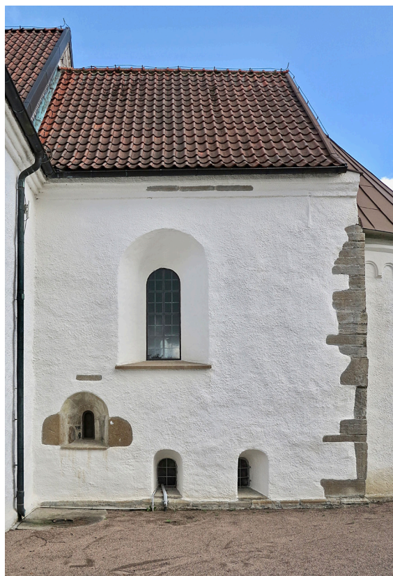
Korets sydfasad med det romanska hagioskopet till vänster.

De båda korsarmarna är identiskt utformade. Västra fasaderna upptas av en hög rundbågig omfattning i tre språng som rymmer en stickbågigt avslutad dörr och ett mindre rundbågigt fönster. Dörrbladet är utformat enligt samma princip som övriga dörrar och fönstret har diagonalställd blyspröjsning med