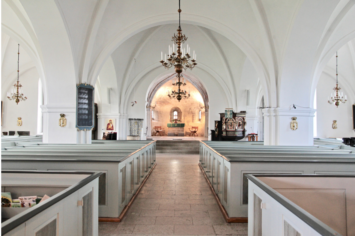
Kyrkorummet mot koret i öster.

med ribbvalv och pilastrar enligt samma princip, tillkomna vid Brunius ombyggnad på 1800-talet. Sköld- och gördelbågar är rundbågiga. I västförlängningens södra mur finns en igensatt medeltida dörröppning med omfattning av frilagd kalksten. De båda fönstren saknar här innerbågar, till skillnad från i korsarmarna som har innerbågar av gråmålat trä. Korsarmarnas väggar pryds av äldre gravhällar, epitafium, psalmnummertavlor och en tidigare altartavla samt lampetter i mässing. I samtliga travéer utom i västförlängningen hänger takkronor i mässing. Västförlängningen upptas istället av orgelläktaren som förutom i murverken vilar på kolonner ståendes i bänkkvarteren. Kolonnernas övre del är målade i en brun eller bronsaktig kulör, medan de nedre delarna är inmålade i samma grå kulör som bänkinredningen. Barriären utgörs av profilsågade balusterdockor kring ett mittparti uppbyggt som ramverk med tre fyllningar, av vilka den centrala pryds av en förgylld girland. Ramverken är gråmålade medan balusterdockor och fyllningar är marmorerade enligt samma princip som dörrarna i vapenhuset. Kyrkrummet upptas i övrigt främst av den slutna bänkinredningen. Närmast koret har borttagna bänkrader ersatts av lösa stolar. Predikstolen återfinns söder om triumfbågen och dopfunten norr därom. Mor norra korsarmens östvägg finns en kororgel.