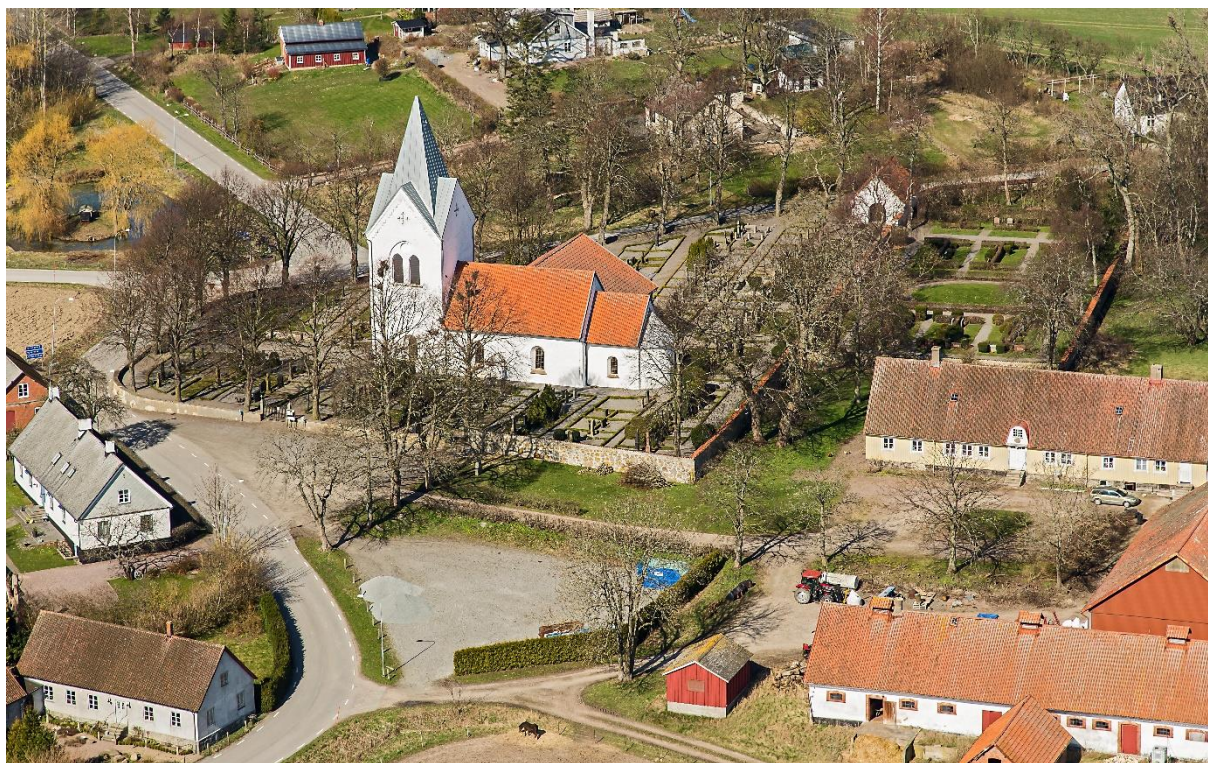
Flygbild över Västra Nöbbelövs kyrkoanläggningen, tagen från sydost. Till höger ligger den f d prästgården, uppförd 1816.

Järnvägen mellan Ystad och Skivarp, som öppnade för trafik 1901, drogs norr om kyrkan och en station anlades i nordväst. Banan var främst avsedd för transporter av sockerbeter till Skivarps sockerbruk och lades ned redan 1919. Söder om kyrkoanläggningen utmed vägen mot kusten ligger Nöbbelövs f d skola med lärarbostad. Skolbyggnaden, som uppfördes 1939 i tegel, används idag av Västra Nöbbelövs Byalag.