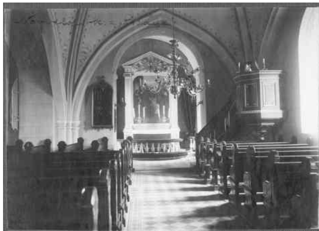
Västra Nöbbelövs kyrkas exteriör från söder. Foto: Erik Lundberg, 1942. Samt interiör mot öster, okänd fotograf och årtal. Bilderna är hämtade från Riksantikvarieämbetets bilddatabas Kulturmiljöbild.