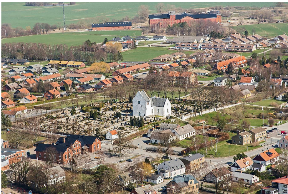
Flygfoto över Skivarps kyrkoanläggning, taget från sydväst. I bakgrunden syns de kvarvarande byggnaderna från Skivarps sockerbruk. Foto: Pär-Martin Hedberg, 2014.

Kyrkan är högt placerad norr om landsvägen och den äldre bebyggelsen är framför allt samlad utmed vägen. Söder om landsvägen, mitt emot kyrkoanläggningen och torget, ligger Skivarps Gästgivargård med anor från 1600-talet. I mitten av 1800-talet expanderade Skivarp och byggnader för service och handel uppfördes. Järnvägslinjen Trelleborg – Rydsgård öppnades för trafik 1895 och en station anlades i byns södra del. Det bidrog till att ett mindre stationssamhälle växte fram.