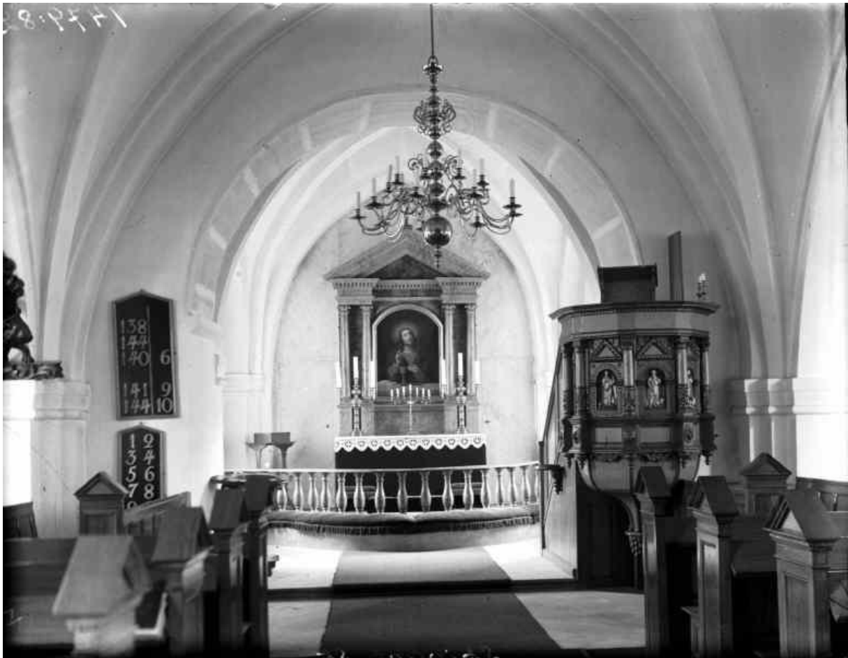
Skivarps kyrkas interiör mot öster. Foto: Erik Andrén, 1929. Bilden är hämtad från Riksantikvarieämbetets bild databas Kulturmiljöbild.