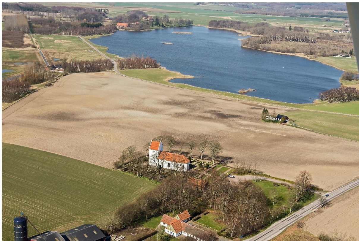
Flygbild över Svenstorps kyrkomiljö, tagen från sydöst, med Näsbyholmssjön i bakgrunden. Foto: Pär-Martin Hedberg, 2014.

Socken ingår naturgeografiskt i det område som tillhör Södra Skånes slättbygder. Kyrkan är belägen i ett småkuperat odlingslandskap vid vägen mellan Skurup och Västra Vemmenhög, strax sydväst om Skurups samhälle. Kyrkan är högt placerad söder om Näsbyholmssjön, som under 1800-talet utdikades, men som nu åter delvis är återskapad. Idag ligger endast en större gård kvar i byn, direkt söder om kyrkan. Nordost om landsvägen ligger Svenstorpsgården.