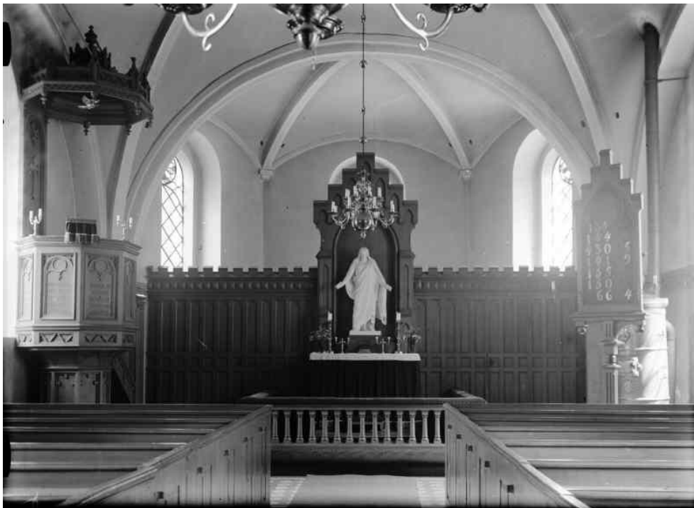
Svenstorps kyrkas interiör mot öster. Foto: Erik Andrén, 1929. Bilden är hämtad från Riksantikvarieämbetets bild databas Kulturmiljöbild.

Före den omfattande ombyggnad av Svenstorps kyrka år 1854 bestod den av det nuvarande tornet, som uppfördes på 1540-talet, och ett nu rivet långhus och kor samt ett vapenhus vid sydportalen. Från långhusvinden är spåren efter det rivna långhuset synliga på tornets östra sida. Det har haft ett brant takfall och varit förskjutet mot norr. Tornets synliga delar har varit vitkalkade. Enligt uppgifter i fornminnesregistret ska det finnas runstenar i kyrkans grundläggning och i tornet. Vid nedrivning av den gamla kyrkan ska två runstenar ha påträffats. Den ena ska ha sprängts och inlagts i grunden till den nuvarande kyrkan. Den andra murades in hel i tornmuren, vilken därefter överrappades.