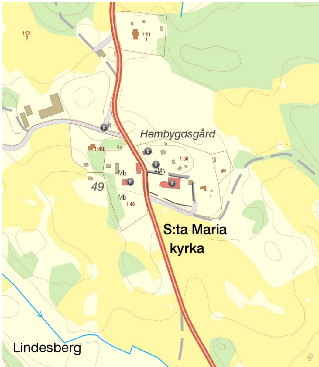
Risinge gamla kyrka