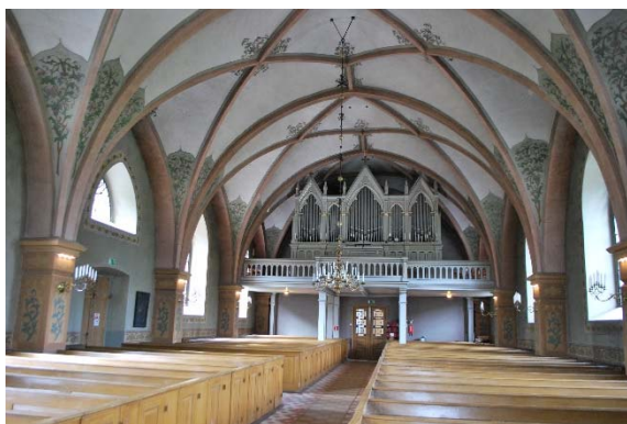
Långhuset mot orgelläktaren i väster.

Koret upptas av altaruppsats och altarring. Fem fönster belyser koret. Ett altarskrank avskärmar sakristian. Skranket av gråmålat trä med spetsbågar har ett krön av genombruten plåt med stiliserade liljor. På ömse sidor om altaruppsatsen finns dörrar till den lilla sakristian.