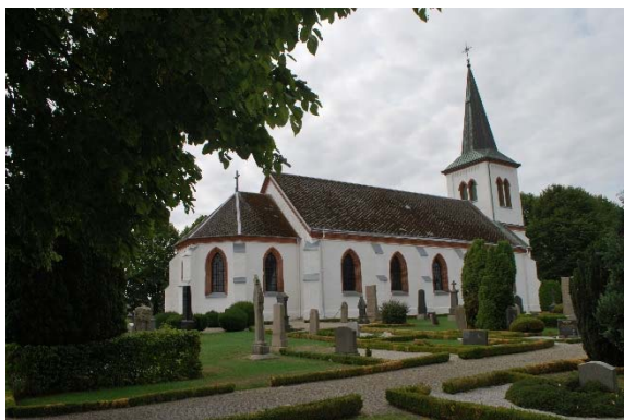
Fasad mot nordöst.

Kyrkan har tre ingångar, huvudingång genom tornet i väster, sidoingång på sydsidan och prästingång i koret i öster. Västportalen av rött tegel är utkragande med spetsigt gavelmotiv. Syd- och östingång sitter i spetsbågiga flersprångiga tegelomfattningar med rektangulära dörrar och spetsbåligt överljus. Samtliga pardörrar är gjorda av grönmålat ramverk och fyllningar. Insidorna är ådringsmålade. Söder om koret finns en nergång till pannrum i källaren.