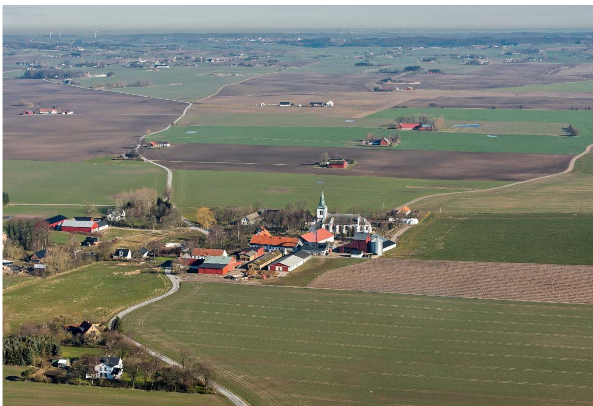
Från söder.

Bösarp ligger på Söderslätt en mil nordöst om Trelleborg. Slättbygden har Sveriges bästa åkerjord. De goda förutsättningarna för odling gjorde redan under förhistorisk tid området attraktivt. Kring 1000-talet, efter befolkningsökning och förbättringar inom jordbruket, skedde en omfattande bybildning. Under 1100-talet bildades socknarna och flera romanska kyrkor byggdes i området, ibland ersatte de en träkyrka. På en karta från 1769 finns ett tiotal gårdar i Bösarps by som låg kring en gemensam byplats och en damm för vattning. Kyrkan ligger i nordöstra hörnet. I Bösarps socken ingår ytterligare tre byar. Byn var omgiven av odlingsmark indelad i en mängd smala tegar. Denna struktur behölls fram till enskiftet med början 1806 då landskapet