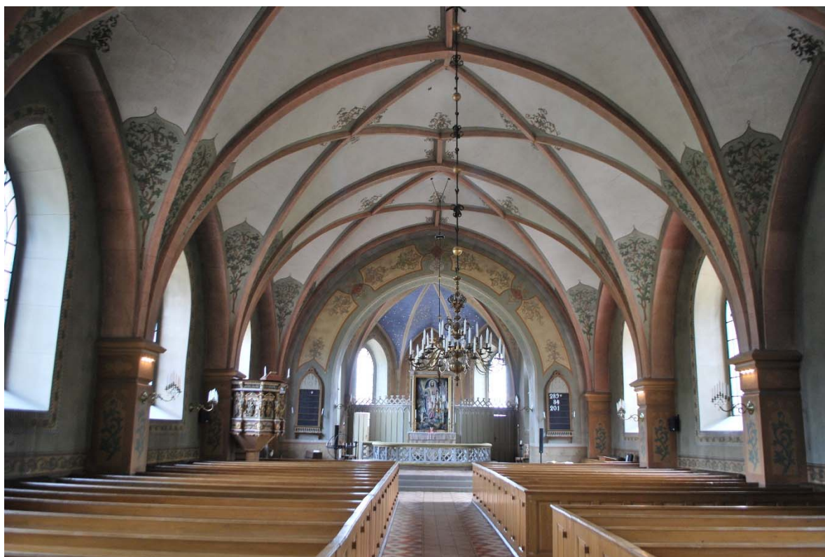
Långhuset mot koret i öster.

I en djup stickbågig öppning sitter en ådringsmålad pardörr med spröjsat färgat glas i övre delen som leder till långhuset.