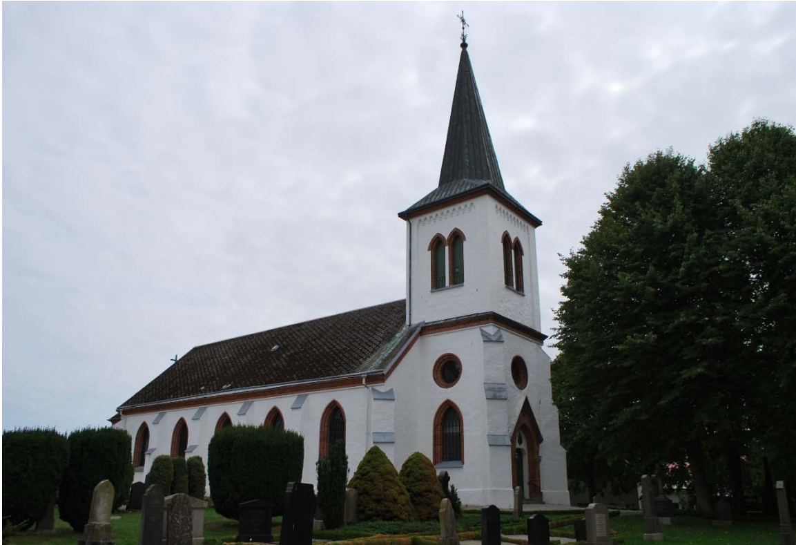
Fasad mot nordväst.