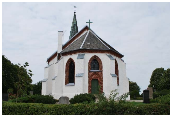
Fasad mot öster.

Kyrkans gjutjärnsfönster från 1871 är spetsbågiga, svartmålade och småspröjsade med blåst klarglas. Fönstren har en omfattning av rött tegel i två språng. Solbänkarna är