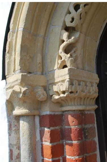
Detalj av sydportalen.