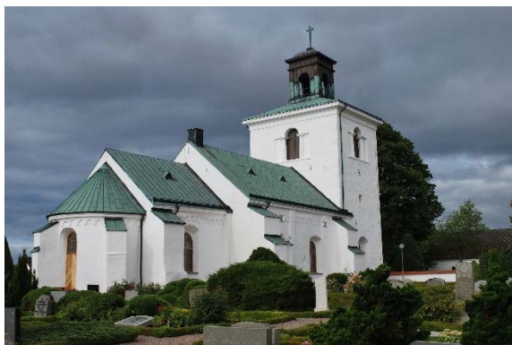
Fasad mot nordöst.

Murarna är vitputsade, ekfönstren är rundbågiga, fasaden artikuleras av rundbågsfriser, lisener och strävpelare. Den ursprungliga sydportalen är bevarad. En huggen stensockel finns delvis bevarad. Taken är täckta med koppar.