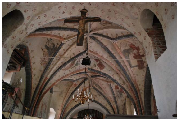
Triumfbågen med kalkmålning och öppning till trappor

Koret är i samma nivå som långhuset och golvet belagt med samma sorts tegel som i