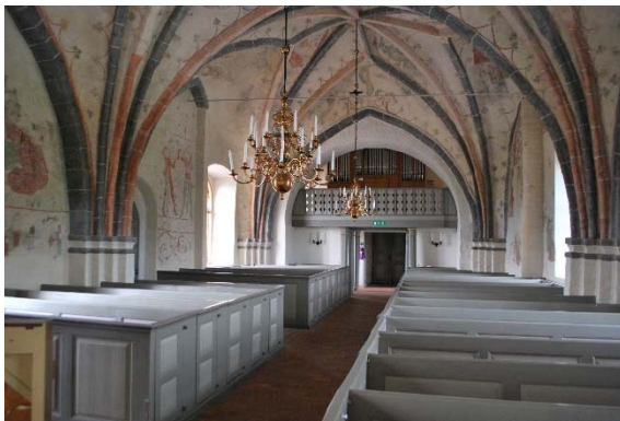
Långhuset mot väster.