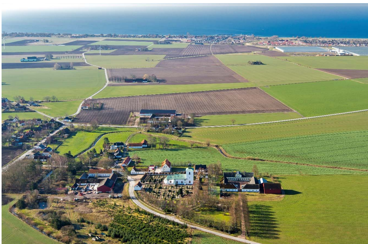
Från norr.

Gislöv ligger på Söderslätt en halvmil nordöst om Trelleborg. Slättbygden har Sveriges bästa åkerjord. De goda förutsättningarna för odling gjorde redan under förhistorisk tid området attraktivt. Dalköpingeån som i äldre tider varit segelbar från kusten flyter genom byn. Ortsnamn med efterledet -löv antas vara bland de äldst uppkomna ortsnamnen. Kring 1000-talet, efter befolkningsökning och förbättringar inom jordbruket, skedde en omfattande bybildning. Under 1100-talet bildades socknarna och flera romanska kyrkor byggdes i området, ibland ersatte de en träkyrka. På Söderslätt är socknarna små och kyrkorna ligger tätt. I slutet av 1500-talet omtalas att Gislöv hade 29 gårdar och var näst största byn i Skytts härad. På en karta från 1767 visas att det fanns 35 gårdar i Gislöv på båda sidor om ån. Kyrkan låg i nordvästra