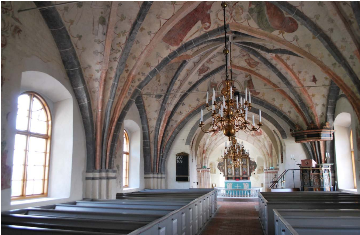
Långhuset mot koret i öster.

Väggar och valv är mycket rikt bemålade. I en första etapp efter valvslagningen målades med bågfriser vid sidan om ribborna och kvaderimitation i rött och grått på ribborna i långhuset. Kring 1500 tillkom bildmotiven och växtrankor på väggar och valv målade av den så kallade Gislövmästaren, som man tror även målade Silvåkra kyrka. I det västra valvet skildras skapelseberättelsen. Adam och Eva med ormen, Evas skapelse från Adam, utdrivandet ur paradiset samt flera änglar. I det östra valvet återges Yttersta domen. Kristus med svärd och lilja i munnen tronar på regnbågen. Ängeln Mikael väger själarna. Ett stort odjursgap fyllt med människor skildrar helvetet. En bild skildrar uppståndelsen.