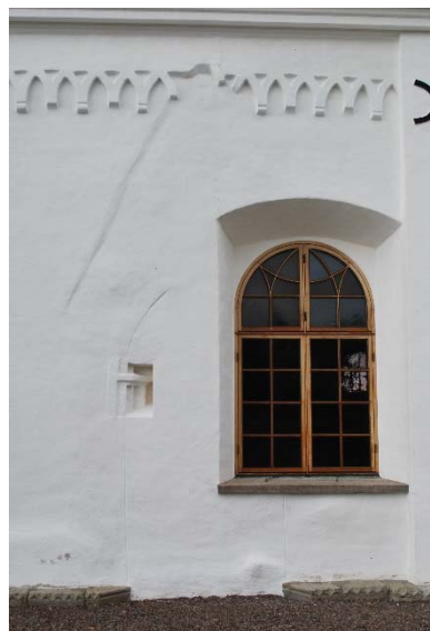
Fasad mot norr. Rester av nordportal.

Tornet är till skillnad från övriga kyrkan byggd av gråsten och är spritputsad. Tornet saknar sockel men utbuktande grundstenar är synliga. På sydsidan finns en stentavla med text om tornets historia. Murarna avslutas med en profilerad takfotsgesims. Till tornets klockvåning finns stora rundbågiga ljudöppningar med brädluckor i alla väderstreck. De omges av pelare med kapitäl och blinderingar.