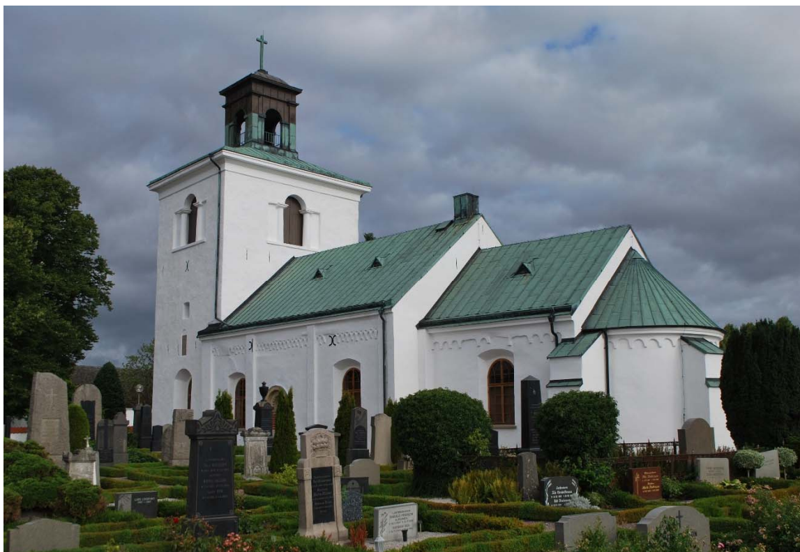
Fasad mot sydöst.