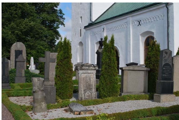
Kyrkogården söder om kyrkan.

Kyrkan omges av singel. Gravplatserna till och med 1902 års utvidgning omges av buxbom och är singelbelagda. Enstaka har järnstaket. Söder om kyrkan är stenarna högresta. Här finns bland annat stenar som avbrutna kolonner och naturromantiska trädstammar med eklövskrans. På flera gravplatser växer vintergröna växter. Lantbrukare är den vanligaste benämningen men flera titlar vittnar om havets närhet som fiskare, sjöman och hammmästare. Norr om kyrkan är stenarna nyare och horisontella.