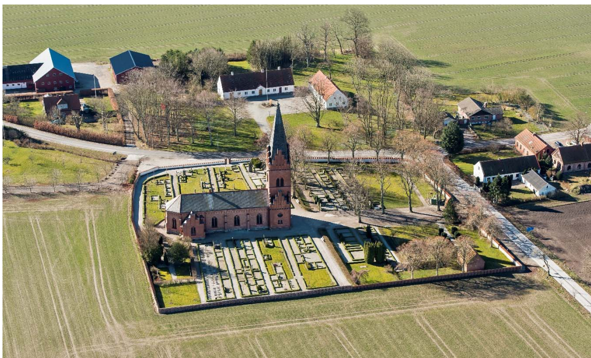
Från norr.

Kyrkogårdsmuren har reparerats och delvis nymurats vid flera tillfällen, bland annat 2000 och 2009.