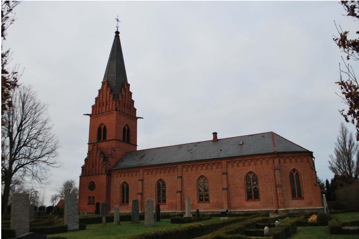
Fasad mot sydöst.