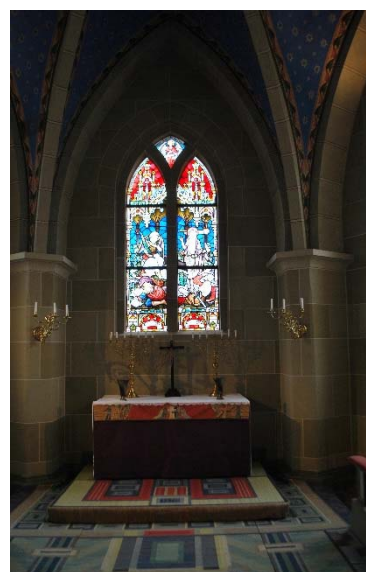
Altarfönstret med glasmålning.

Bänkinredningen är öppen och tillkom 1897. Ryggstöden från de äldre bänkarna återanvändes. Gavlarna i ramverk är sirligt figursågade. Gavlarna kröns av en rundad överdel. Bänkarna är målade i olika gröngrå toner med detaljer i gult och mörkgrått.