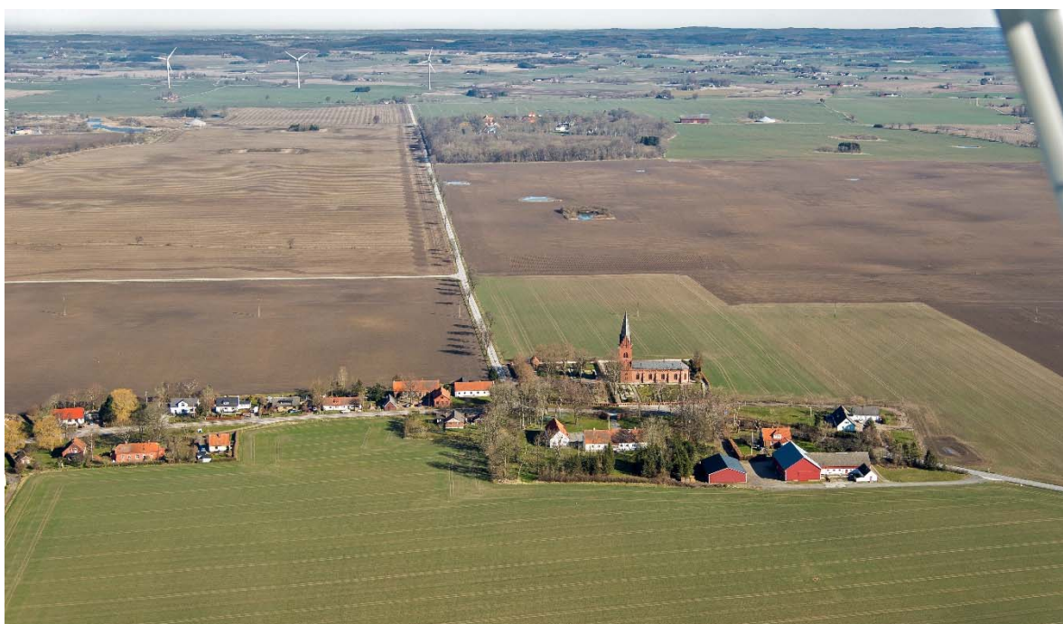
Från söder.

Källstorp ligger på Söderslätt i södra Skåne, mellan Trelleborg och Ystad. Slättbygden har Sveriges bästa åkerjord. De goda förutsättningarna för odling gjorde redan under förhistorisk tid området attraktivt. Kring 1000-talet, efter befolkningsökning och förbättringar inom jordbruket, skedde en omfattande bybildning. Under 1100-talet bildades socknarna och flera romanska kyrkor byggdes i området, ibland ersatte de en träkyrka. Socknarna var små och kyrkorna ligger tätt, vilket tyder på stor befolkning. I byn låg gårdarna samlade omgivna av odlingsmark indelad i en mängd smala tegar. Denna struktur behölls fram till enskiftet. Vid enskiftet i början av 1800-talet omvandlades landskapet. Jorden sammanfördes i större enheter, byn splittrades och flertalet gårdar flyttades ut från bykärnan. Gathus byggdes i byn efterhand istället för gårdarna.