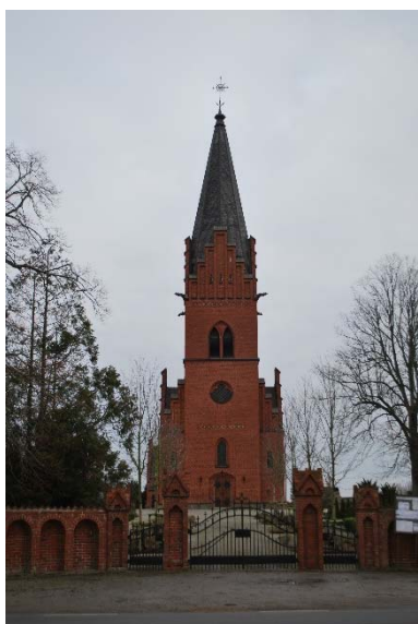
Fasad mot väster.