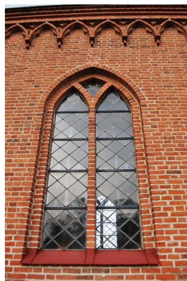
Fönster i långhuset och bågfri.

Kyrkans sadeltak och spira är täckt med mörkgrå skiffer. Takavvattningen på tornet var tidigare genom utkastare utformades som drakhuvuden gjutna i cement som inte längre används. Numera finns delvis invändiga stuprör i tornet. Avvattning är med fotrännor av koppar och röda stuprör. Trappgavlarnas tinnar samt strävpelarnas avtrappning är klädda med koppar.