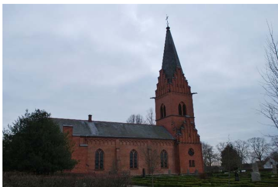
Fasad mot nordöst.

I sakristian finns en prästingång samt en dörr till källaren. Båda sitter i segmentbågiga öppningar.