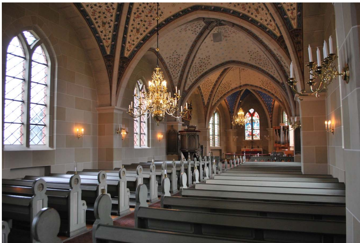
Långhuset mot koret i öster.

Kyrkorummet består av långhus och ett upphöjt kor i öster. I väster finns orgelläktaren. Öppna bänkar står på ömse sidor om mittgången i långhuset. Bänkarna går ut till ytterväggarna. På golvet ligger kvadratiske röda tegelplattor med formtryckt mönster. Under bänkkvarteren ligger brädgolv. Väggarna är målade med imiterade kvadrater i sandfärger och vita fogar. Varje kvader är målad med en bottenfärg och ovanpå med smala ränder i en annan nyans. Långhuset är välvt med tre fyrkappiga valv med rektangulära ribbor som vilar på höga, kraftiga pilastrar med kapital. Ribborna är kvadermålade och valvkapporna är dekormålade med växtornament av Svante Thulin.