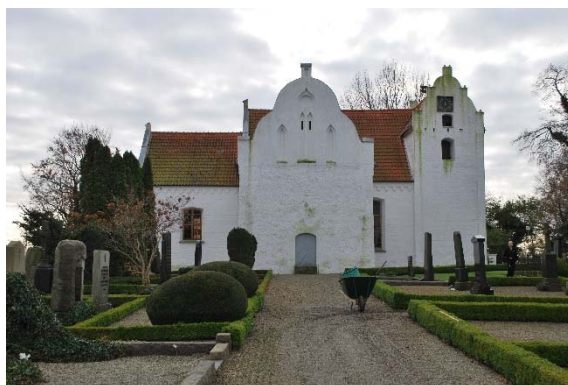
Fasad mot norr.

Huvudingången är i väster genom tornet. Denna ingång tillkom 1830. Ytterligare en ingång finns på nykyrkans norrsida. Båda öppningarna är segmentbågiga utan markerad omfattning. Dörrarna är klädda med diagonal panel målad ljusgråblå.