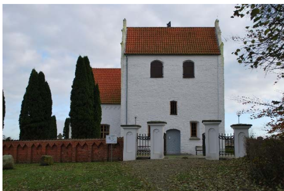
Fasad mot väster.

Tornet är brett, i liv med långhuset, och lågt. Hörnen markeras med lisener. Gavlarna är försedda med renässansgavlar antagligen tillkomna på 1600-talet. Ljudluckorna i tre väderstreck är täckta med brädluckor.