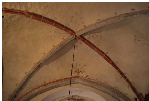
Kryssvalv i långhuset.