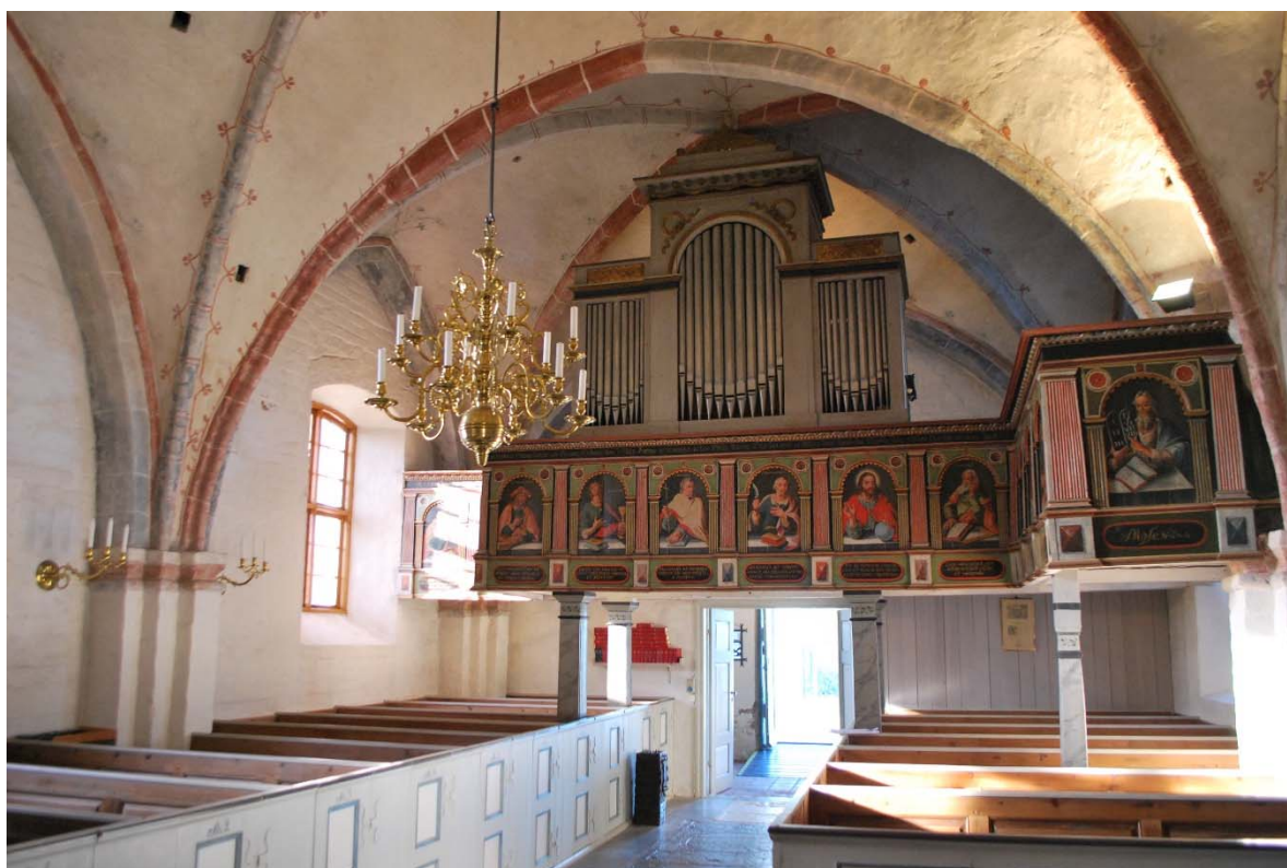
Långhuset mot orgelläktaren i väster.

Absiden är försedd med ett hjälmvalv som är putsat och vitkalkat. Tre rekonstruerade romanska fönster finns i absiden.