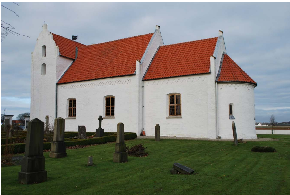
Fasad mot söder.