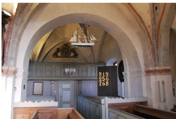
Korsarmen mot norr.

Vinden över långhuset nås genom en öppning från klockvåningen. Valven är oputsade och oisolerade. Valven är murade av halvstenstegel förutom absidens valv som är murat av helstenstegel. Ett romanskt fönster är synligt ovanför valven. Takstolen är en så kallad svensk takstol av furu med högben, hanband, stödben och remstycken. Takteplet ligger på underbrädning.