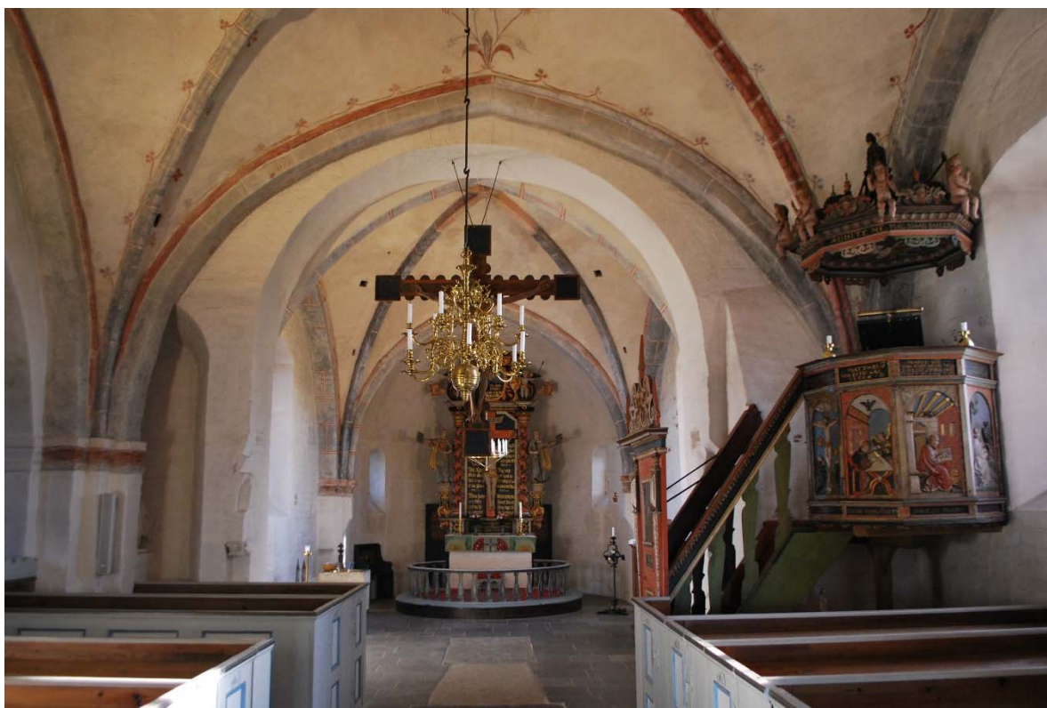
Långhuset mot koret i öster.

Kyrkorummet består av långhus, smalare kor med absid och en nykyrka i norr. Långhuset har två travéer, koret en och nykyrkan en travée. I långhusets västra del finns orgelläktaren. Slutna bänkar står på ömse sidor om en mittgång i långhuset. Bänkarna går ut till ytterväggarna. Golvet är belagt med kalksten och gravhällar i mittgången. Under bänkkvarteren ligger lackade furubrädor.