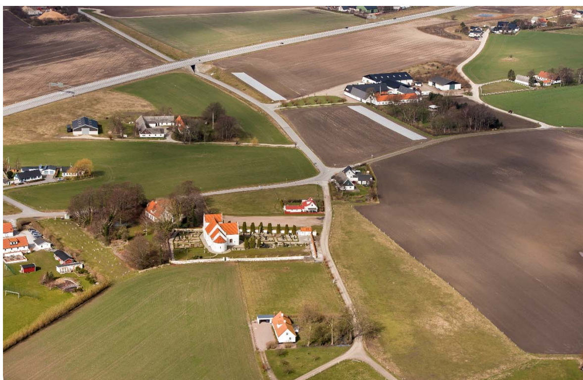
Från öster.

Maglarp ligger på Söderslätt strax nordväst om Trelleborg. Slättbygden har Sveriges bästa åkerjord. De goda förutsättningarna för odling gjorde redan under förhistorisk tid området attraktivt. Kring 1000-talet, efter befolkningsökning och förbättringar inom jordbruket, skedde en omfattande bybildning. Under 1100-talet bildades socknarna och flera romanska kyrkor byggdes i området, ibland ersatte de en träkyrka. I bykärnan låg gårdarna samlade omgivna av odlingsmark indelad i en mängd smala tegar. Denna struktur behölls fram till enskiftet i början av 1800-talet. På en karta från 1774 fanns det ett 20-tal gårdar och 20-tal gathus i Maglarp. Detta gjorde Maglarp till en av de större byarna i trakten. Längs byvägen låg gårdar på båda sidor med kyrkan på södra sidan av vägen. Väster om kyrkan fanns en byplats med damm och några