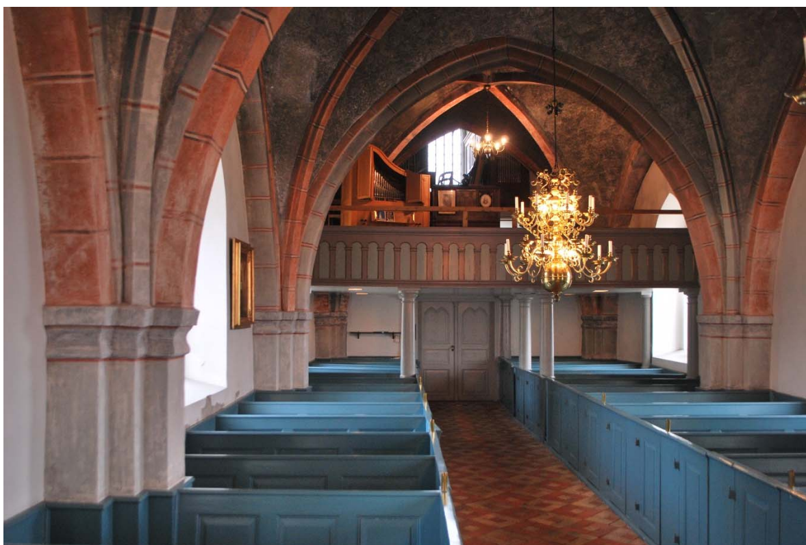
Långhuset mot orgelläktaren i väster.

Vinden över kyrkorummet nås från en lucka från ett lågt utrymme över vapenhuset. Valven är inte isolerade. Taklaget av furu består av sparrar, hanband, stödben, tassar. Underbrädningen är gjord med brädor monterade med ett par centimeters ventilationsspringa och plåten är lagd på brädorna utan mellanliggande papp. Korvinden är inte besökt. Enligt antikvarie Petter Jansson som gjort en byggnadsarkeologisk undersökning kan delar av taklaget över koret vara medeltida ekbjälkar, blandade med senare furubjälkar.