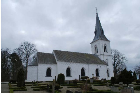
Fasad mot norr.