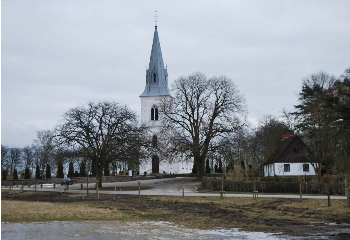
Fasad mot väster.