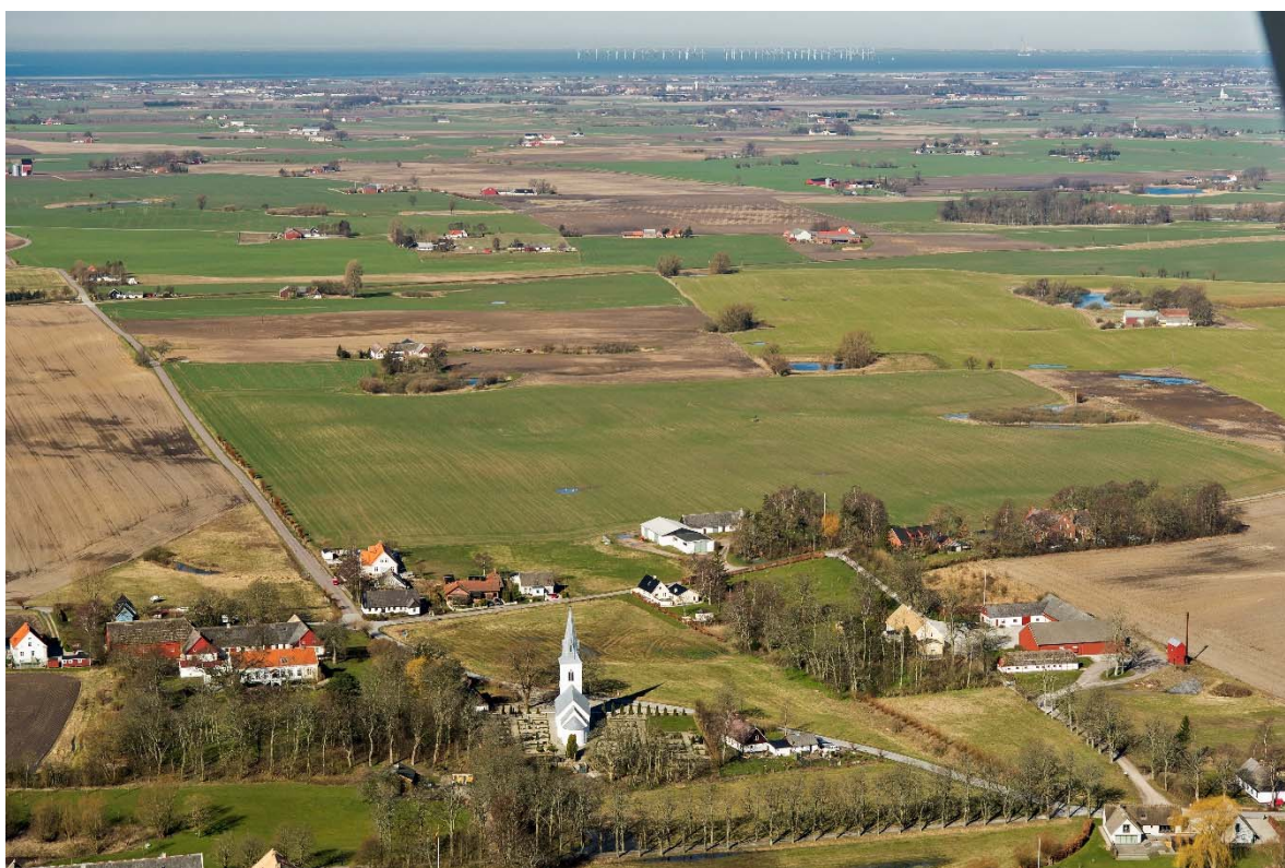
Från öster.

Stora Slågarp ligger på Söderslätt cirka en mil norr om Trelleborg. Slättbygden har Sveriges bästa åkerjord. De goda förutsättningarna för odling gjorde området attraktivt redan under förhistorisk tid. Kring 1000-talet, efter befolkningsökning och förbättringar inom jordbruket, skedde en omfattande bybildning. Under 1100-talet bildades socknarna och flera romanska kyrkor byggdes i området, ibland ersatte de en träkyrka. Eventuellt har uppkomsten av socknarna Lilla Slågarp och Stora Slågarp (Slokethorp på 1300-talet) ett ursprung i en huvudgård som delades upp i två gårdar under tidig medeltid. Möjligen byggdes Slågarps kyrkor som gårdskyrkor. En fornlämning i närheten (RAÄ Stora Slågarp 35:1) som hittades i slutet av 1800-