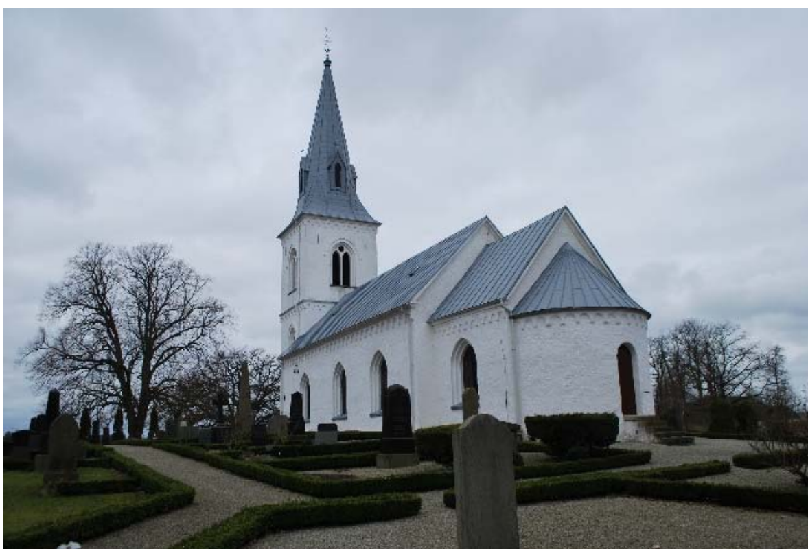
Fasad mot sydöst.

En prästingång finns i absiden i en enkel rundbågig öppning med en raktäckt modern enkeldörr med ett rundbågigt fönster som överljus. En kalkstenstrappa leder till absidingången.