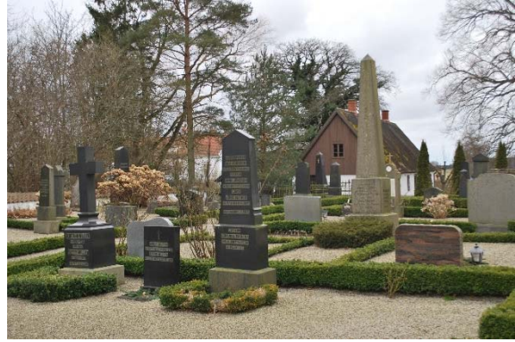
Kyrkogård på södra sidan.

Långhus och kor har sadeltak, absiden halvcirkelformat kägeltak och tornet spira. Torntaket har en fyrkantig bas och därovan en åttkantig spira krönt av en tupp. Små takkupor med sadeltak finns på torntaket i alla väderstreck. Samtliga tak är belagda med skivlagd gråmålad plåt. På allt utom tornet är det förskjutna horisontella hakfalsar i plåten. Avvattningen är av vita hängrännor och stuprör, förutom på absiden som har ny grå ränna.