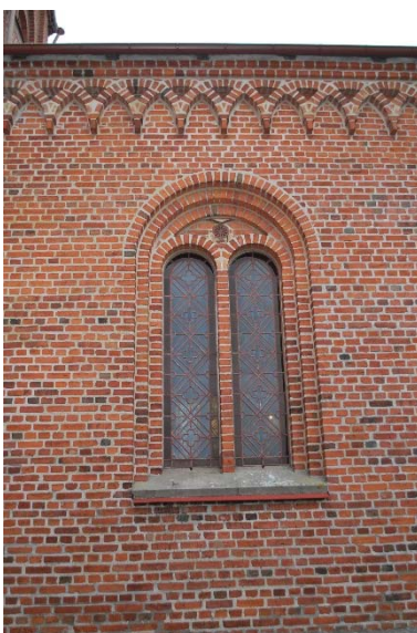
Takfris och fönster.