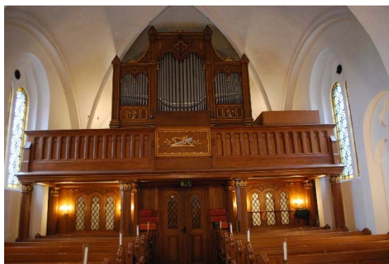
Mot orgelläktaren i väster.

Koret ligger två steg högre än övriga kyrkorummet. Golvet är belagt med Victoriaplattor med blommönster. I koret står altaruppsatsen innanför altarringen. Två sjuarmade golvlysstakar står på ömse sidor om altarringen och Helgo Zettervalls dopfont i norr. Koret är välvt med kryssribbvalv och har nischer i murarna likt övriga kyrkan.