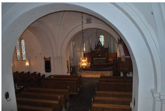
Från orgelläktaren mot koret.

Predikstolen står i sydöst och en ljusbärare i nordöst i korsmitten.