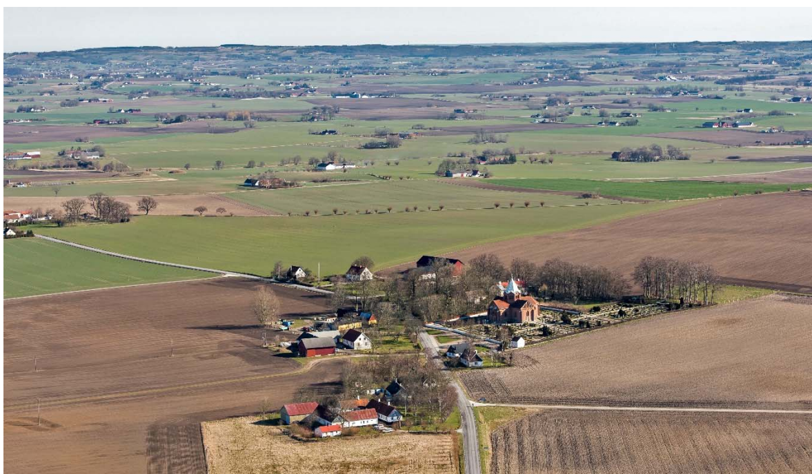
Från sydväst.

Tullstorp ligger på Söderslätt i södra Skåne, mellan Trelleborg och Ystad. Tullstorp socken består av byarna Tullstorp, Stora Beddinge och fiskeläget Skateholm. Efterledet -torp anses härstamma från vikingatid eller tidig medeltid. Det har betydelsen nybygge och förledet är ett mansnamn.