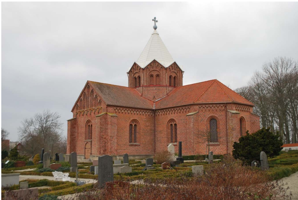
Fasad mot sydöst.