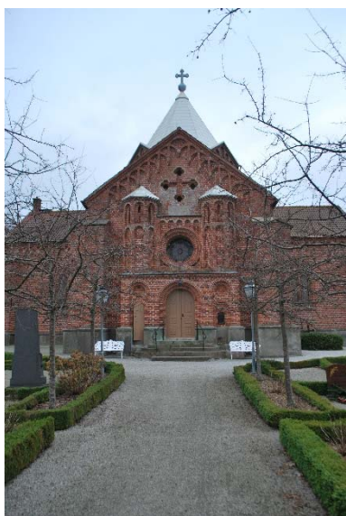
Entréfasad mot väster.

Kyrkan har tre ingångar samt torningång och ingång till pannrum. Huvudentré i väster, prästingång i öster och en sekundärt upptagen dörr i söder. Entrén i väster omges av en rikt artikulerad framspringande symmetrisk portal med två trapporn med blinderingar vid sidorna och ett rosettfönster med blyinfattat färgat glas ovanför porten. Porten är rundbågig med två språng och har en pardörr av ramverk med dekorativa fyllningar. Även prästingången omges av en rundbågig öppning med två språng. Dörren är en fyllningsdörr med glas. Söderportalen togs upp 1892 och är rundbågig med en pardörr av ramverk med dekorativa fyllningar. Torningången är en smal rundbågig öppning med en bräddörr. Samtliga dörrar är målade i gulbrunt.