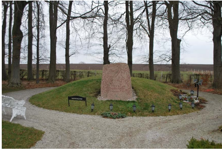
Runsten från 980-tal vid minneslunden längst i öster.