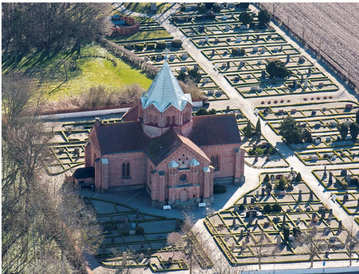
Från söder.

fiskare, en titel som visar att det inte är långt till kusten. Längst i öster finns en lund med stora bokträd och en kulle med en ditflyttad runsten. Stenen tros vara från 980-talet när Danmark just blivit kristnat. Stenen restes av ett par över den troliga stormannen Ulf. Ett kors avslutar runtexten på stenen. Ett stort fabeldjur och ett skepp finns också på runstenen. Den har varit inmurad i den gamla kyrkan, sedan i kyrkogårdsmuren och på 1920-talet flyttades den till sin nuvarande plats som används som minneslund. I nordöst finns även ett lapidarium med äldre stenar samlade under tak omgivna av en bokhäck. I väster är en askgravlund ordnad med små gravplatser med liggande stenar omgärdade med buxbom inom äldre gravplatser.