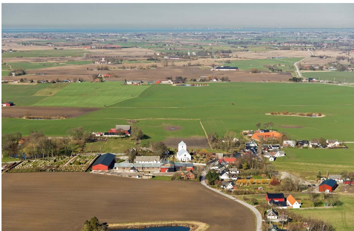
Från öster.

Västra Alstad ligger på Söderslätt en mil nordöst om Trelleborg. Den platta slätten vid havet övergår i ett backlandskap i norra delen. Slättbygden har Sveriges bästa åkerjord. De goda förutsättningarna för odling gjorde området attraktivt redan under förhistorisk tid. Kring 1000-talet, efter befolkningsökning och förbättringar inom jordbruket, skedde en omfattande bybildning. Under 1100-talet bildades socknarna och flera romanska kyrkor byggdes i området, ibland ersatte de en träkyrka. På Söderslätt är socknarna små och kyrkorna ligger tätt. Namnet skrevs Alstedwestre på 1500-talet, namnet tros härstamma från al. På en karta från 1714 över byn finns ett femtontal kringbyggda gårdar samlade runt en allmänning i mitten med kyrkan i östra delen av byn. Kyrkbyn var omgiven av odlingsmark indelad i en mängd smala tegar.