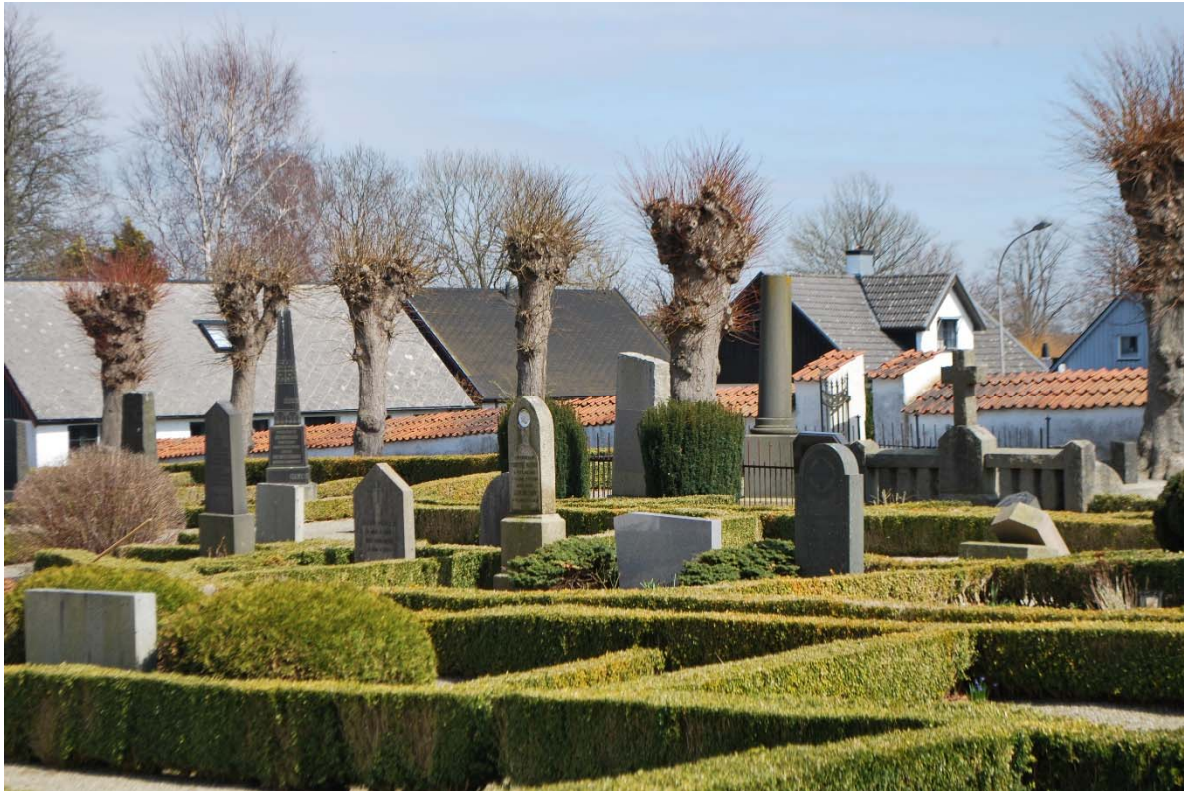
Kyrkogården i nordöst.