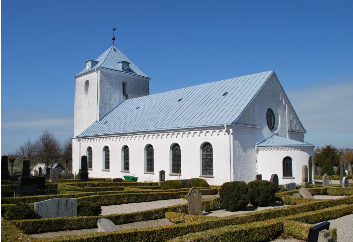
Fasad mot sydöst.