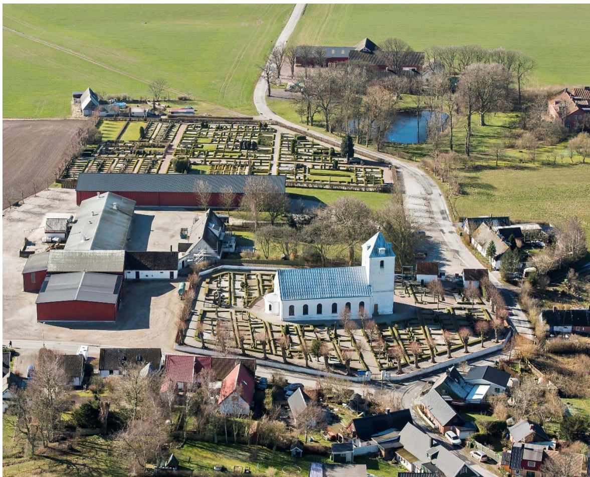
Från norr.