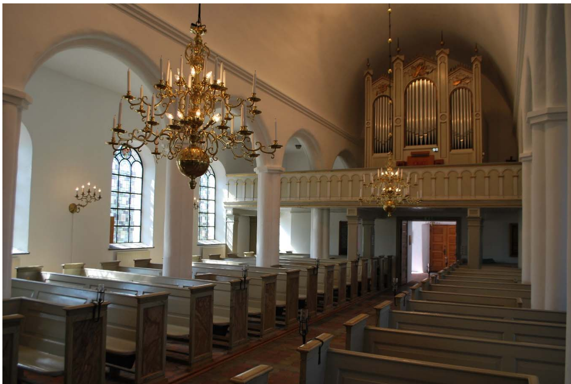
Långhuset mot orgelläktaren i väster.

Orgelläktaren i väster upptar hela långhusets bredd. Läktaren bärs av kvadratiska träpelare. Undersidan är klädd med målad pärlspontpanel. Den täta orgelbarriären är indelad med en rundbågsarkad och målad i vitt, beige och guld. På läktaren står orgeln och bänkar.