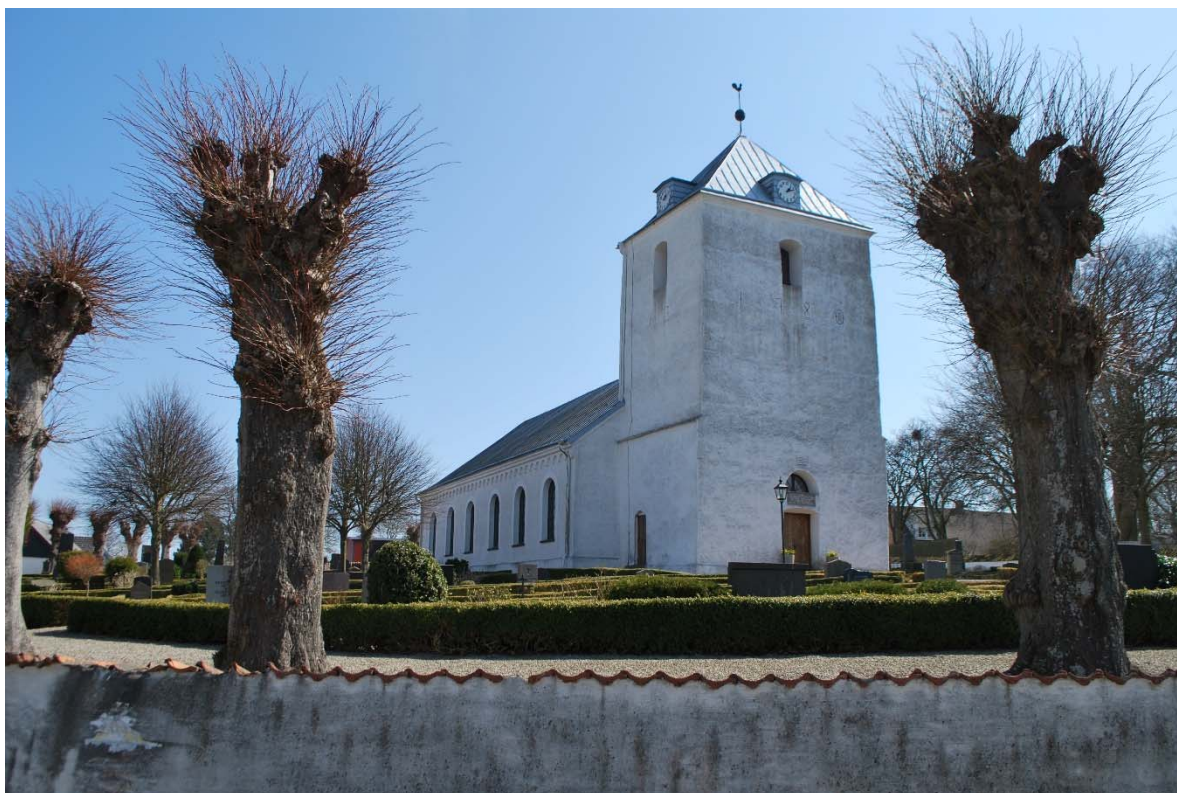
Fasad mot nordväst.

Tornets murar är avtrappade i skiljelinjen mellan den medeltida första våningen och den övre delen från 1780. Ankarjärn bildar det årtalet på tornets västra vägg. Tornets bottenvåning har tjocka väggar, cirka 1,3 meter.