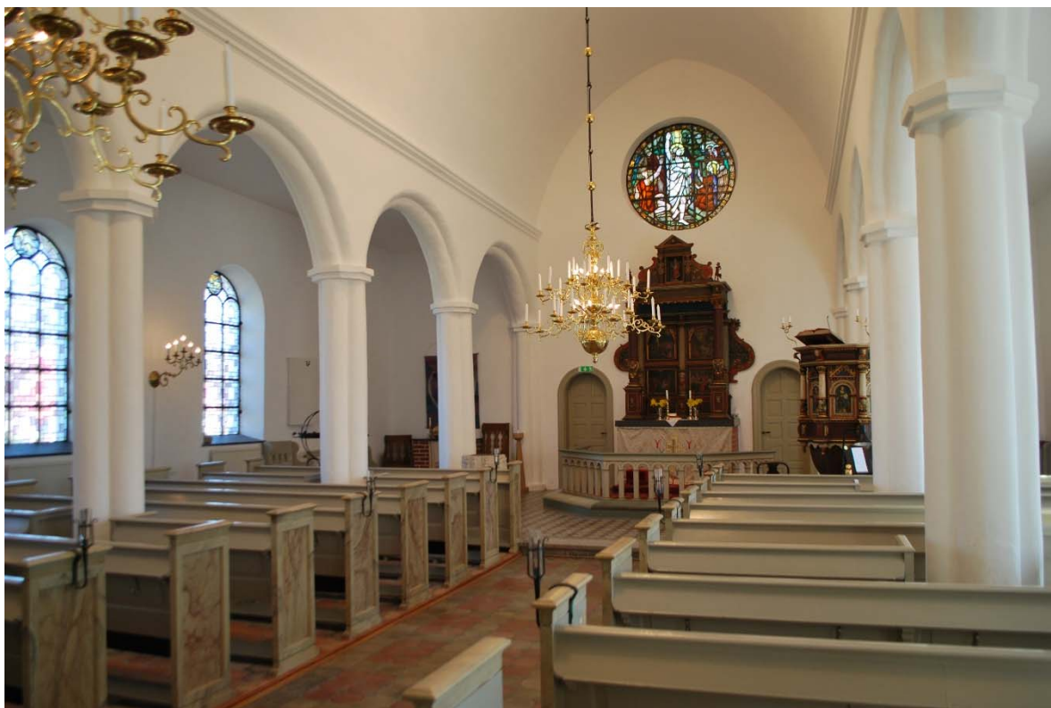
Långhuset mot koret i öster.

runt fönster i korets östvägg. Fönsterbänkarna är täckta med mörk kalksten. Kyrkorummets mittskepp är välvt med ett spetsbågigt trävalv medan sidogångarna har plana tak. Samtliga väggar och innertak är slätputsade och vitfärgade. Valvet bärs upp av två rundbågsarkader med vita kolonner med fyrklöverformat tvärsnitt. Mellan valvet och arkaden löper en bred profilerad list. Från taket hänger mässingskronor och på väggarna sitter mässingslampetter.