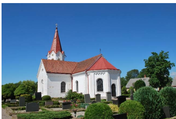
Fasad mot sydöst.

Tornet är åttkantigt och indelat i tre nivåer avdelade med horisontella listverk som är avtäckta med röd plåt. Mellanvåningen är indelad med lisener. Den övre delen har rundbågiga nischer med ett språng på alla åtta sidorna. Fyra av dem är ljudöppningar med brädluckor som på utsidan är täckta med gulmålade skivor. De övriga är putsade och gulmålade blindluckor. Tornmurarna avslutas uppåt med åtta gavlar med tandsnitt och en rund blinding i varje gavelröste. Tornet har en utkragande portal med kyrkans huvudingång. Portalen har sadeltak samt listverk och tandsnitt.