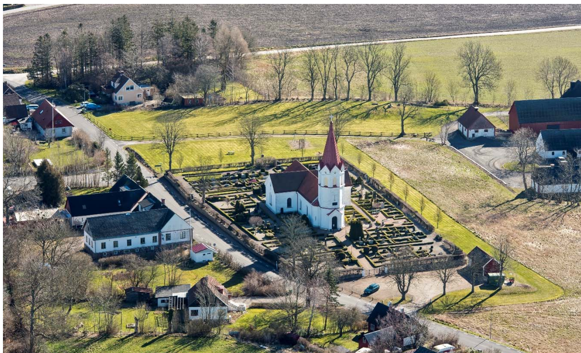
Från nordväst.

stenomfattning eller smidesräcke. Stenarna är högresta blandat med lägre horisontella nyare stenar. Lantbrukare är den vanligaste titeln. På östra sidan finns endast låga horisontella nyare stenar. Sydväst om kyrkan står kalkstenshällar från 1700-1800-talet. Här finns även den nyinrättade askgravlunden med metallplattor på en steninramning runt en plantering. Längs södra sidan av kyrkogården står återtagna äldre gravstenar uppställda. På kyrkogården växer en blodlönn och buskar av syren, magnolia och vintergrönt.