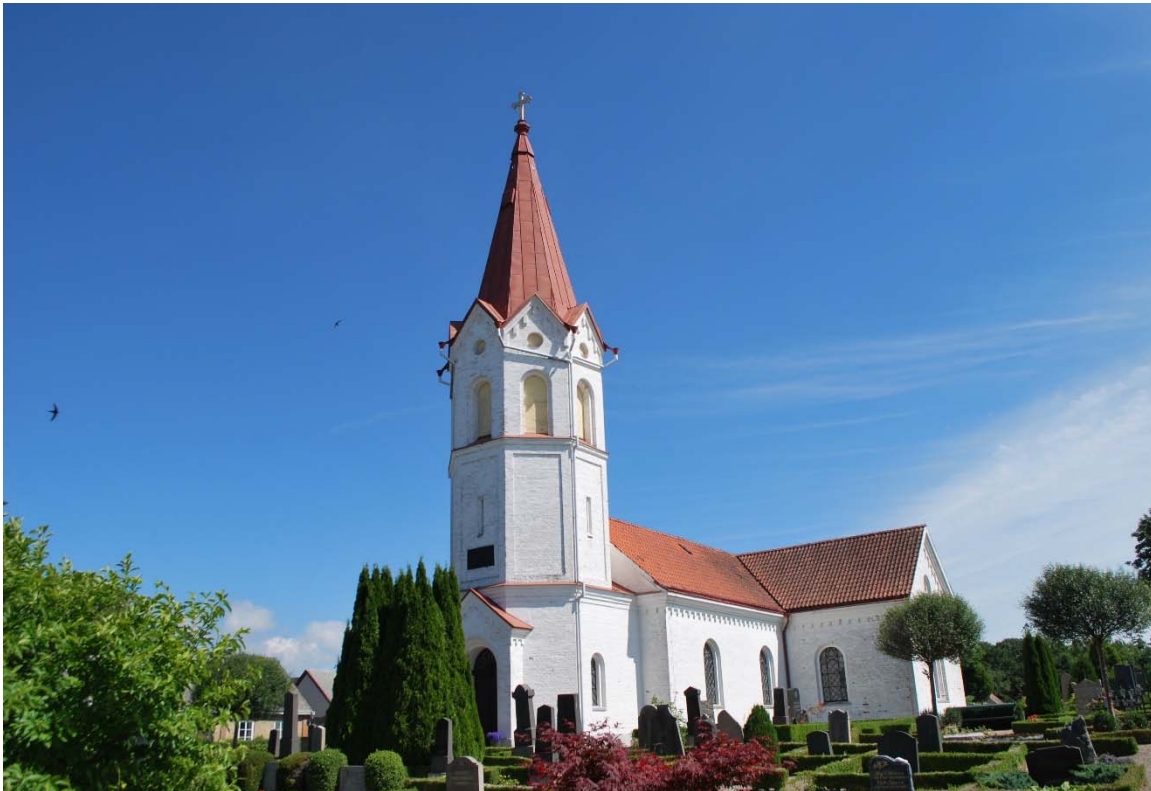
Fasad mot sydväst.