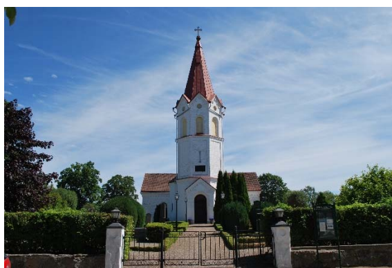
Fasad mot väster.

Kyrkan har två ingångar, huvudingång i tornet i väster och prästingång i absiden i öster. Portalen i väster har en rundbågig öppning med två språng med en pardörr av ramverk och fyllningar målade mörkbruna. Ovanför sitter ett spröjsat lunettfönster. Prästingången sitter i en rundbågig öppning med en brunmålad enkeldörr av ramverk