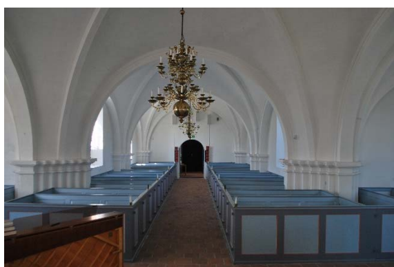
Långhuset mot väster.