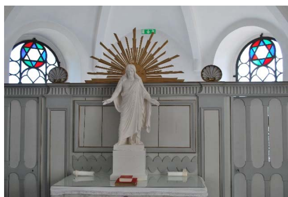
Altarvägg och Thorvaldsen Kristusskulptur.

Södra korsarmen har golv, väggar och slutna bänkar med mittgång lika som i långhuset. I norra korsarmen finns endast två bänkrader. I korsarmens norra del är golvet upphöjt och belagt med målade brädor. Här står ett långbord med stolar. En tegeltrappa i vapenhuset leder till tornets övre våningar. På första våningen finns en lucka ut till vinden över kyrkorummet. En brant trätrappa leder vidare till klockvåningen med klockbocken med en klocka från 1200-talet. Brädor ligger på golvet, tegelväggarna är tunt putsade. Ljudöppningar finns i alla väderstreck. På första våningen förvaras ett träkors som förmodligen varit altarprydnaden före bytet till Thorvaldsen Kristusskulptur. Valven över kyrkorummet är isolerade med lösull.