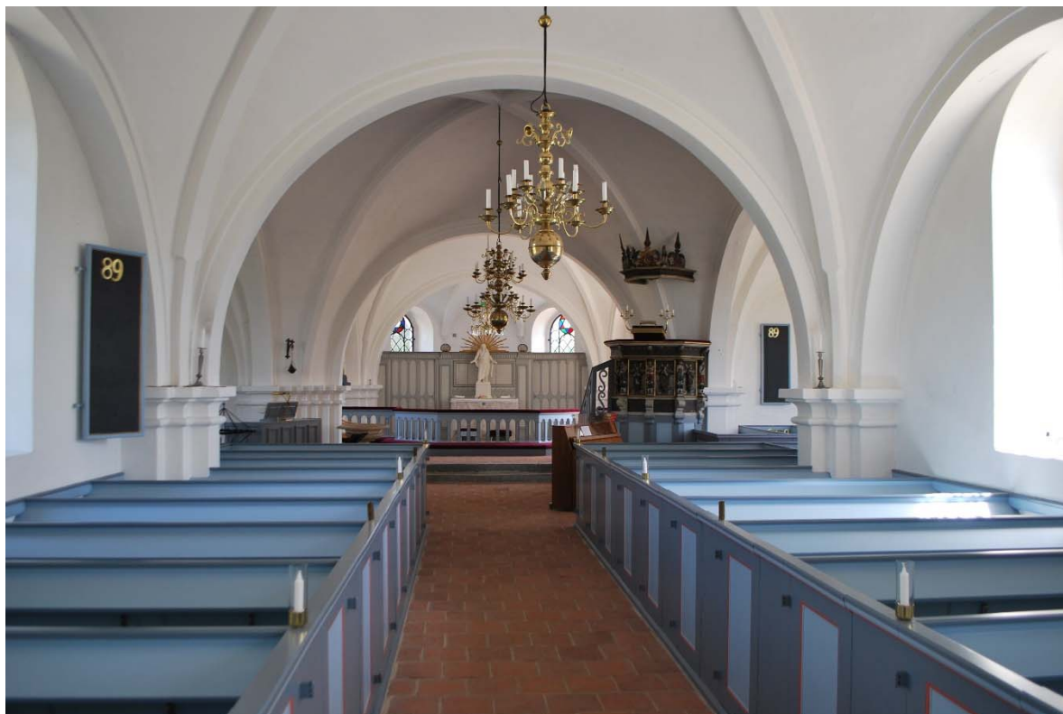
Långhuset mot altaret i öster.

målat brädgolv och väggarna vitputsade. I absiden finns klädförvaring och värdeskåp.