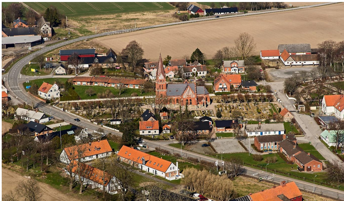
Flygbild över Glemminge kyrka och kyrkogård från söder med landsvägen, väg 9, mellan Ystad och Simrishamn, som rundar kyrkan. Foto: Pär-Martin Hedberg, 2014.

Glemminge är en medeltida socken och det äldsta kända belägget härstammar från 1334. Glemminge kyrka är belägen i Glemmingebro strax öster om landsvägen mellan Ystad och Simrishamn. Området är fornlämningsrikt med stenåldersboplatser och bronsåldershögar, vilket vittnar om en lång bosättningskontinuitet och i kyrkogårdsmuren finns en inmurad runsten. I början av 1800-talet bestod byn av ett 30-tal gårdar, men vid enskiftet 1807 flyttade flera gårdar ut ur bykärnan.