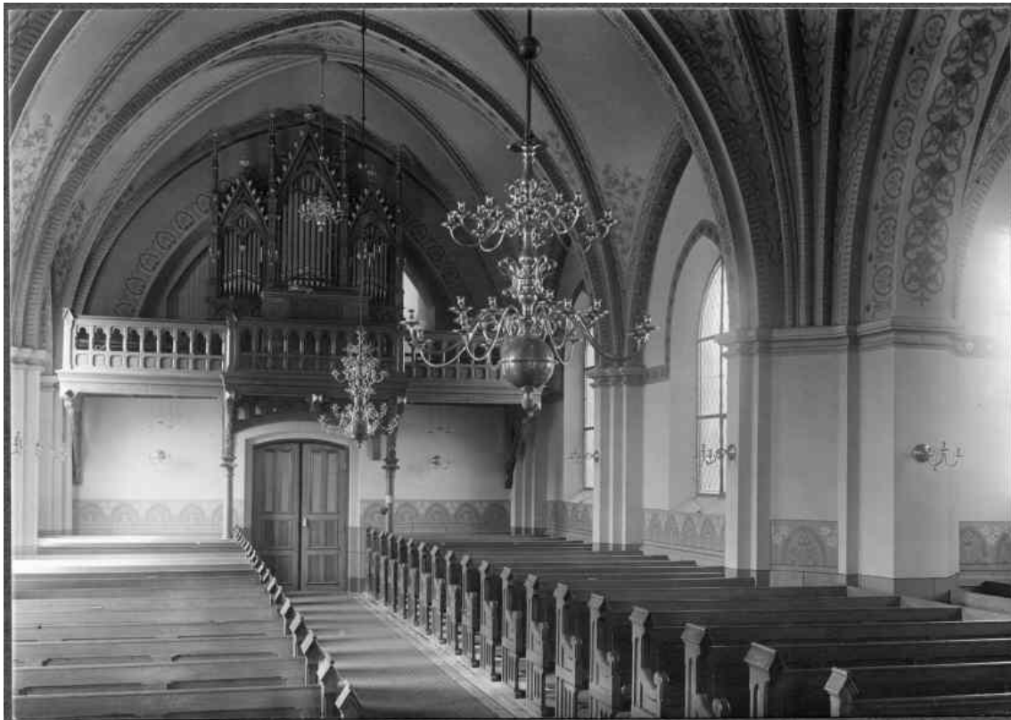
Glemminge kyrkas interiör mot öster respektive väster.