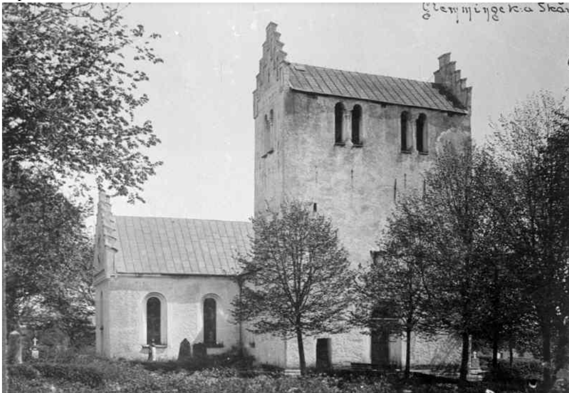
Glemminge medeltida kyrka. Foto: Otto Rydbeck 1898. Bilden är hämtad från Riksantikvarieämbetets bild databas Kulturmiljöbild.

1749 tillbyggdes en korsarm eller nykyrka mot norr och i mitten av 1800-talet revs vapenhuset i söder och ersattes av en korsarm.