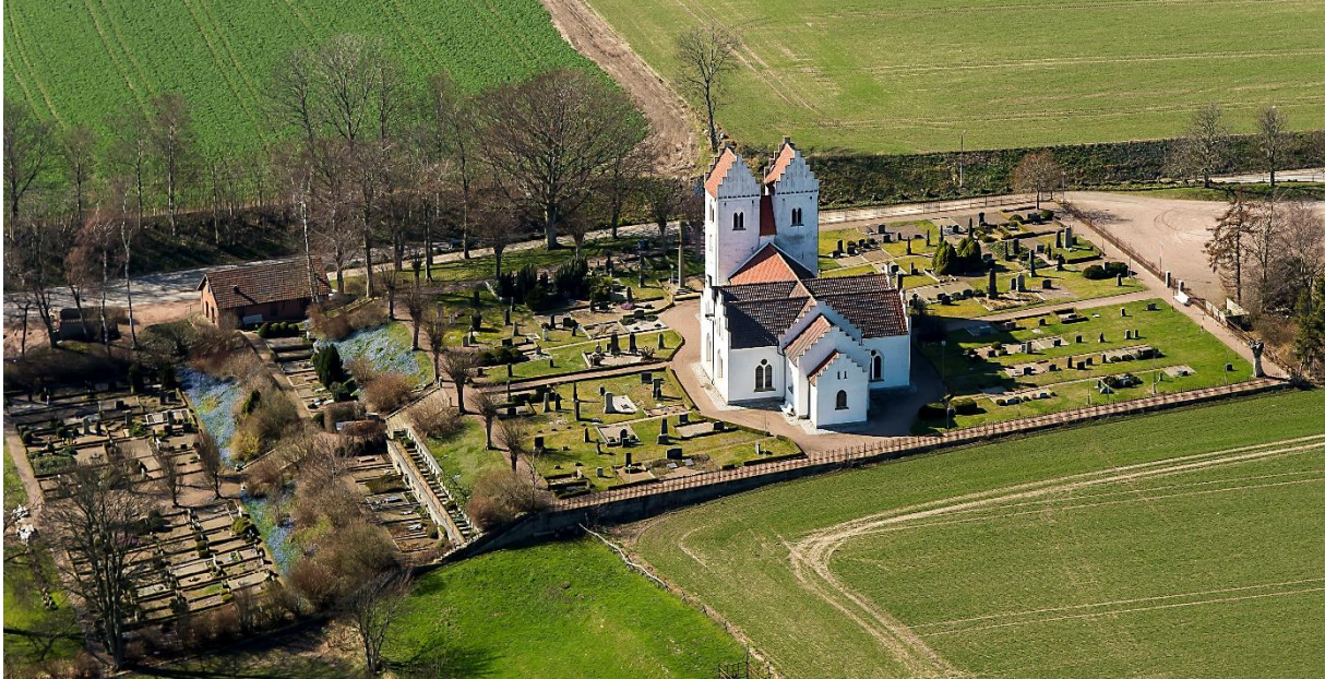
Kyrkogården från öster med den yngre kyrkogården i slutningen mot söder och den äldre närmast kyrkobyggnaden. Foto: Pär-Martin Hedberg, 2014.

kyrkobyggnaden i söder, norr och väster. Det har bevarat en äldre struktur med symmetriskt anlagda grusade gångar. Lantbrukare dominerar som titlar på gravplatserna, men även hantverkartitlar samt titlar med anknytning till Gyllerups säteri. Närmast kyrkan finns stensatta partier med storgatsten och grusade gångar.