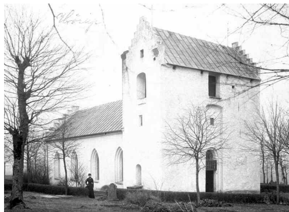
Hörups kyrka före den omfattande ombyggnaden 1905–1909. Foto t.v. okänd, t.h. Theodor Wählin. Bilderna är hämtade från Riksantikvarieämbetets bild databas Kulturmiljöbild.

Mellan 1905–1909 genomgick kyrkan en omfattande ombyggnad efter ritningar utförda av domkyrkoarkitekt Theodor Wählin med användning av Ludvig Petersons förslag från 1893. Wählin (1864–1948) var domkyrkoarkitekt i Lund mellan åren 1902–1943. I sina restaureringsuppdrag försökte han bevara byggnadsverkens olika historiska tillägg, även om han, liksom många andra arkitekter, hade svårt för den föregående generationens tillägg. Långhuset försågs med korsarmar i söder och norr och tornet med dubbla tornöverbyggnader eller avslutningar. Brunius kor och absidformade sakristia revs och ersattes av ett nytt kor och kvadratisk sakristia i öster. Taken belades med rött tegel och kyrkan fick nya fönster och