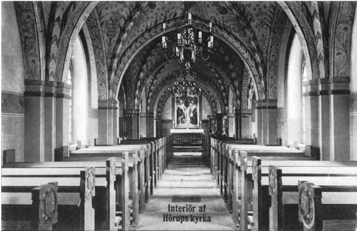
Interiör av Hörups kyrka mot öster.

Hörup kyrkomiljö ingår i området Ingelstorp-Valleberga-Löderup-Hagestad som är utvärderat som Särskilt värdefull kulturmiljö i Kulturmiljöprogram för Skåne, framtaget av Länsstyrelsen.